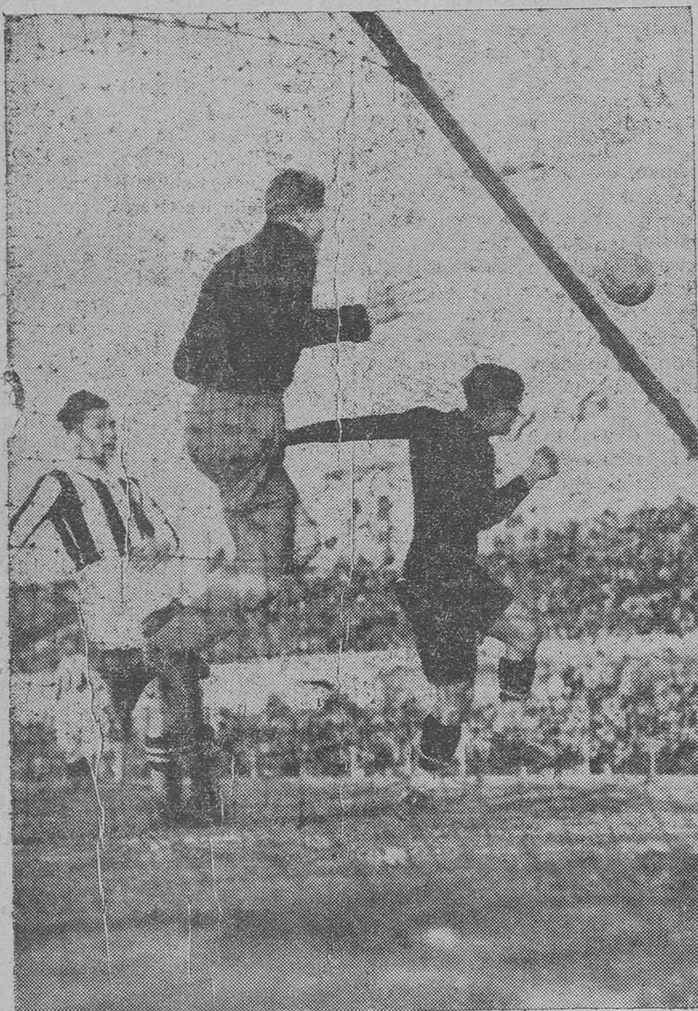
UN MOMENTO DE PELIGRO PARA LA META CHECA

La representación checa no ha dado motivo para que mejoráramos la opinión que de su fútbol teníamos formada. De cualquiera de los tres principales equipos checos que nos han visitado, Sparta, Slavia y Cechie Kadin, recordamos actuaciones no ya iguales, sino incluso mejores que la tenida hoy por los seleccionados de Praga.