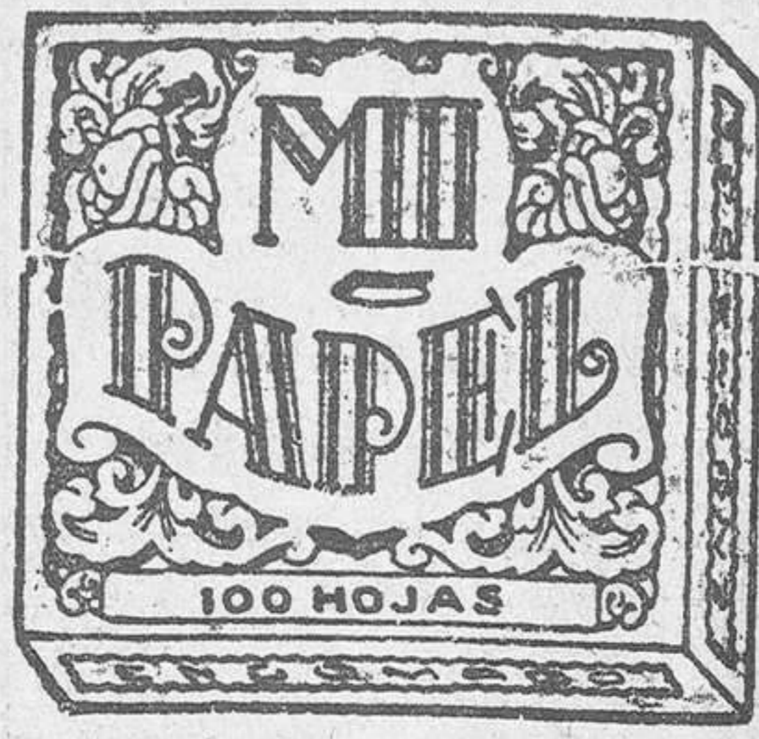
(MARCA DE FABRICA)