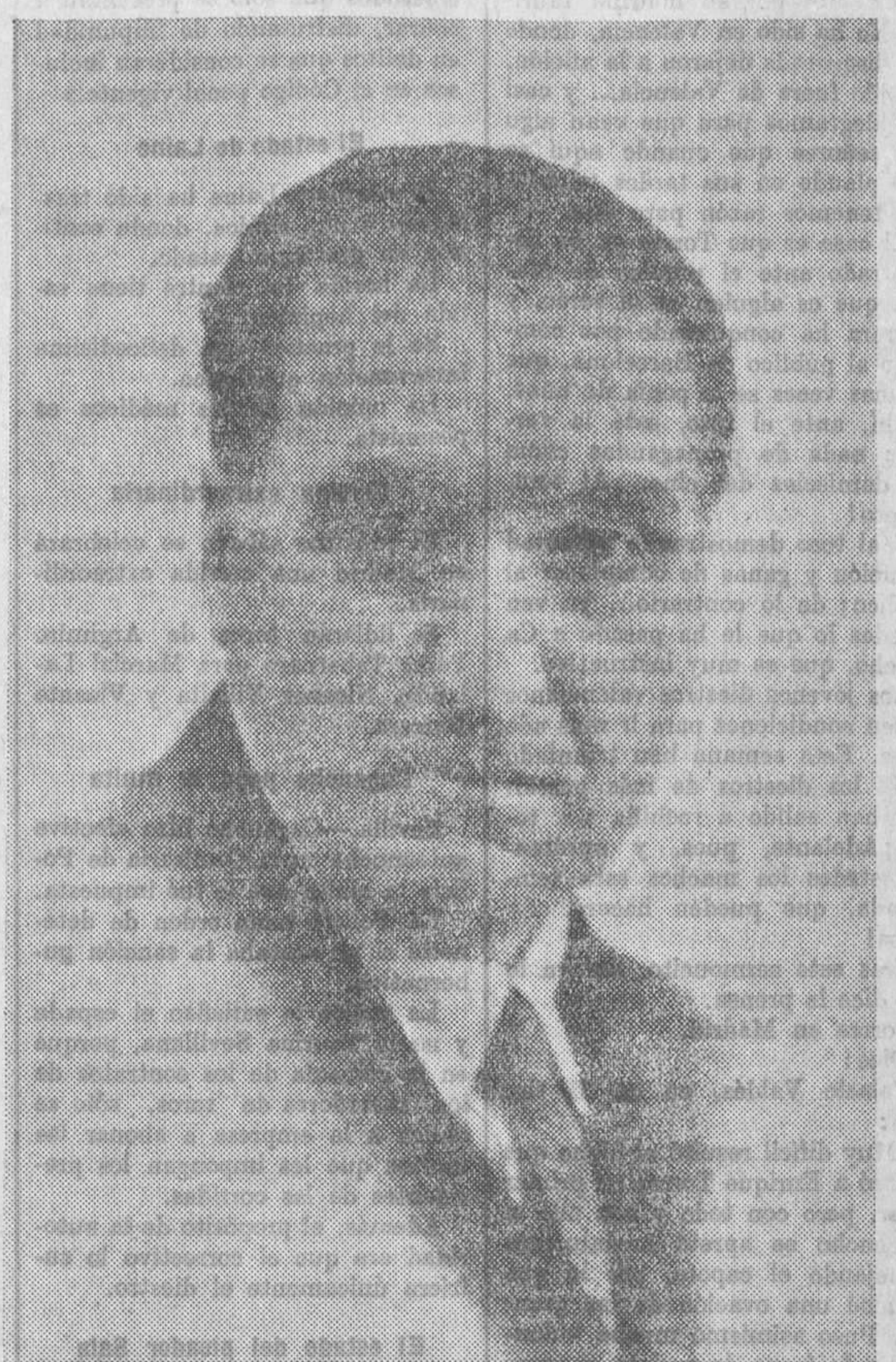
Sagli-Barba, el celebrado barítono que recorre todos los escenarios de Levante estos días, demostrando su valía