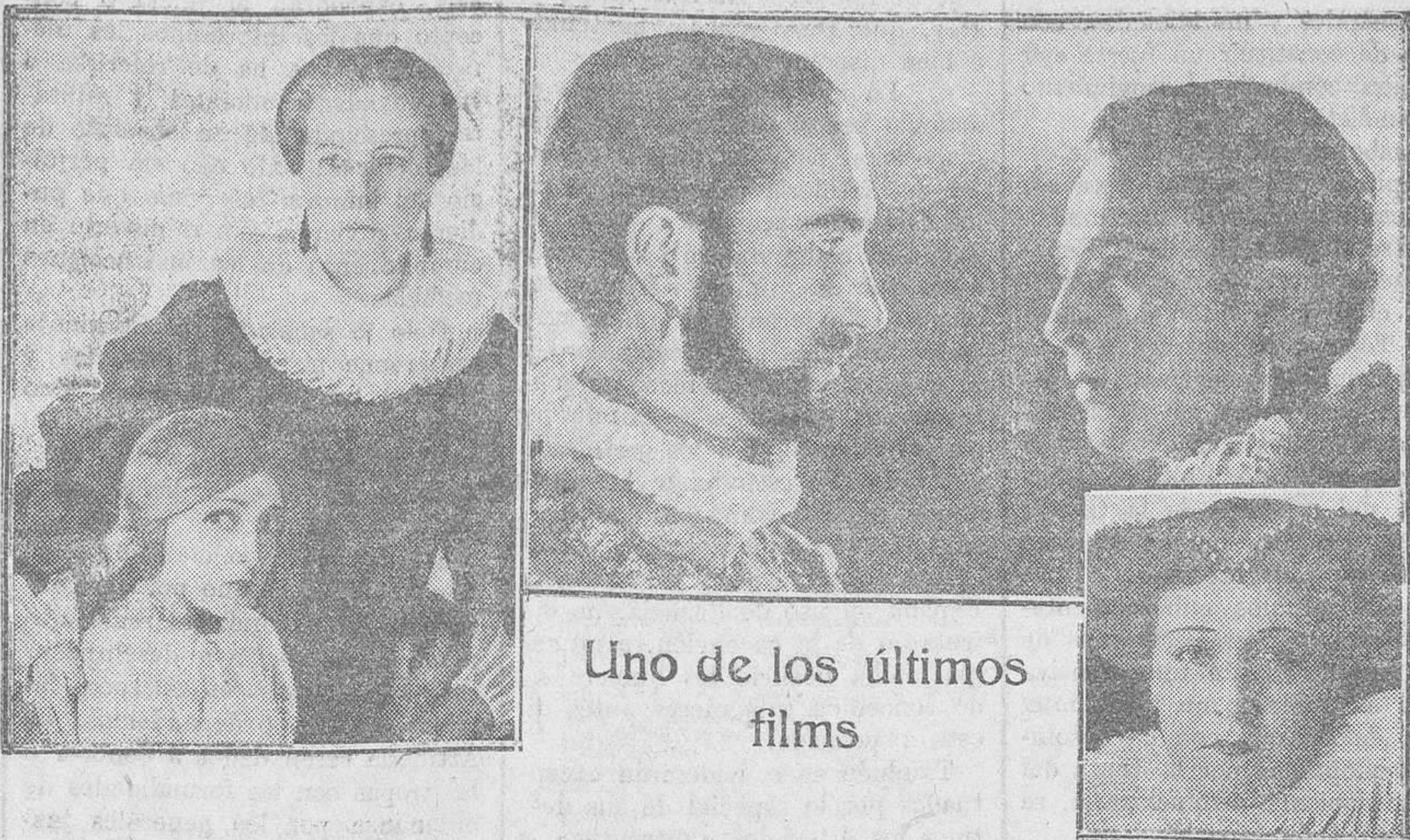
Uno de los últimos films

En breve será presentada al público la producción histórica de Jean Renoir «El Torneo». Como es sabido, las escenas principales de esta notable película, ueon tomadas el año pasado en Carcasona durante las fiestas del «milenario» de esa ciudad mediterránea.