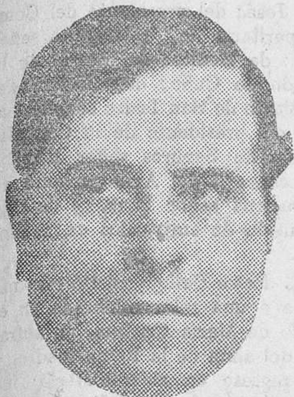
GOMEZ DE LA SERNA

El despacho de Ramón es como una caja o un cofre en el que se hubiese ido guardando todas las cosas que estorbaban. Nada mejor que copiar lo que el mismo escribió en el libro de «Pombox» para que el lector se haga una idea: