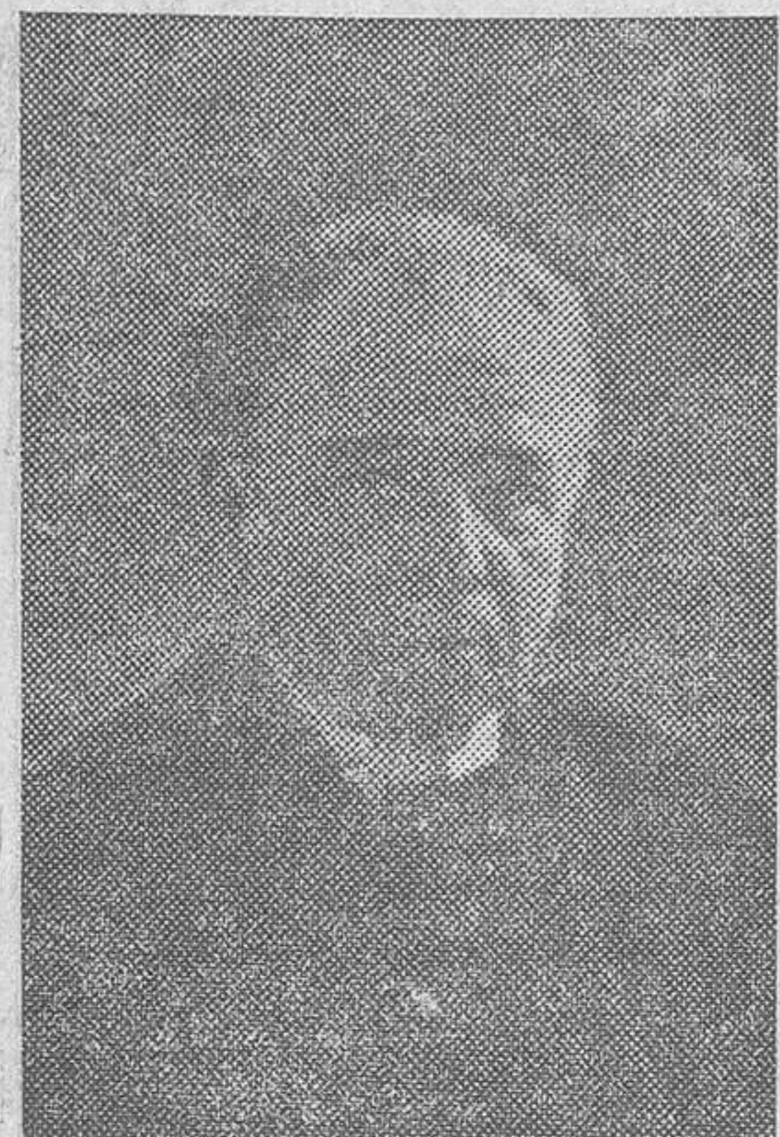
LAMBERTO ALONSO último retrato del ilustre artista valenciano

Ha muerto el maestro Lambertito Alonso. Para la pasada generación esta noticia constituirá de seguro un motivo de duelo general; para los modernos sólo constituirá un sentimiento a «flor de labia», nacido del recuerdo.