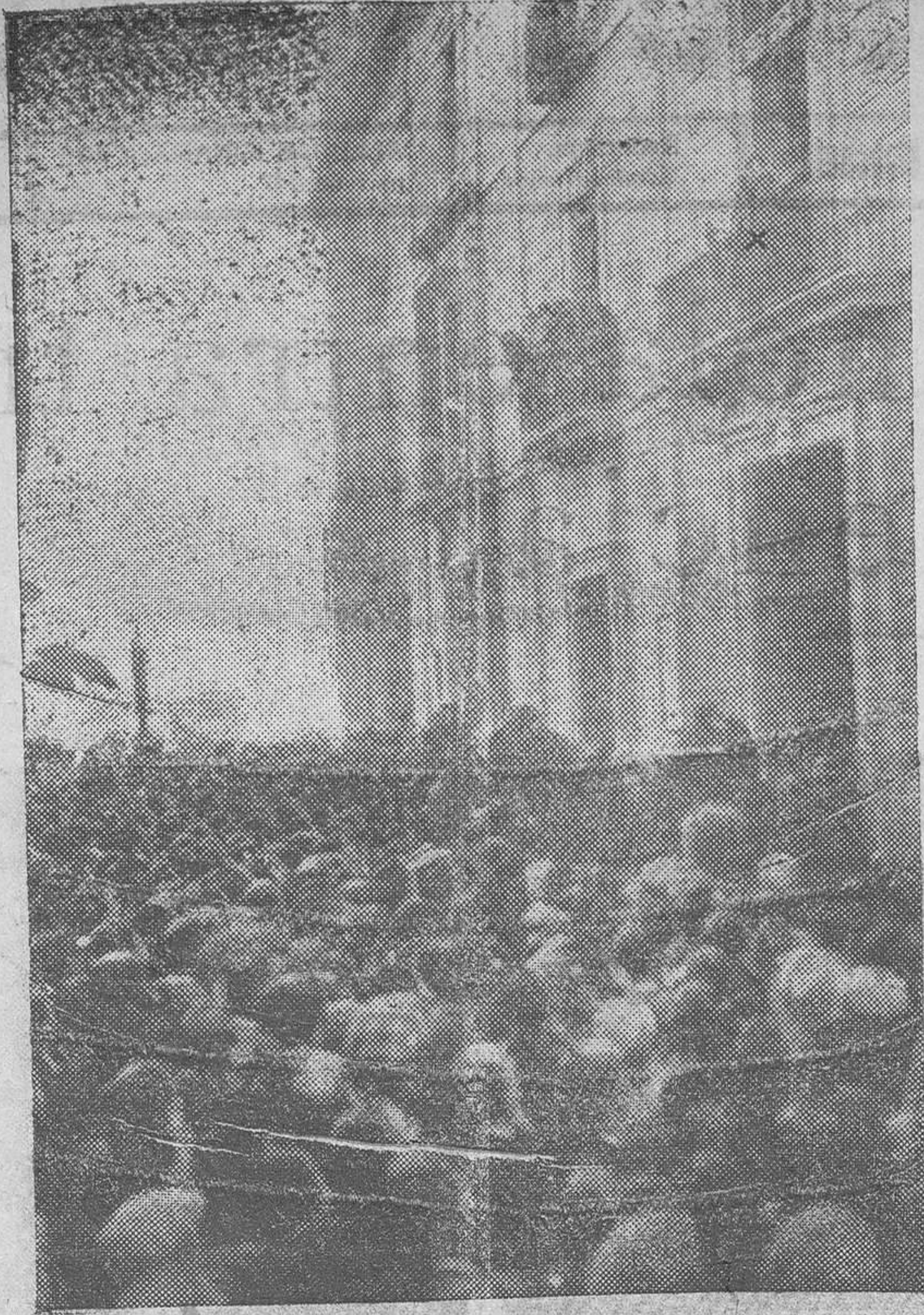
La reina de la belleza asomada al balcón central de las Casas Consistoria es saludando al público que la aclama.

Terminado este acto religioso, tomó nuevamente el coche, y por la plaza de la Almoina, Palau, Trinquete de Caballeros, plaza de la