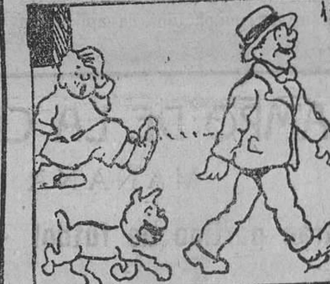
15. a que había atado a "Sultán". Y ya satisfechos de haberse tomado buena justicia por su mano, volviéronse a su casa, en tanto el señor Vicente se prometía no poner jamás mano en perro alguno.

Esta obra es propiedad de la Editorial Núñez Samper, Don Martín de los Heros, 13, Madrid, donde se halla en venta