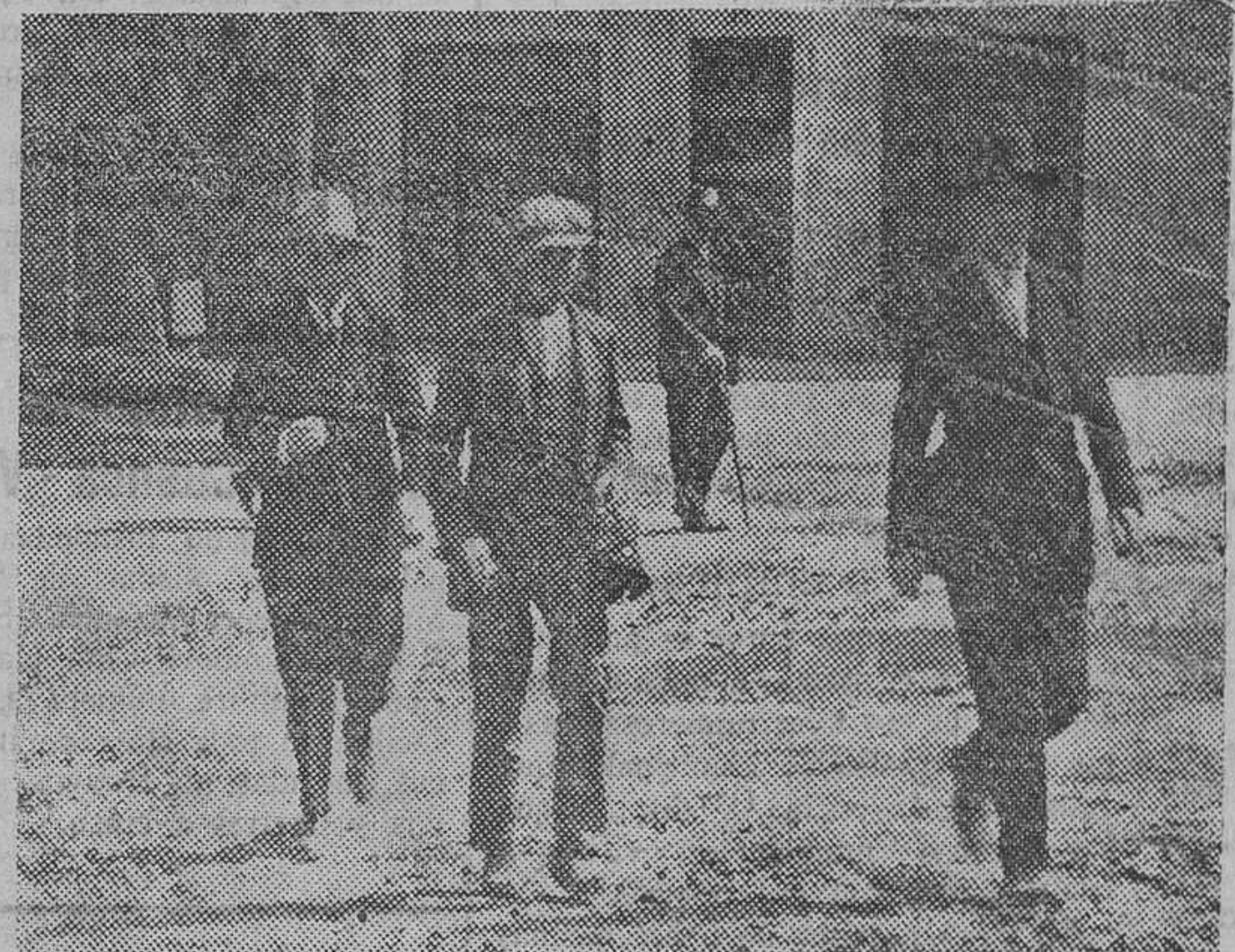
El «Vato» saliendo esta tarde, a las dos, de la diligencia evacuada en la casa del crimen

de alma fervorosa, rebotante de ideal y que, como a un arpa el viento, el mejor roce de la realidad la hace vibrar con las más variadas sensaciones.