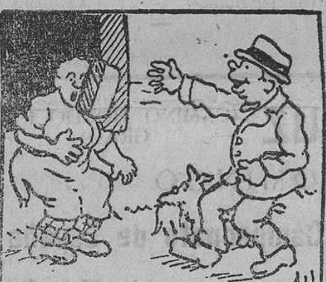
14. Sorprendido el carnicero, volviéndose rápidamente a ver quién pretendía un trozo que no estaba a la venta, pero al volverse, recibió en pleno rostro el "culudazo"