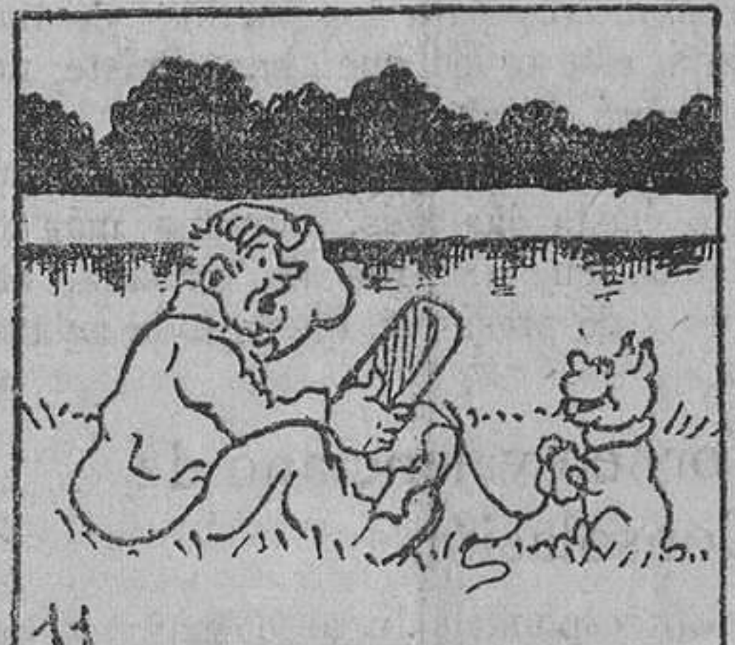
11. Juzgado, pues, del asombro del pescador y del "pescado", cuando se hallaron frente a frente, si consideráis que aquél era nada menos que el señor Manuel,

ción, cambiando el papel secante hasta la desaparición de la mancha. Manchas de los dedos.—Se quitan con dificultad. El mejor procedimiento consiste en pasar suavemente por la mancha un cepillo con jabón. Luego se lava con agua clara y se seca en tres o dos hojas de papel secante.