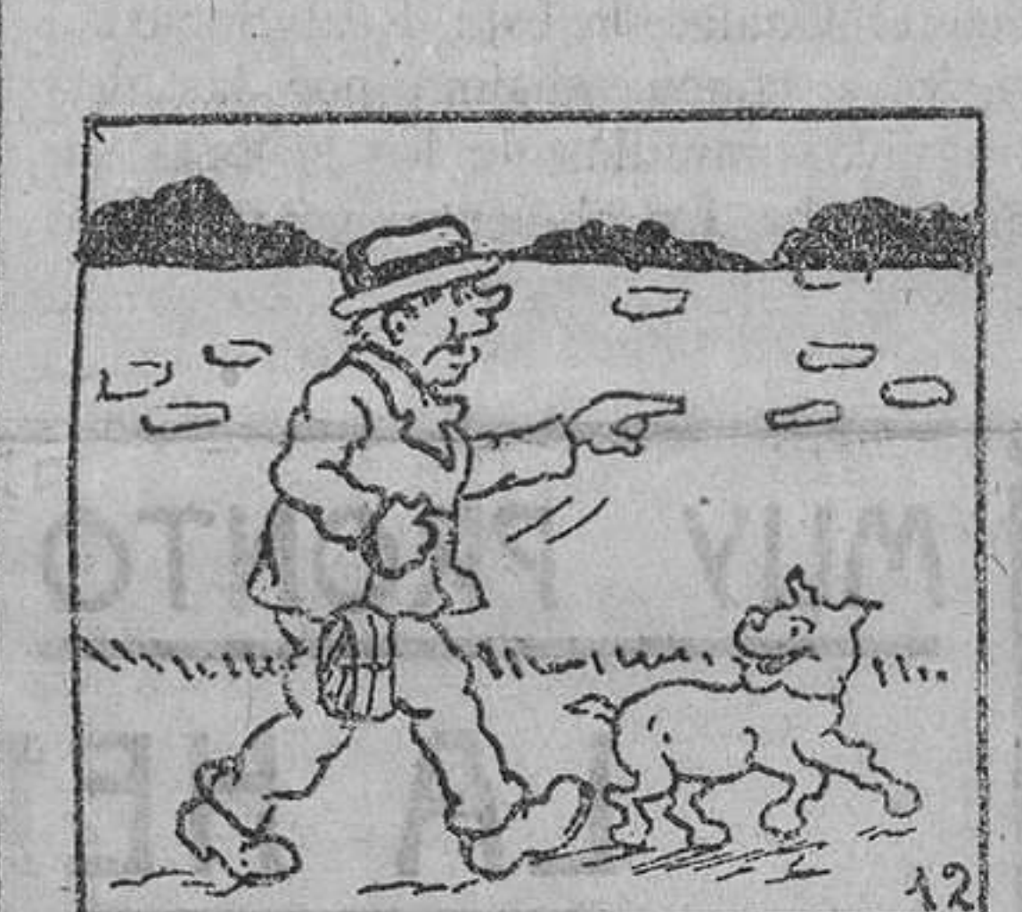
12. el propietario de "Sultán", que no necesitó cavilar mucho rato para comprender que se trataba de un intento de ferricidio. —¿Dime, quién ha sido?

Manchas de sangre.—Con agua jabonosa fría y se seca al sol.