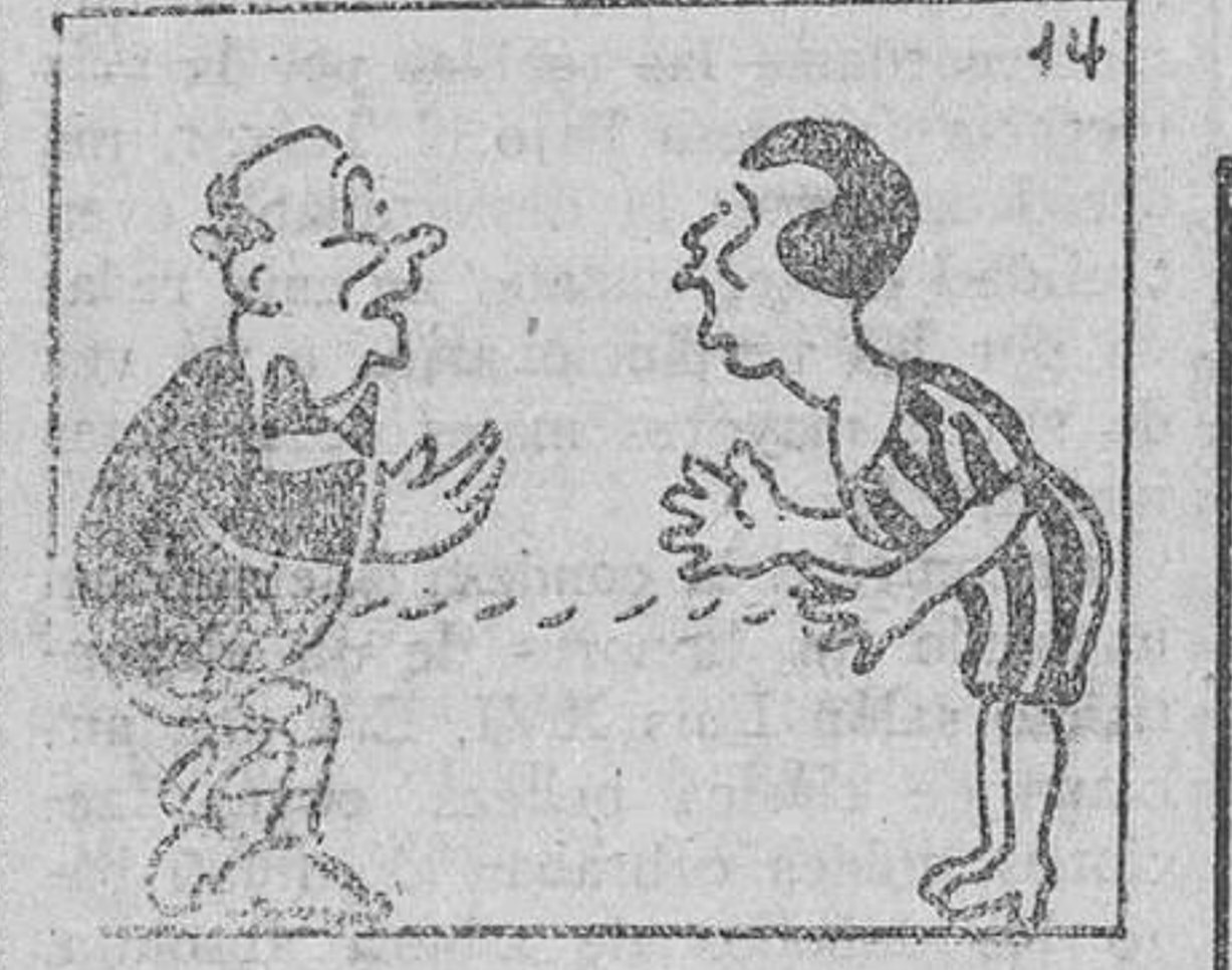
14. que no convenció tampoco, ni a papá ni a mamá.

(Ver LA CORRESPONDENCIA del 7 y 14 de Enero.)