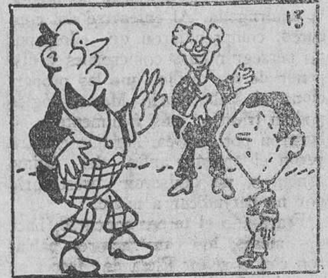
13. De la segunda prueba, Juanito salió con otra nueva cabeza.

Sellos y estatuas revelan también la existencia de un culto totémico en relación en parte con el Egipto predinástico.