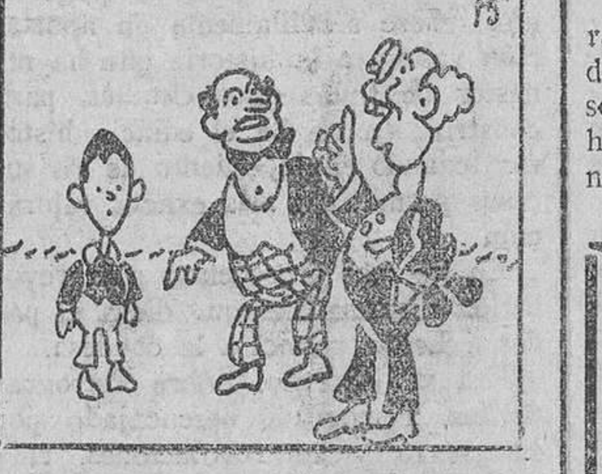
15. Siempre fiel a sí mismo, el doctor, tras de cada mutación, aseguraba que en la próxima...