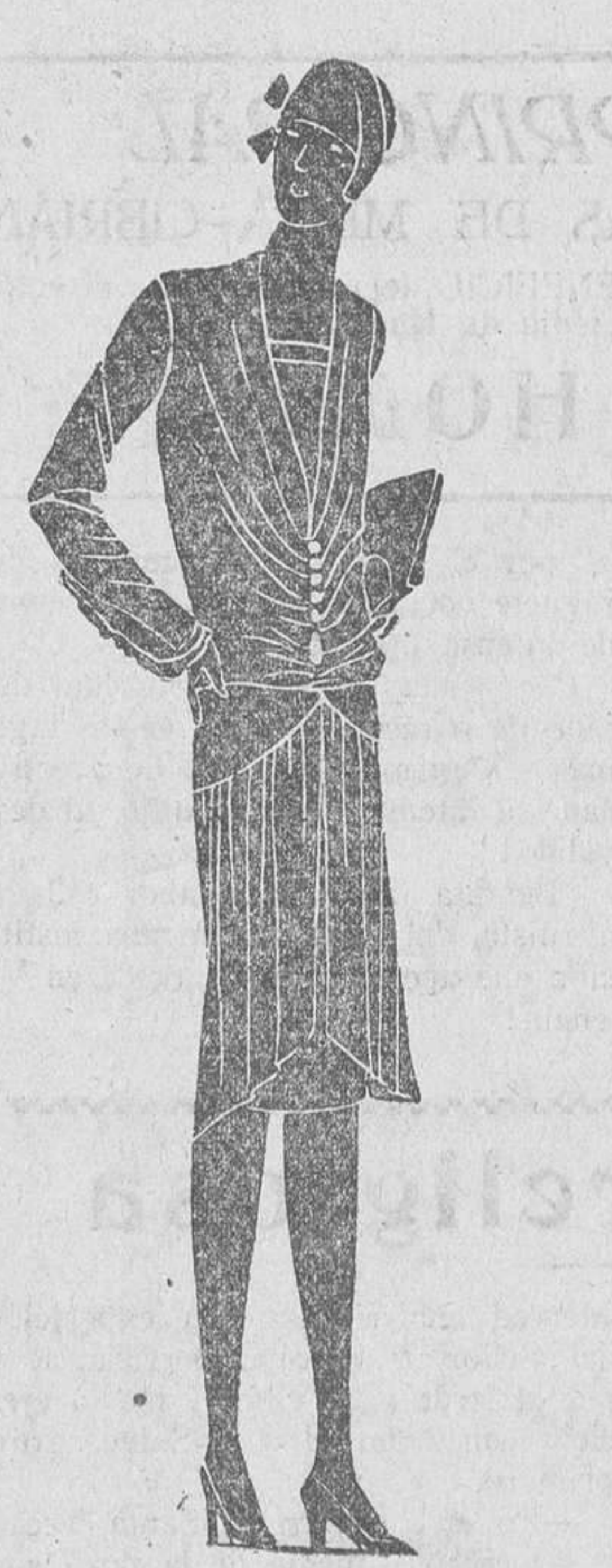
Traje en terciopelo verde, adornado de blanda amarilla en las mangas. Cauchones fantasía para cerrar la chaqueta. (Modelo de Drecol).