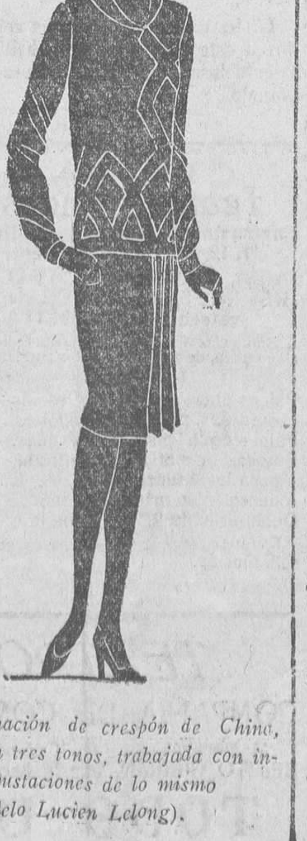
Combinación de crepón de China, azul, en tres tonos, trabajada con incrustaciones de lo mismo (Modelo Lucien Lejong).