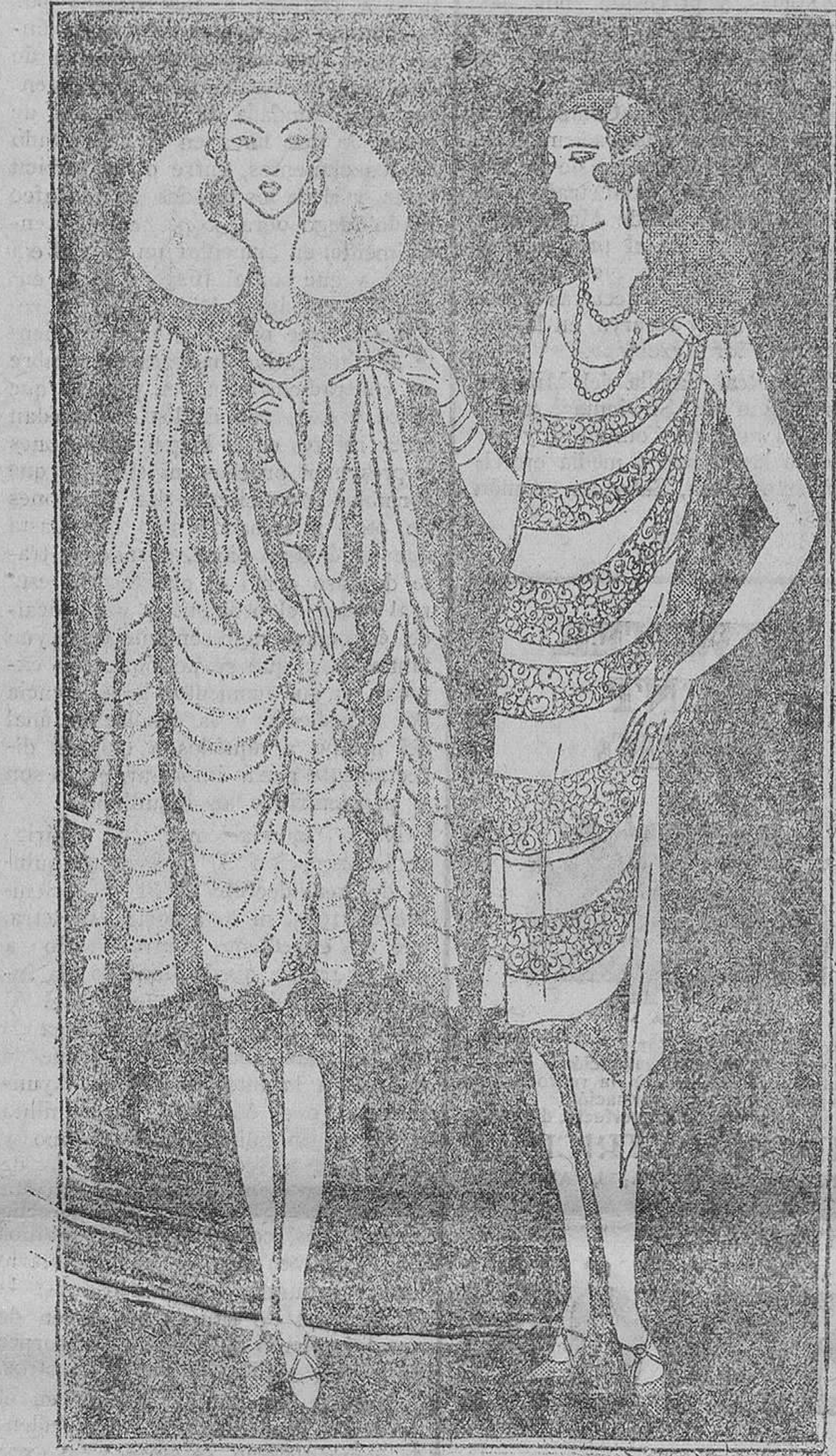
Caja de luna rosa, adornado de nevaduras, lograda con una graciosa ondulación. Cuello de mongolia, desrizada al tono.—Traje de soirée en crepón Georgette gris platin, incrustado de blonda dorada. Al hombro, una gruesa flor de fantasía

Las espumillas de colores y el gorgette dan la nota suntuosa tan a la moda, pero no faltan los prácticos modelos clásicos en linón y batista con bordados o cañados marcos lisos