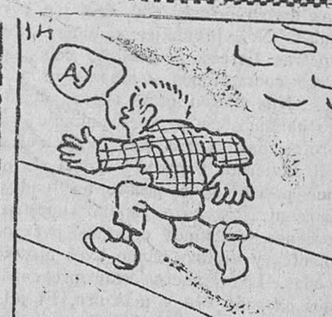
14. y calle arriba, condoliéndose, marchó Ricardín.