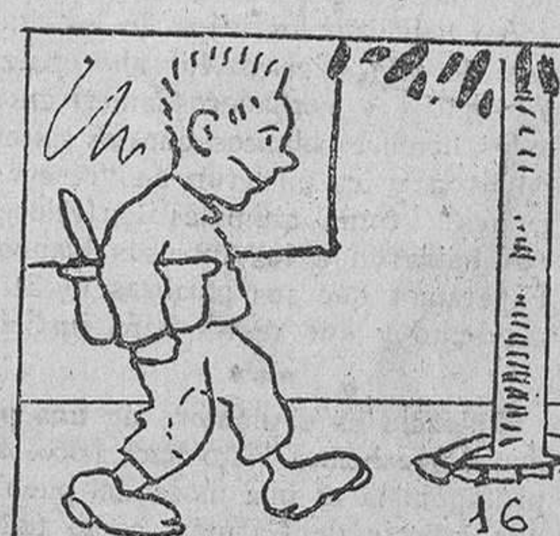
16. desde entonces Ricardito va volando a donde le mandan.