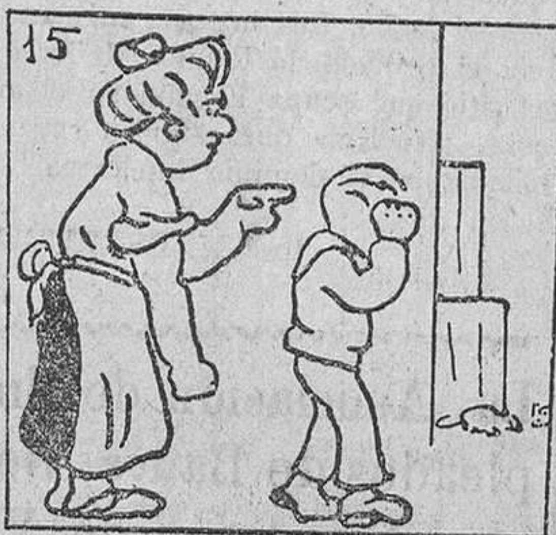
15. Su madre, en lugar de acompañarle, le castigó por la tardanza, y...