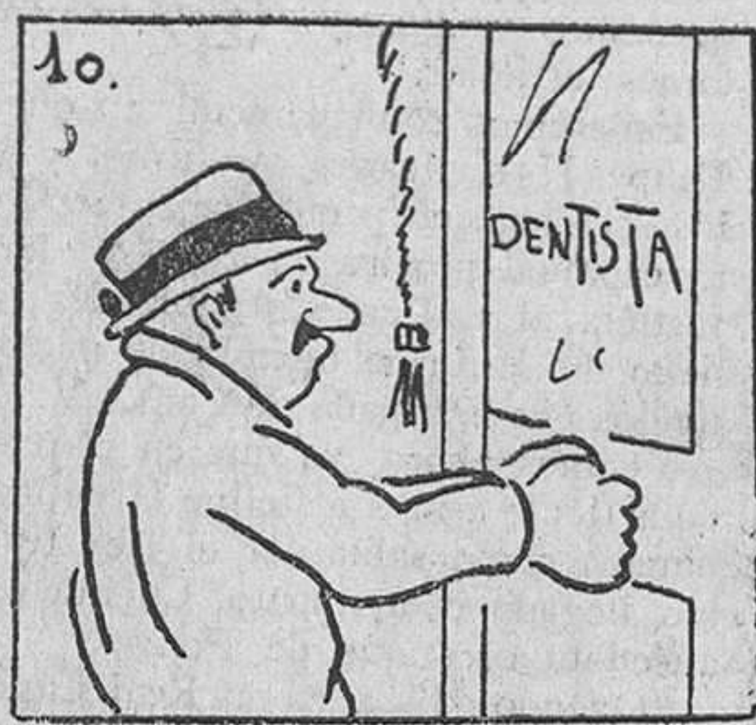
10. cerrando rápidamente para evitar la fuga.