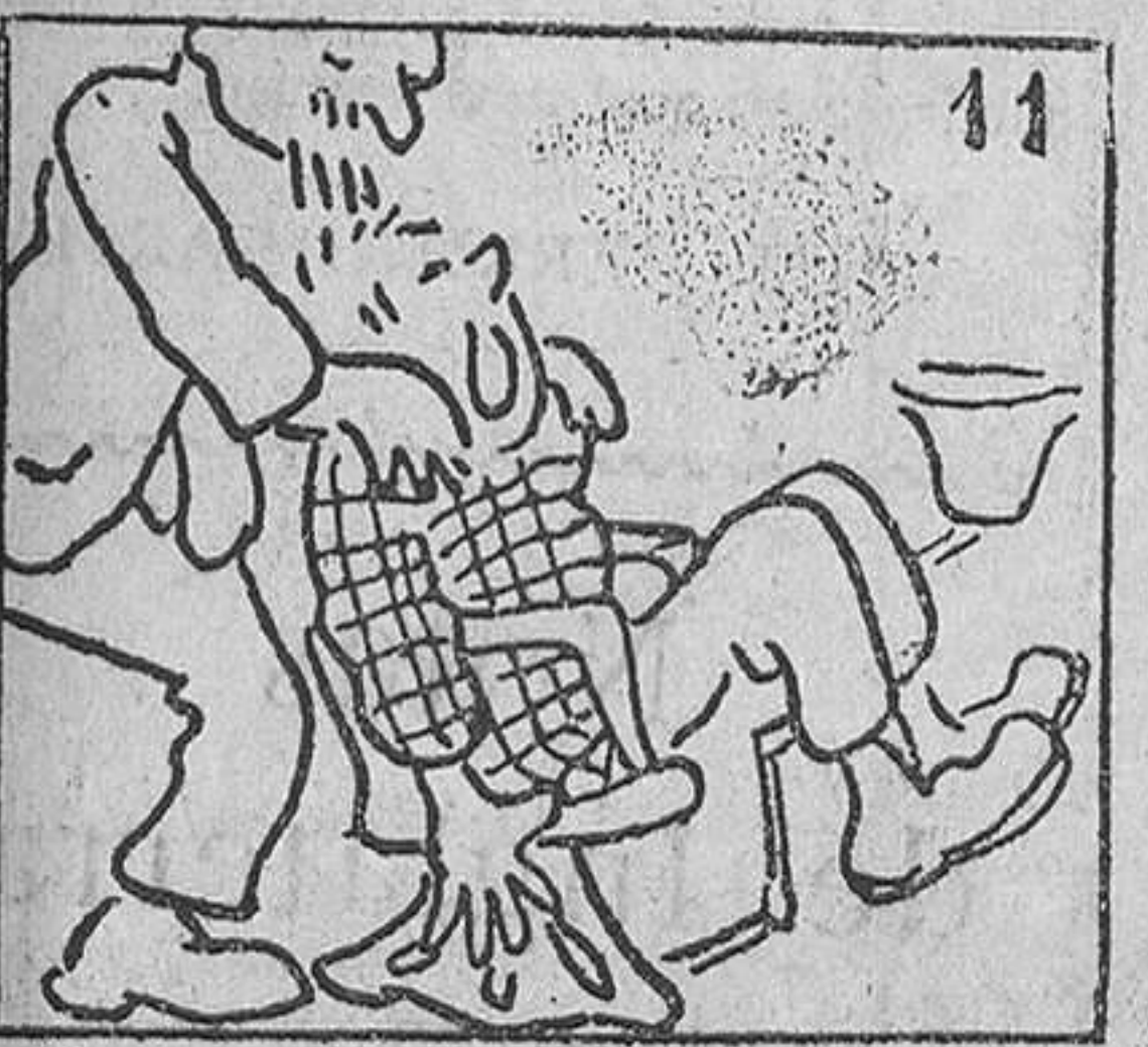
11. Y el sacamuelas sentó al chico en el trágico sillón de gutapercha.