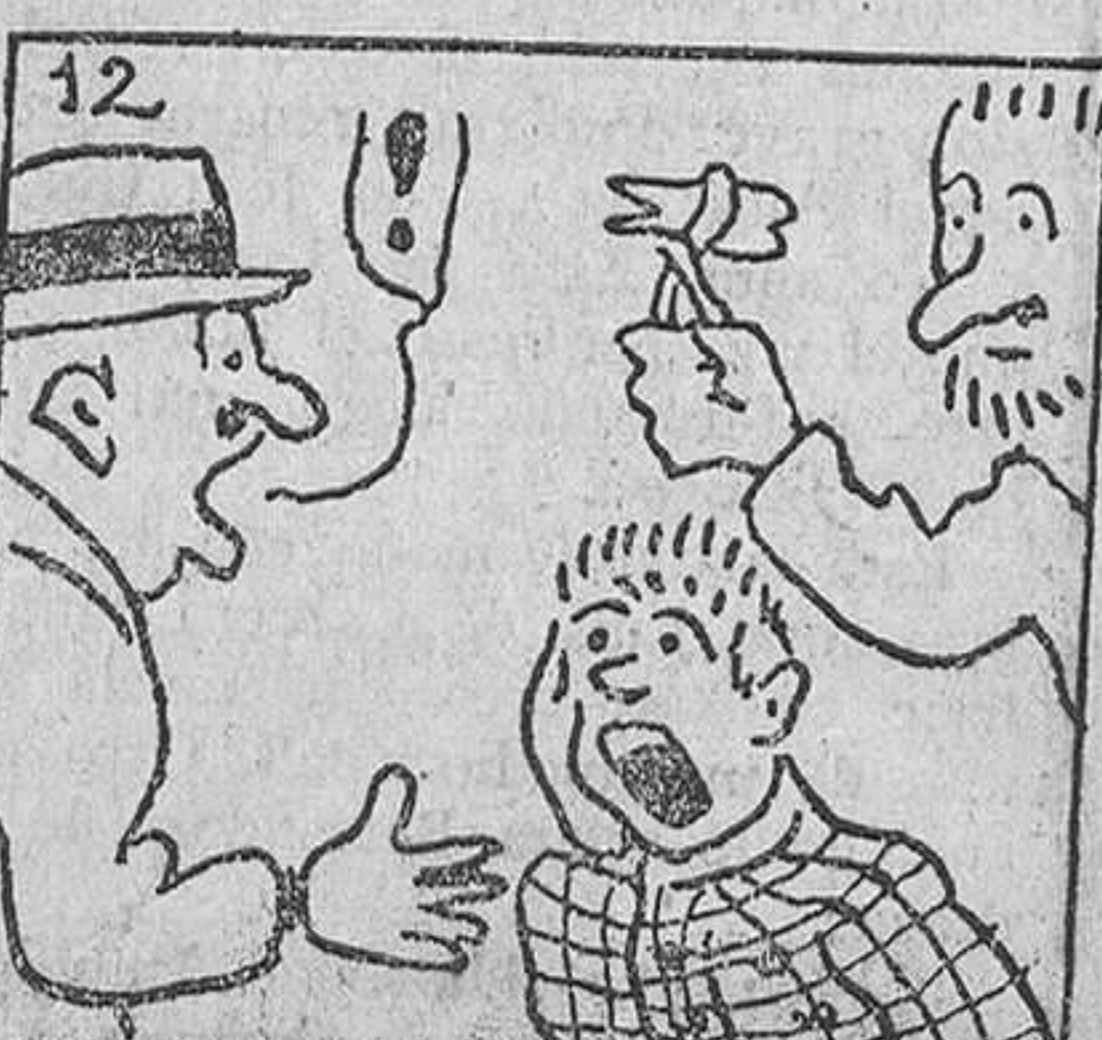
12. de donde se levantó Ricardo con una muela menos.