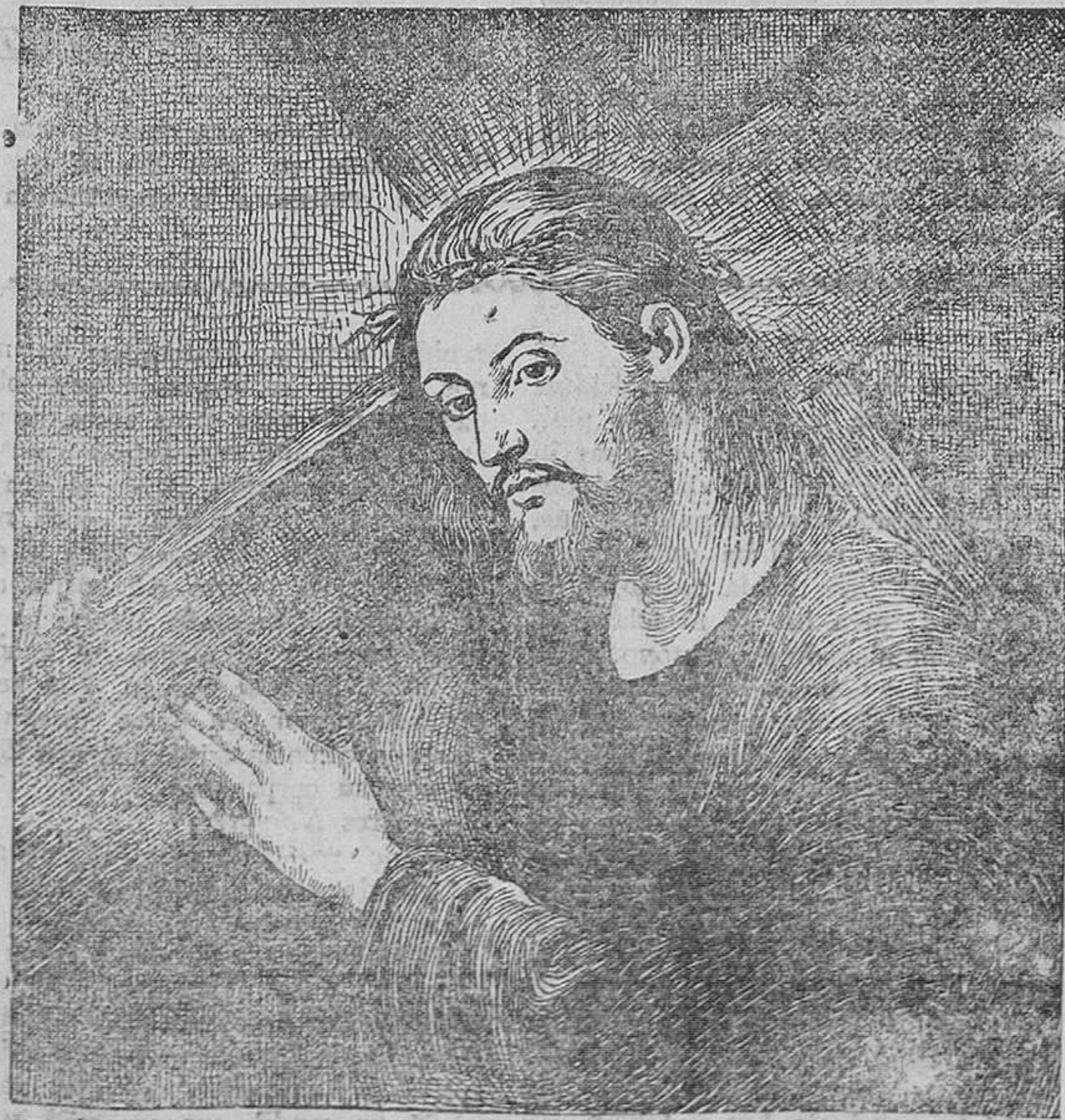
JESÚS CON LA CRUZ (lienzo de Tiziano, que se conserva en el Prado)

Tiene el atardecer del Jueves Santo la íntima sugestión de los contrastes que en el vasto panorama del culto católico es constante embeleso. La blanca aparición del Sacramento entre resplandores de luz vibrante, el Pange lingua de la Institución Eucarística, el aniversario recuerdo de aquel alborar de triunfo, cuando Cristo, en efusión amorosa, se ofrecía para alegría del mundo entristecido, luz que inundaba de resplandores la lóbrega mansión del pecado, alegría, himnos de triunfo... Y de otra parte la triste, la tréfica aparición del monte Gólgota, el abatimiento de una