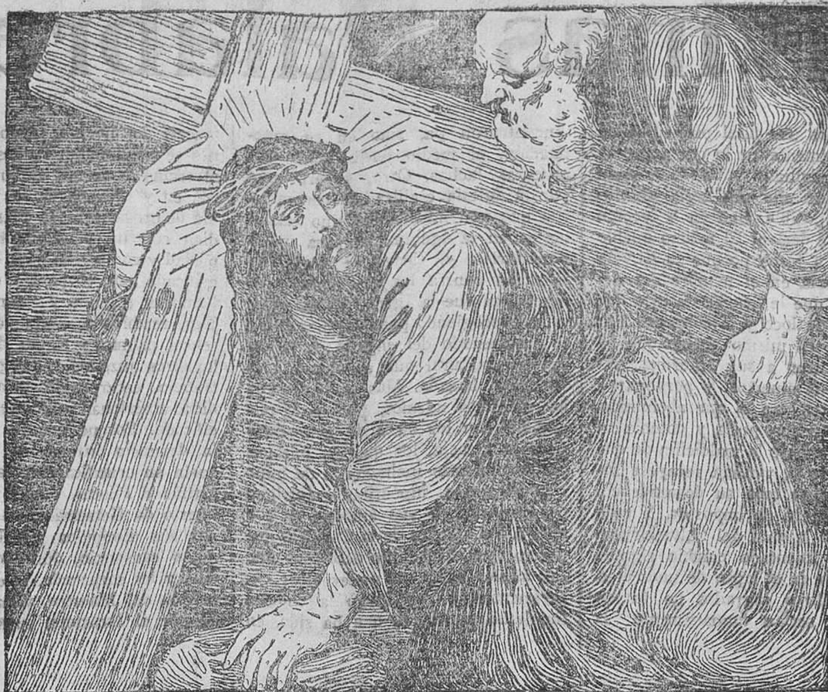
LA TERCERA CAÍDA (cuadro del Tiziano, del Museo del Prado)

Según nos cuenta una piadosa peregrina de las Galias del siglo IV, la adoración de la Cruz tuvo su origen en Jerusalén. A las ocho de la mañana se reúnen el Obispo, el clero y el pueblo en la iglesia construida por Santa