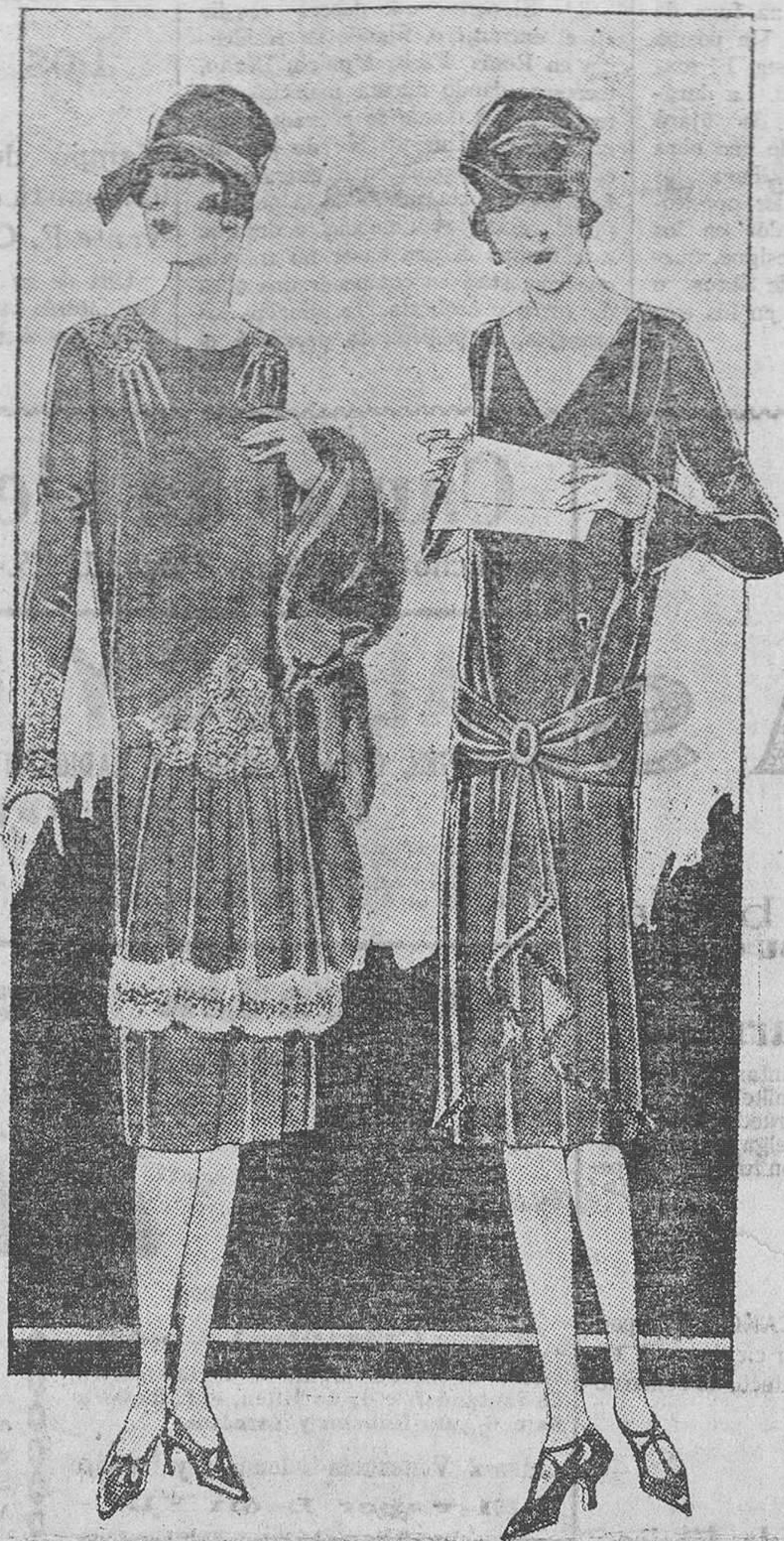
Traje en reps con bordados. Echarpe de tisú. Túnica en forma de tabla, adornada de gibelina...