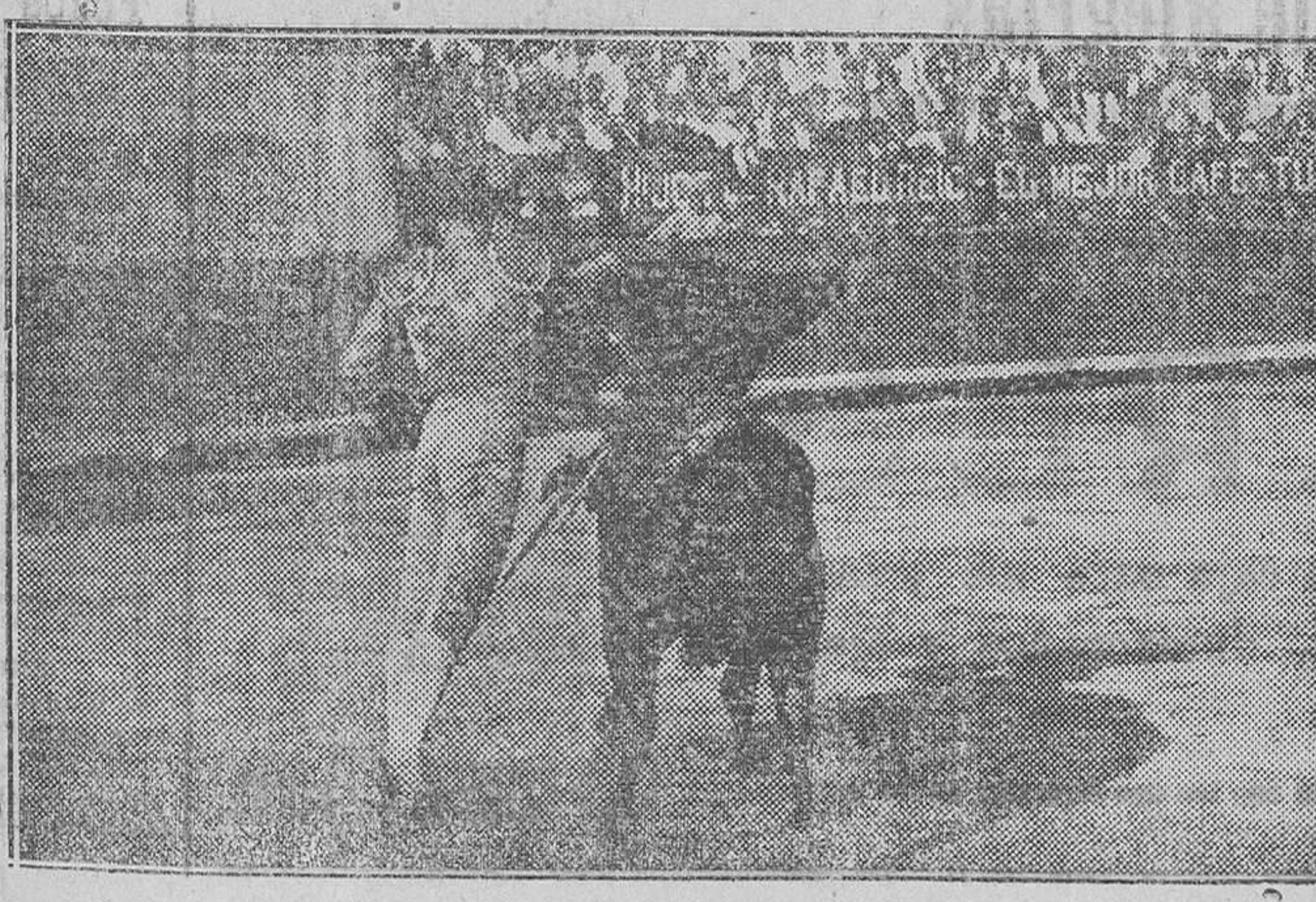
Uno de sus primorosos pases de muleta