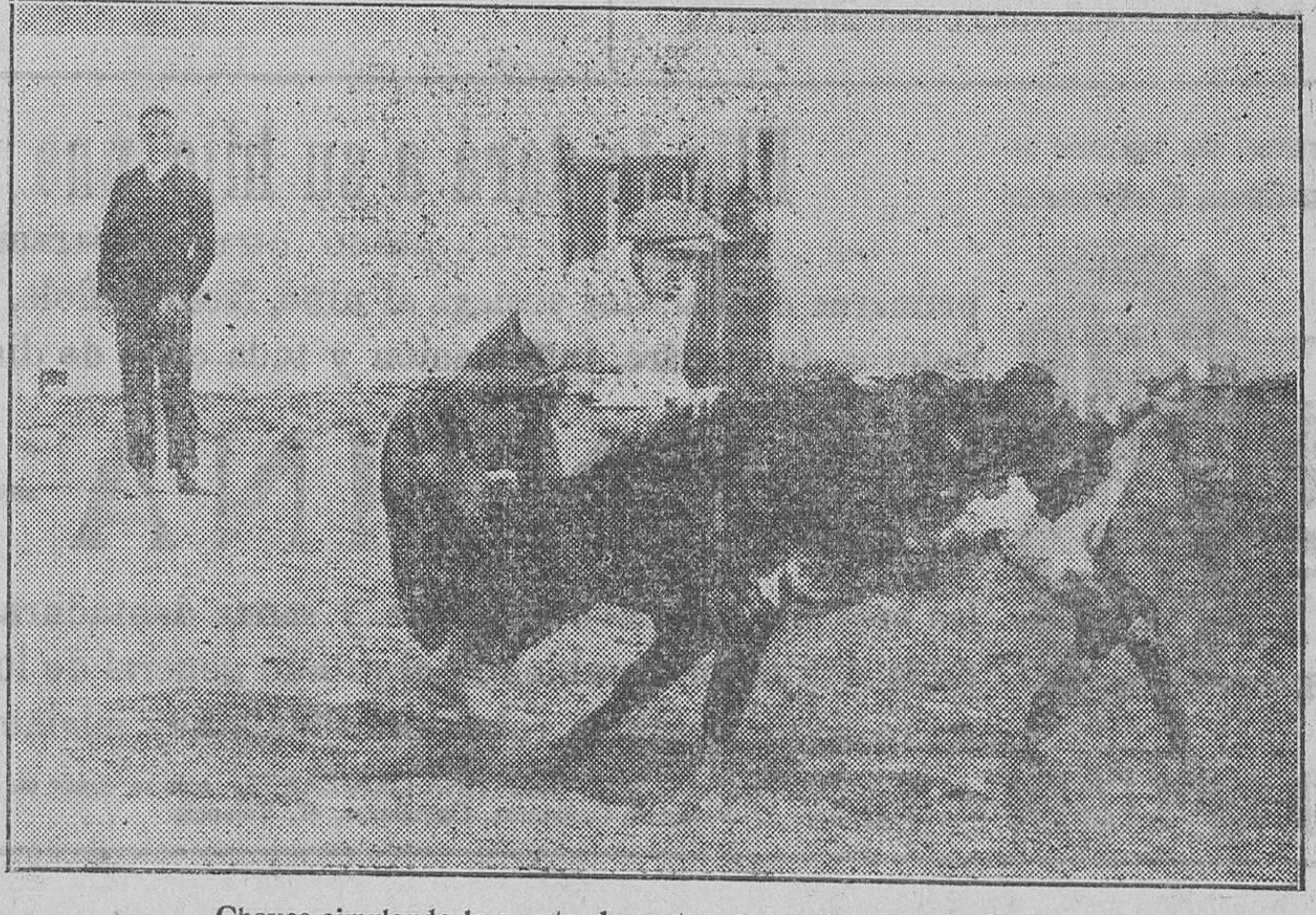
Chaves simulando la suerte de matar, con un becerro de Gallardo