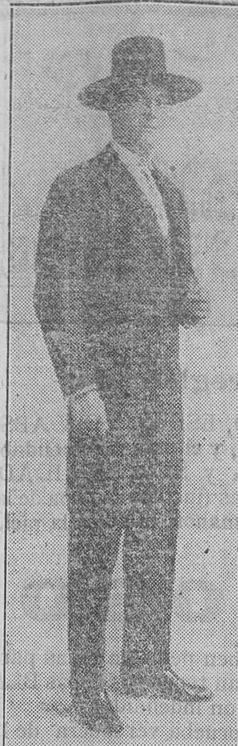
El diestro del Grao, que el sábado tomará la alternativa en la plaza de Valencia.