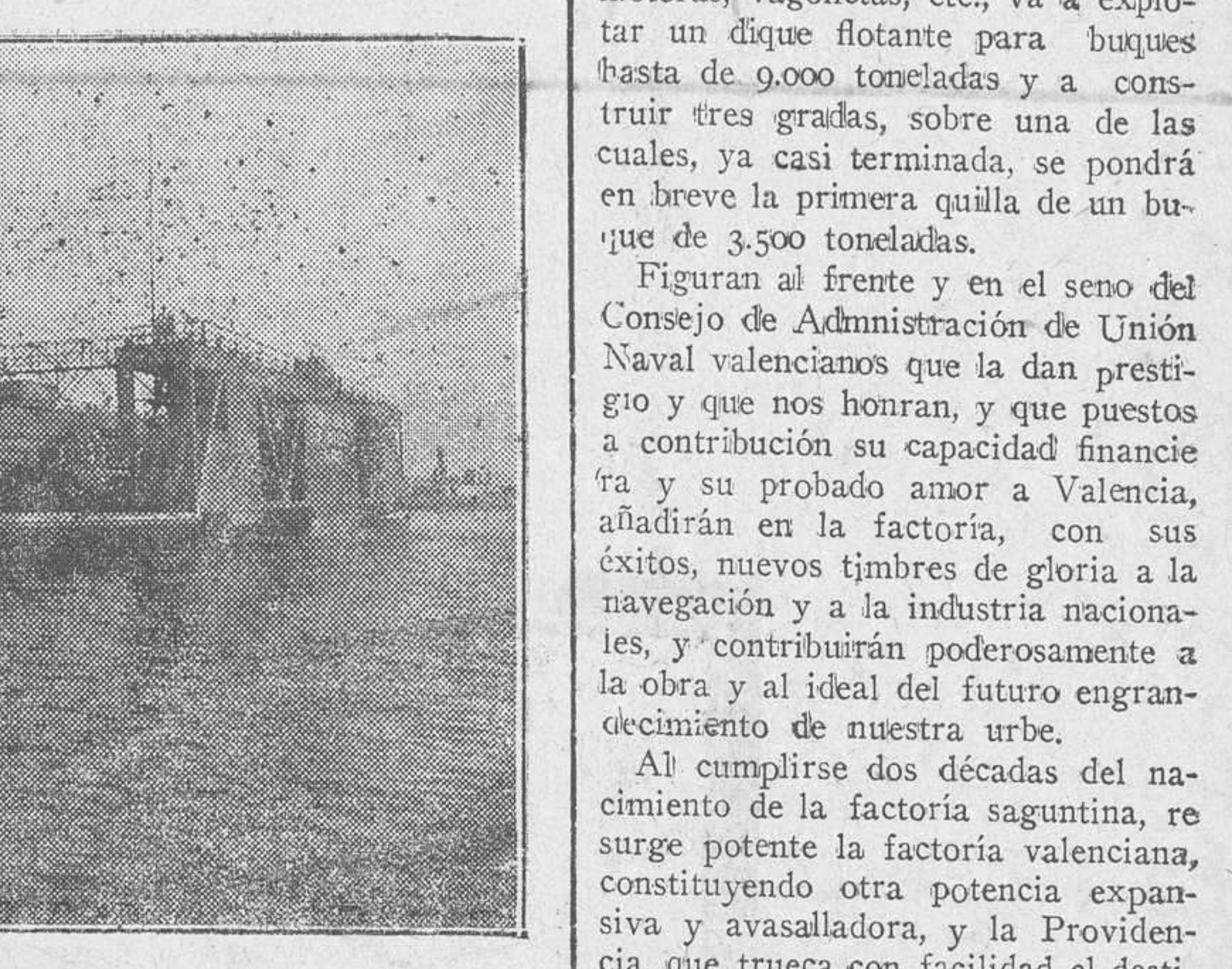
ra a escribir páginas gigantes en lo porvenir. Antes de medio siglo se unirán ambas, y no es el adecuado nervio que las aproxime, la polvorienta e irregular carretera actual, donde sufre quebrantos el comercio, daño la agricultura y se despeñan los transeúntes. Homenaje de gratitud Valencia con su región, ante ese inmenso taller, ante ese coloso de la producción, que aspira a volcar en los mercados mundiales especializados e incontables productos, debe rendir perenne y sentida gratitud a Sierra Menera y a Siderúrgica del Mediterráneo y a sus hombres, gloria y honor de España, y en especial de la raza vasca, la que ha venido a derramar a manos llenas sobre nuestra costa el impulso de su poderío industrial, sus grandes iniciativas y medios económicos y su patriotismo indiscutible. Factoría de la Unión Naval de Levante La Sociedad anónima española que con el título Unión Naval de Levante y con un capital de treinta millones de pesetas, tiene vida legal desde 11 de abril de 1924, ha reunido y va