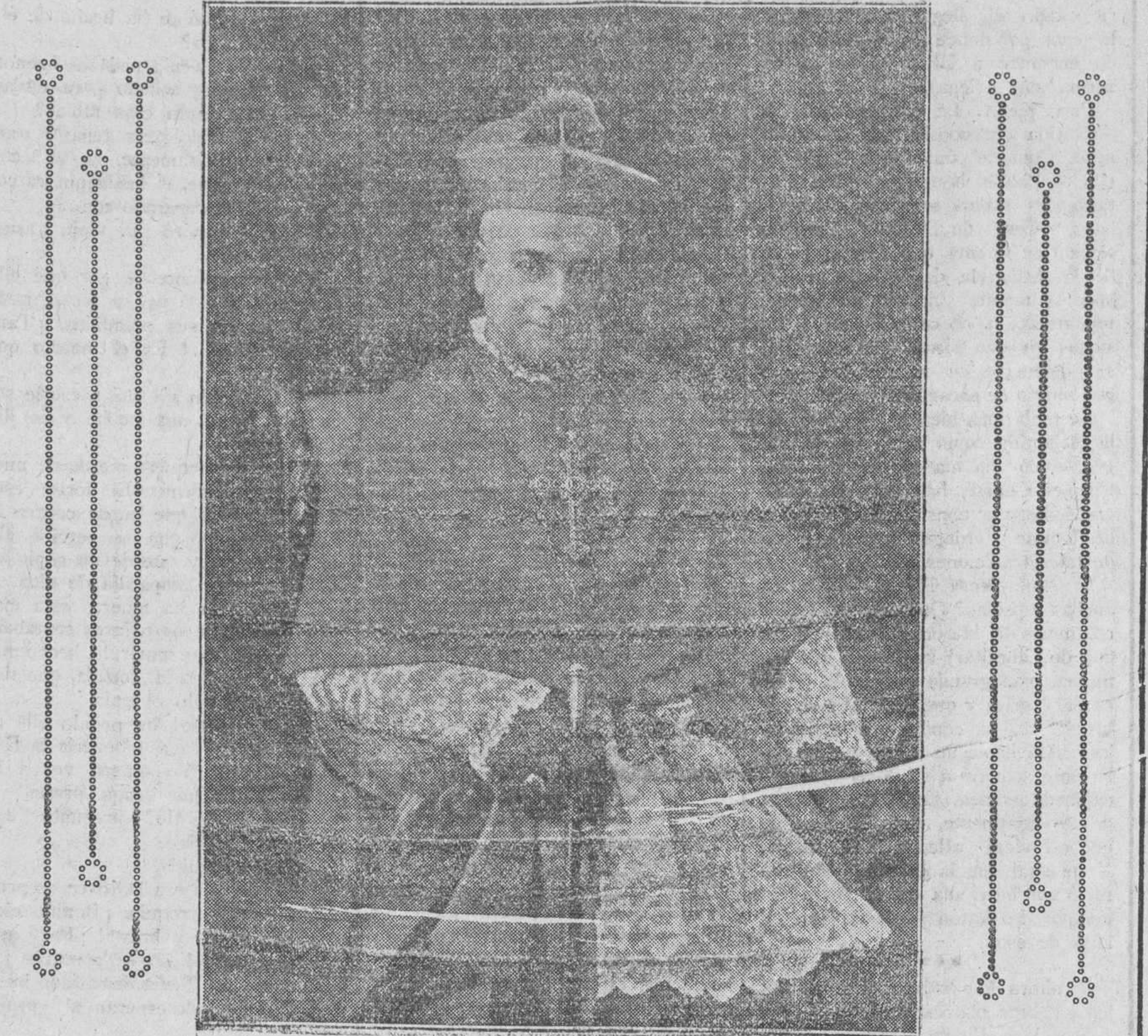
El Obispo de Zarái