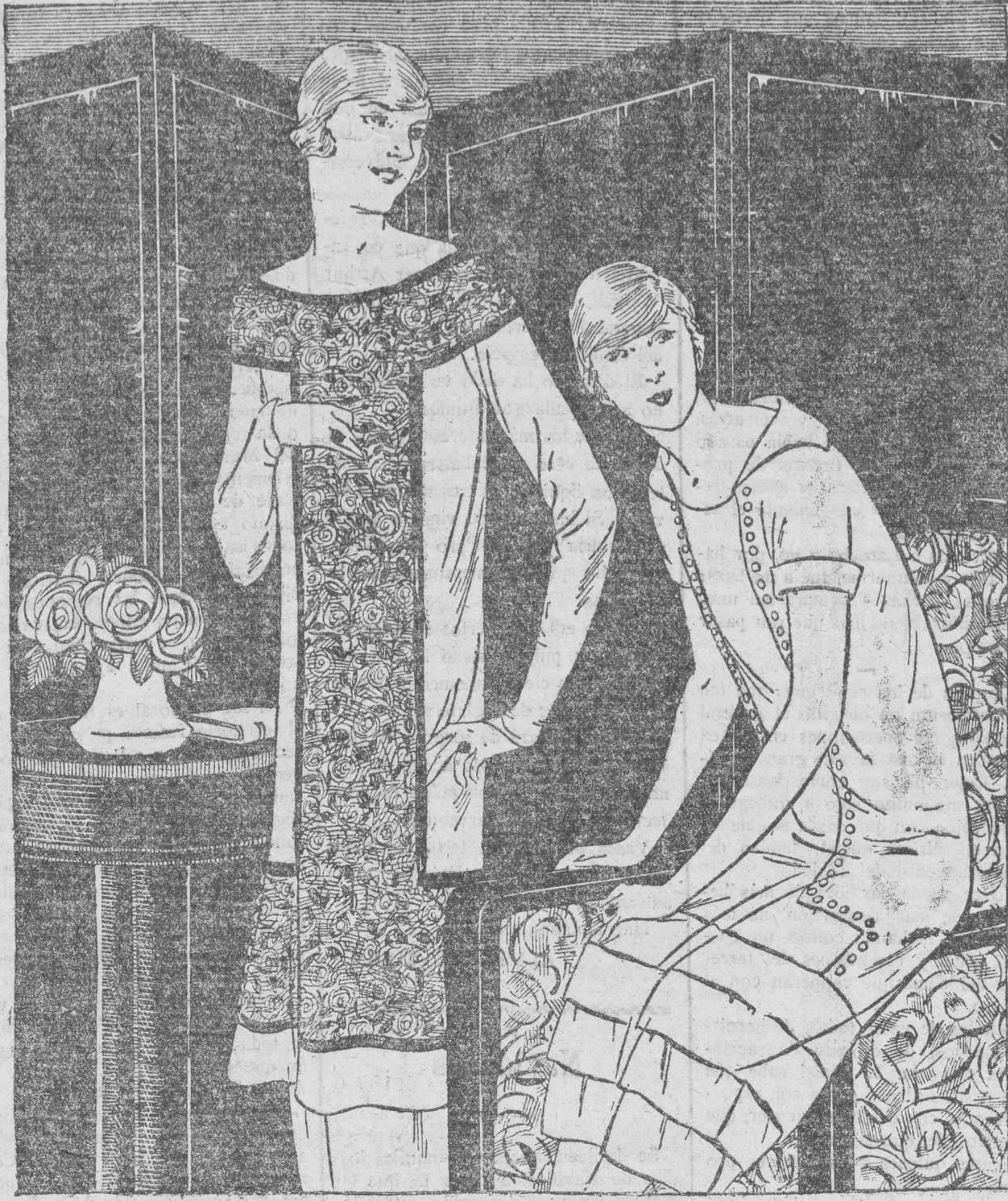
Traje color marfil. Encajes color cobre.—Traje color malva

SALSA DE TOMATE PARA MUCHOS USOS Esta salsa me la enseñó a hacer una cocinera vascongada que dicen que sabía bien su oficio. Se ponen unos tomates más o menos, según para la cantidad de salsa que se va a hacer, en agua que esté al fuego hirviendo, se tienen en ella dos o tres minutos; se sacan y se ponen en agua fría, y se pelan bien, quitándole si la tienen, alguna dureza en el centro. Se frien en manteca o en aceite, según sea carne o pescado, o lo que va a guisar. Al principio de la temporada de ellos, cuando aún no están muy agrios los tomates, no la necesitan, pero luego se pone para mitigar la acidez, bien cebolla frita, o si no azúcar. Esta es la que suelen usar los cocineros casi siempre con el tomate; yo encuentro que los varia el sabor y prefiero la cebolla no siendo mucha. Cuando el tomate ha consumido su jugo y sale la grasa a la vista, se le añade una cucharada pequeña de harina por cada medio kilo, y