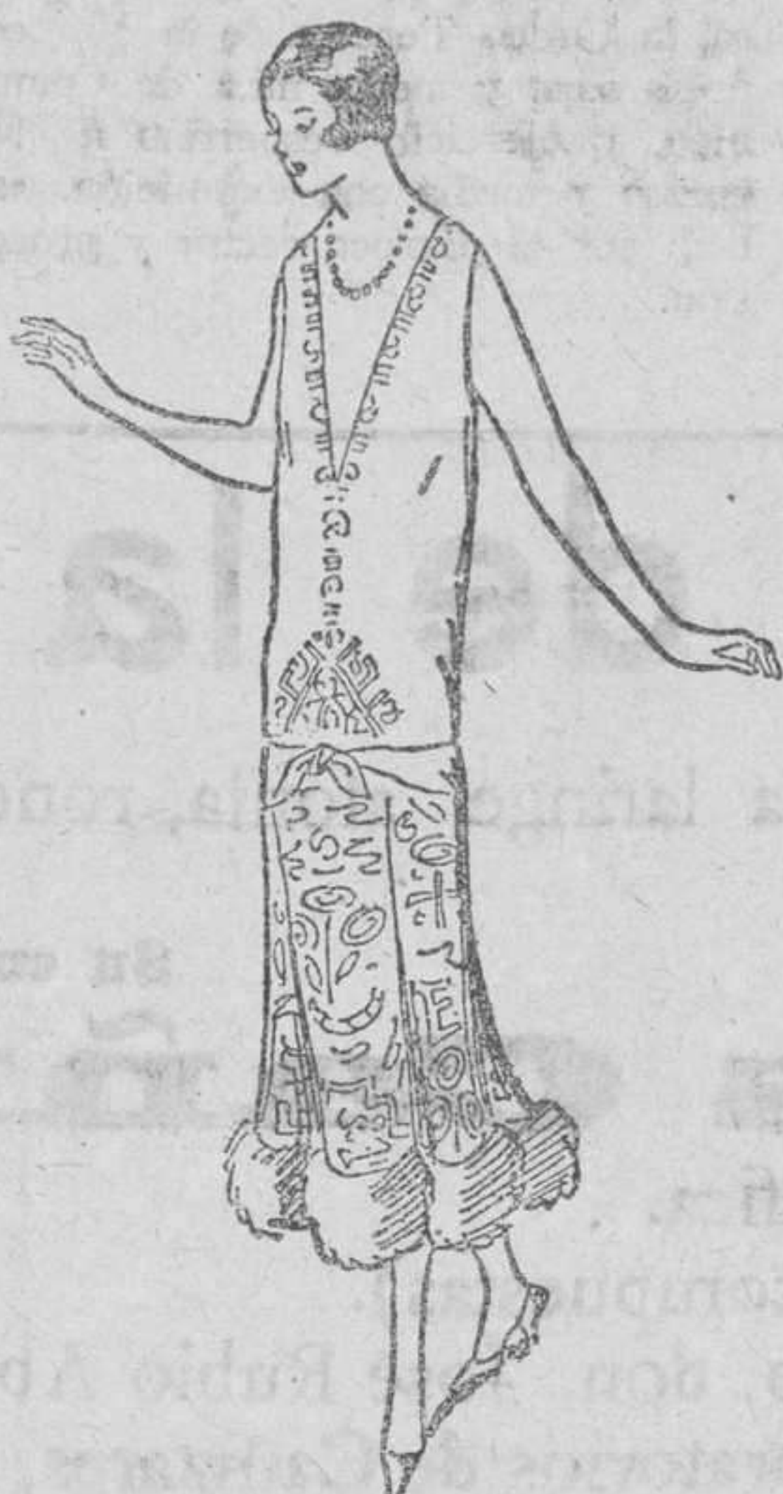
Traje de terciopelo blanco, recamado, con el borde de piel. Traje para comida

para los trajes de noche, aunque de día también se ven bastantes. Se hace notar que en los trajes de noche se suprime el talle, y solo se advierte por los movimientos flexibles del cuerpo, y se han visto otros modelos que colocan el talle en las caderas o en su sitio natural, acentuado con unos bordados como en tiempos del Directorio y del Imperio.