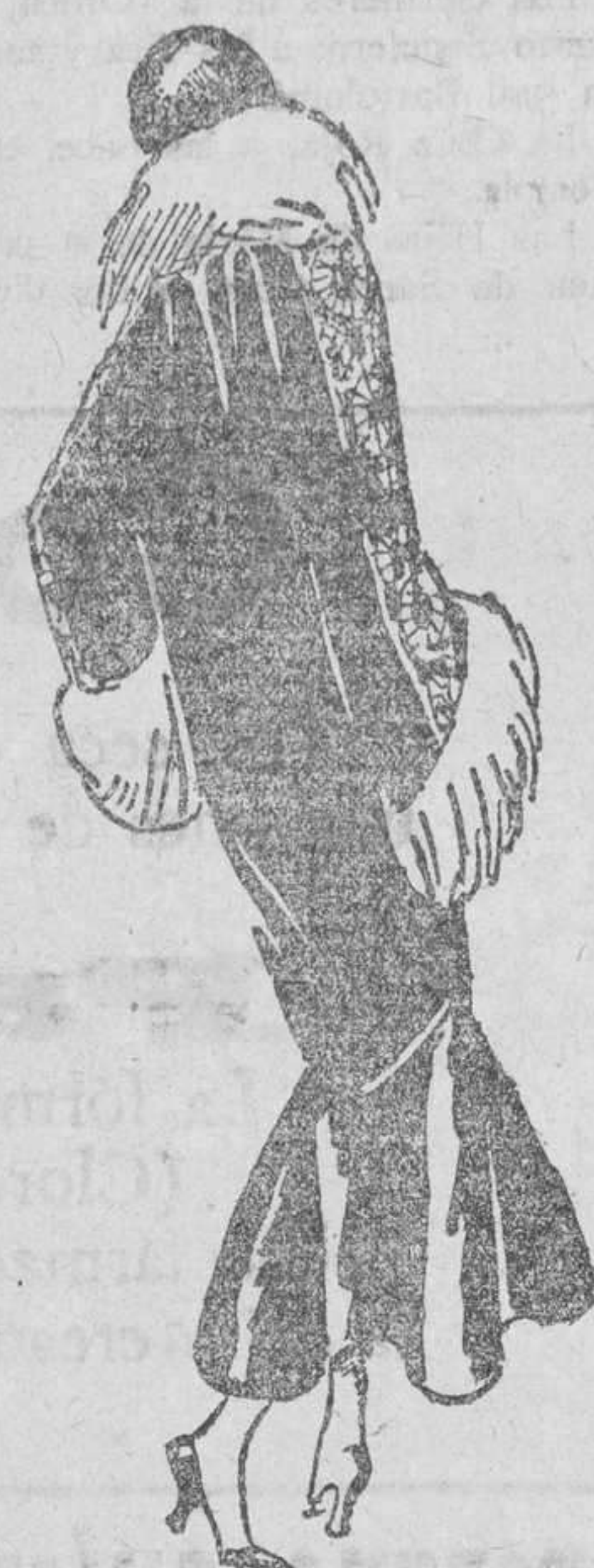
Abrigo de satén negro con bordados japoneses, tan en boga en los grandes centros de la moda. Propio para la tarde

Constantinopla.—Desde hace algunas semanas se nota un éxodo general de los habitantes de Constantinopla hacia Angora. Más de 200 harenes han quedado desiertos. La Policía ha realizado una información y ha declarado que cree que las mujeres pertenecientes a los harenes han sido seducidas por la propaganda comunista, convirtiéndose en auxiliares del Gobierno de los Soviets.