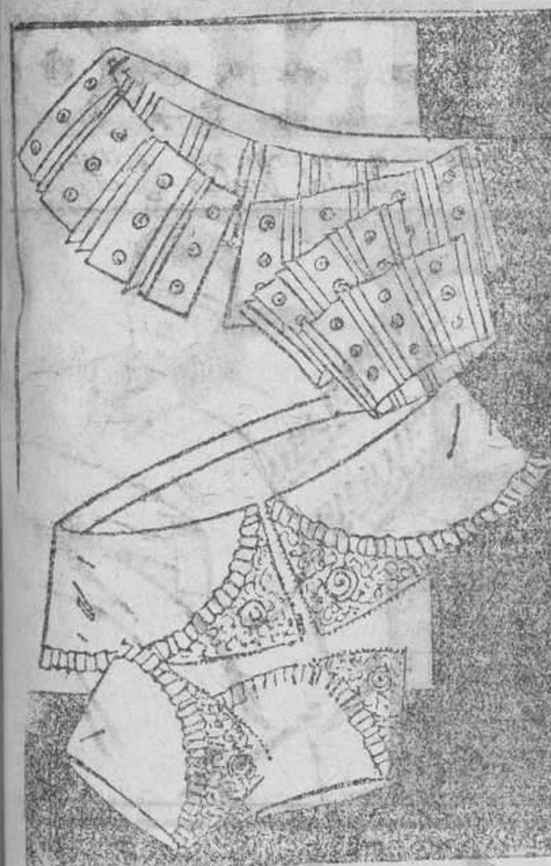
Cuellos y paños de lencería en beutila y encaje

Las mujeres en Rusia poseen actualmente todos los derechos políticos, las hay delegadas de los Soviets, jueces, etc. Más el triunfo de esta conquista queda reducido a unas pocas; la mayoría vive agobiada por una situación miserable. La suerte de las mujeres en Rusia no tiene nada de envidiable, sobre todo para las mujeres que ejercen profesiones liberales. El pauperismo general en las ciudades, el precio elevado de los alimentos, ropas, calzado, medicamentos, etcétera, ponen a la mujer en una situación cada vez más difícil. No hay medio de conservar un presupuesto estable; los gastos sobrepasan a las ganancias; y el ahorro es imposible a causa de la depreciación de la moneda soviética; los impuestos son apastantes; las pensiones han sido suprimidas; la asistencia llamada "social" la conceden los Soviets raras veces, y exclusivamente a las personas imposibilitadas de realizar ningún trabajo. Las viudas de guerra se encuentran a menudo en la más triste miseria; las viudas de profesores, médicos, eminentes abogados, están reducidas a la más espantosa pobreza; encorvadadas por el peso de las enfermedades, privadas de la leña necesaria para calentar su misero hogar. Estas desgraciadas no reciben ningún socorro "social", pues el Estado soviético es "pobre" y "muy económico", para lo que no sea propaganda y ejercicio.