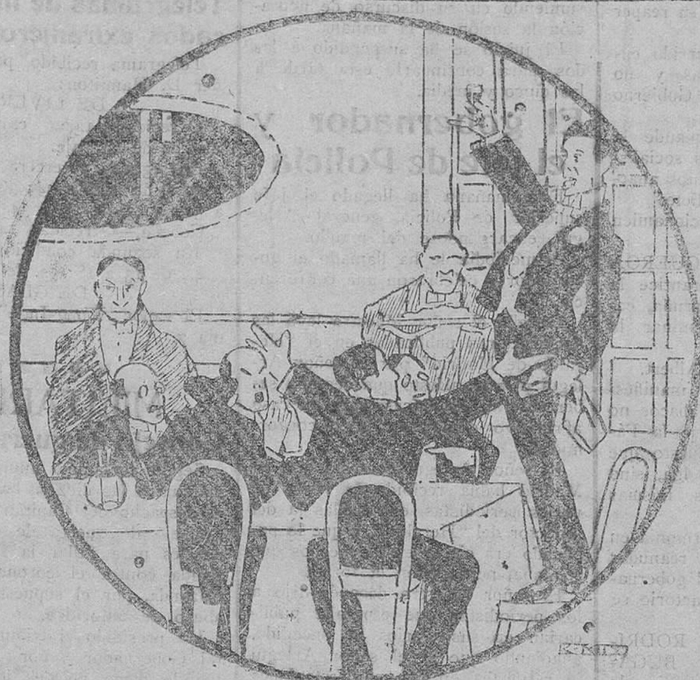
—Porque nuestro amigo triunfe en París, como ha triunfado en todo el mundo el Gran Cognac el Minero , que llena mi copa.