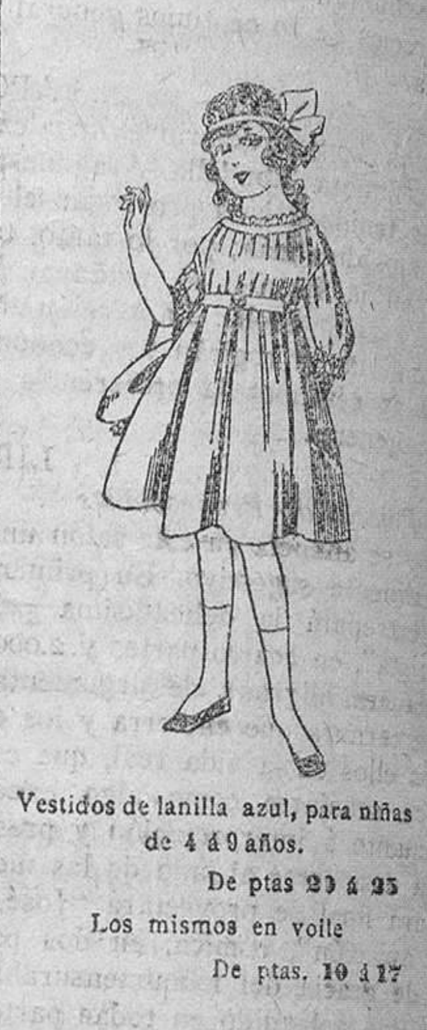
Vestidos de lanilla azul, para niñas de 4 a 9 años. De ptas. 29 a 35. Los mismos en voile. De ptas. 10 a 17