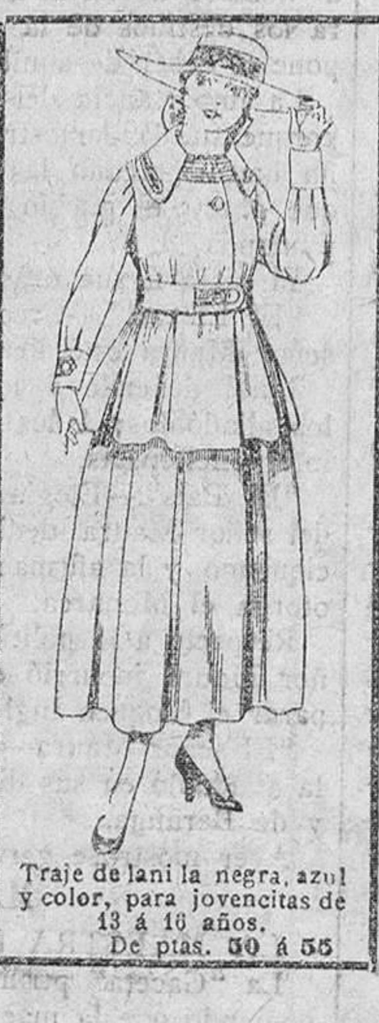
Traje de lana negra, azul y color, para jovencitas de 13 a 16 años. De ptas. 30 a 55