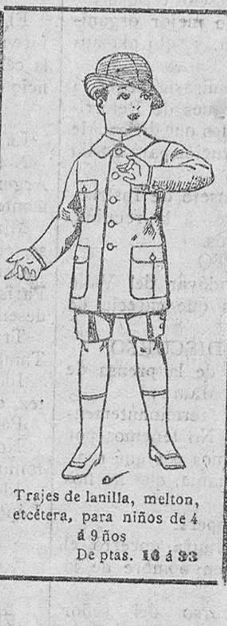
Trajes de lanilla, melton, etcétera, para niños de 4 a 9 años. De ptas. 10 a 33