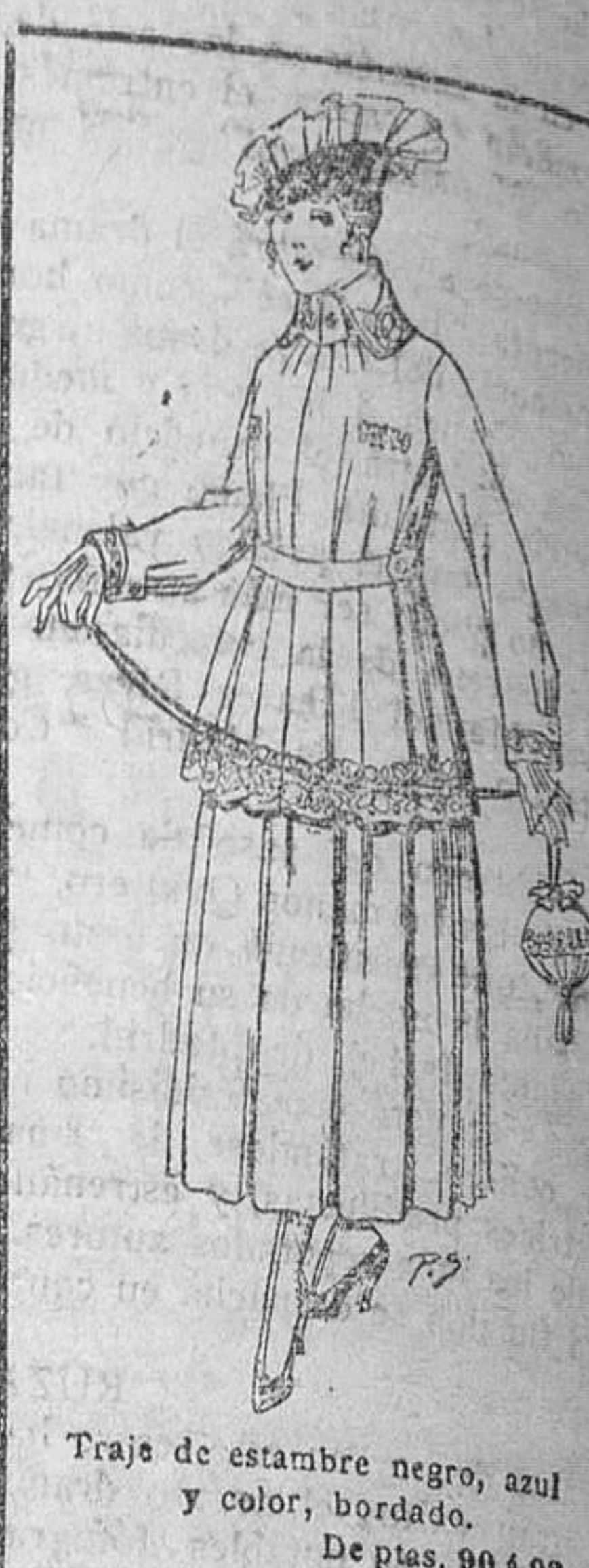
Traje de estambre negro, azul y color, bordado. De ptas. 90 a 99