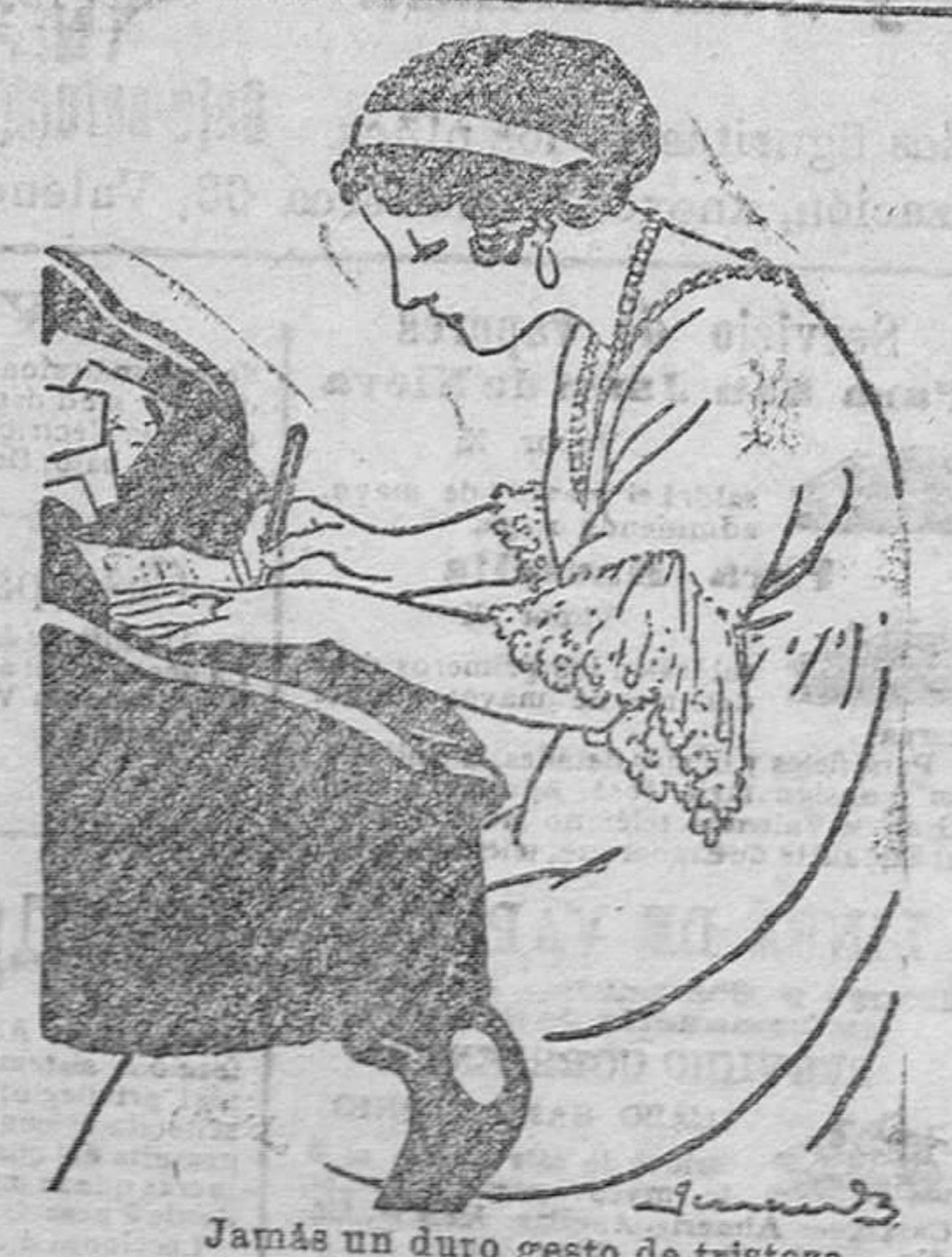
Jamás un duro gesto de tristeza oscurécia, de tu frente, la tersura; jamás se borrará tu ideal belleza si persistes usando PECA. CUBA

Jabón, 1'25.—Crema, 1'75.—Polvos, 2.—Agua cutánea, 5 ptas. Creación de Cortés Hermanos, Barcelona