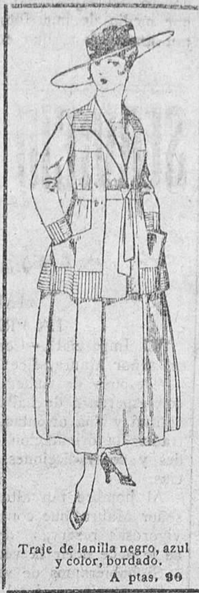
Traje de lanilla negro, azul y color, bordado. A ptas. 90