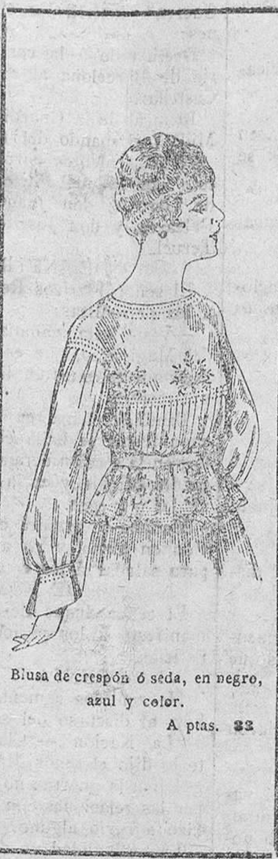
Blusa de crepón ó seda, en negro, azul y color. A ptas. 32