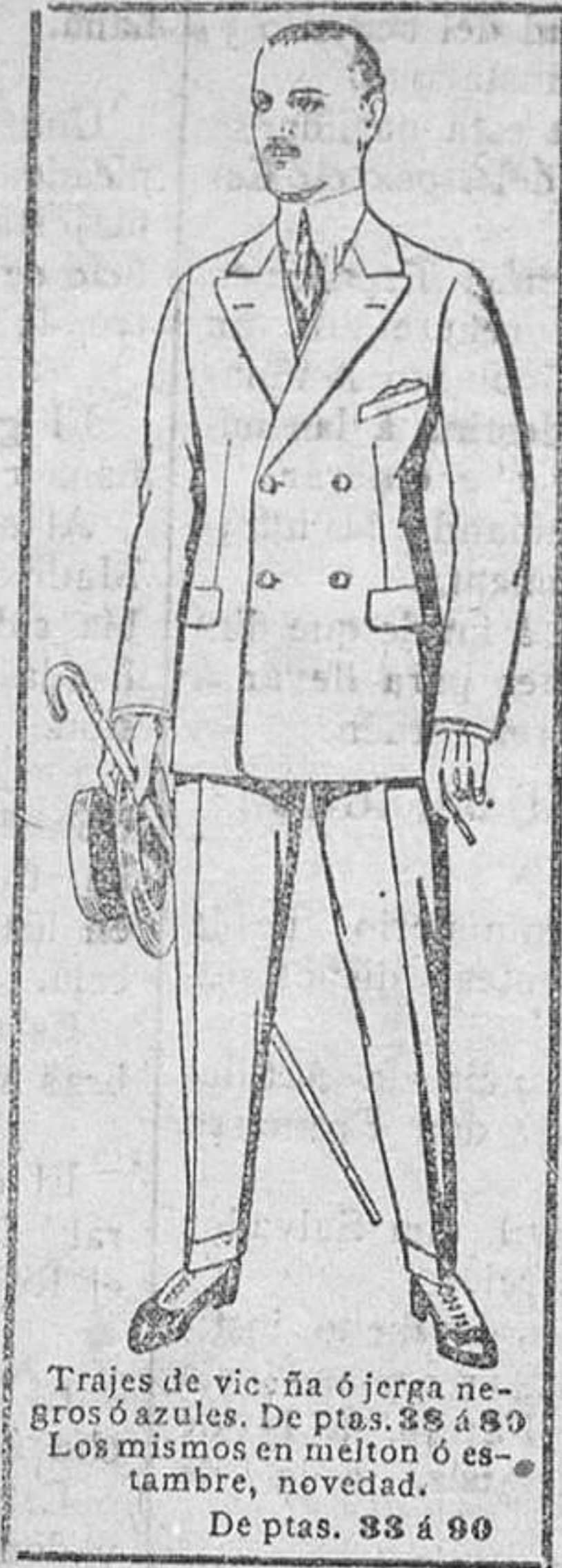
Trajes de vicuña ó jerpa negro ó azules. De ptas. 35 a 50. Los mismos en melton ó estambre, novedad. De ptas. 33 a 50