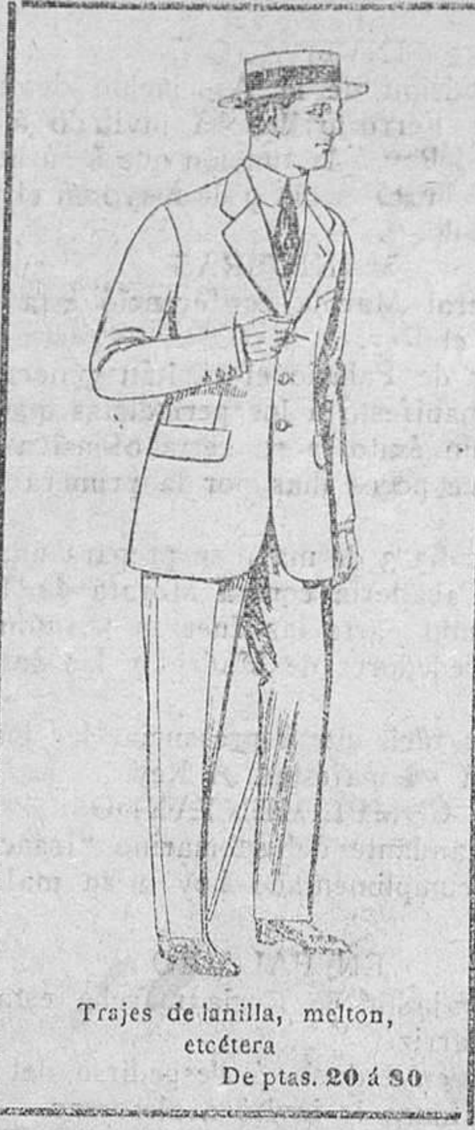
Trajes de lanilla, melton, etcétera. De ptas. 20 a 30