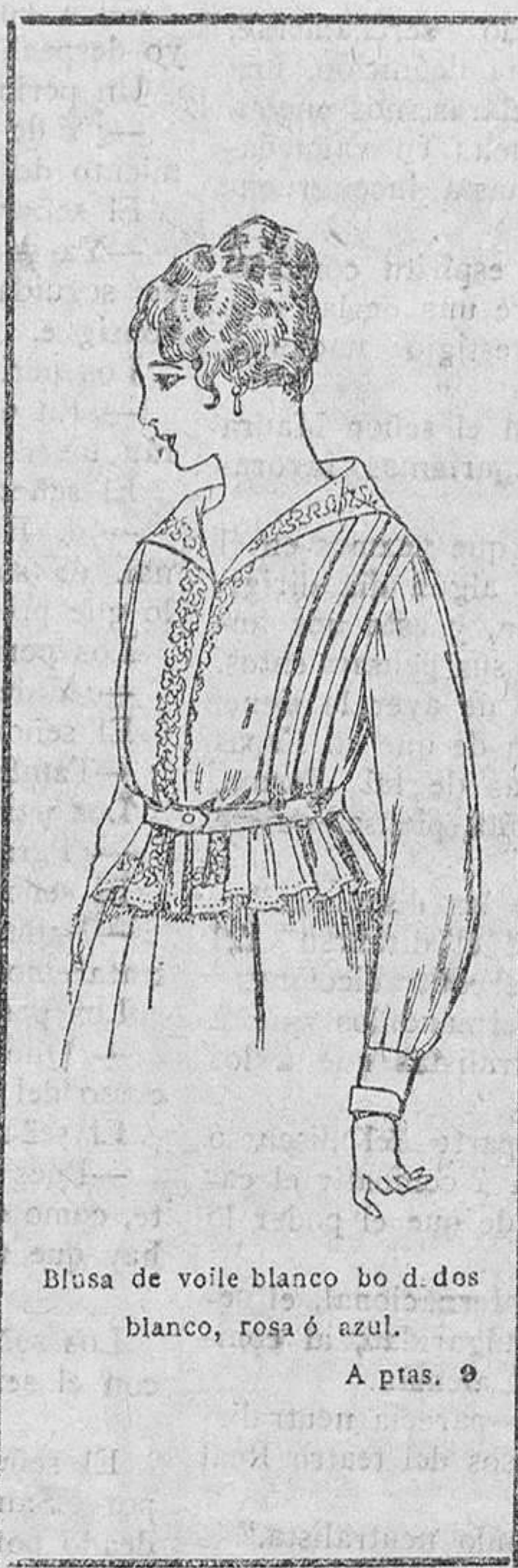
Blusa de voile blanco bo d dos blanco, rosa ó azul. A ptas. 9