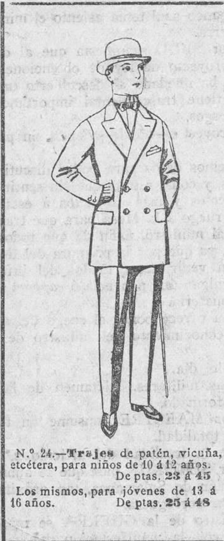
N.º 24.—Trajes de patén, vicuña, etcétera...