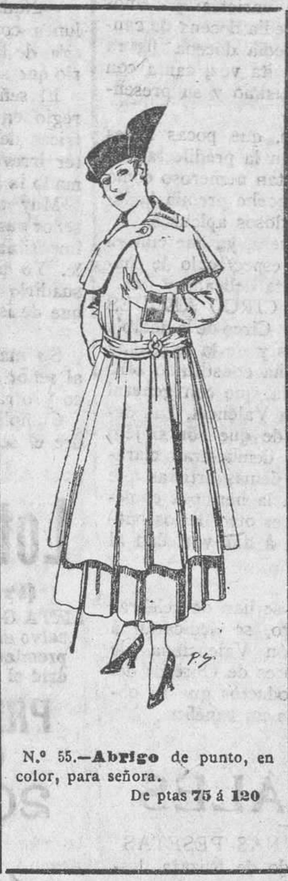
N.º 55.—Abrigo de punto, en color, para señora.