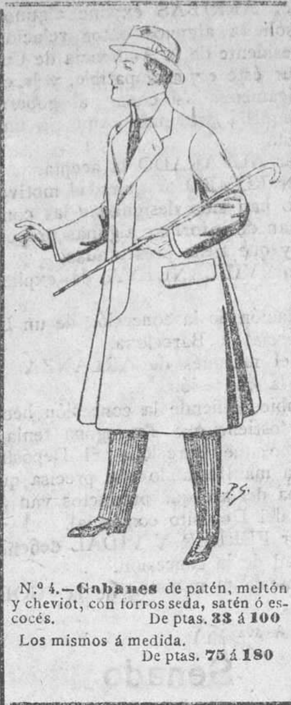
N.º 4.—Gabanes de patén, melton y cheviot...