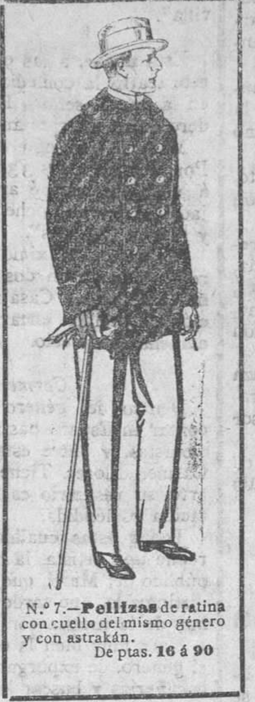
N.º 7.—Follises de ratina con cuello del mismo género...