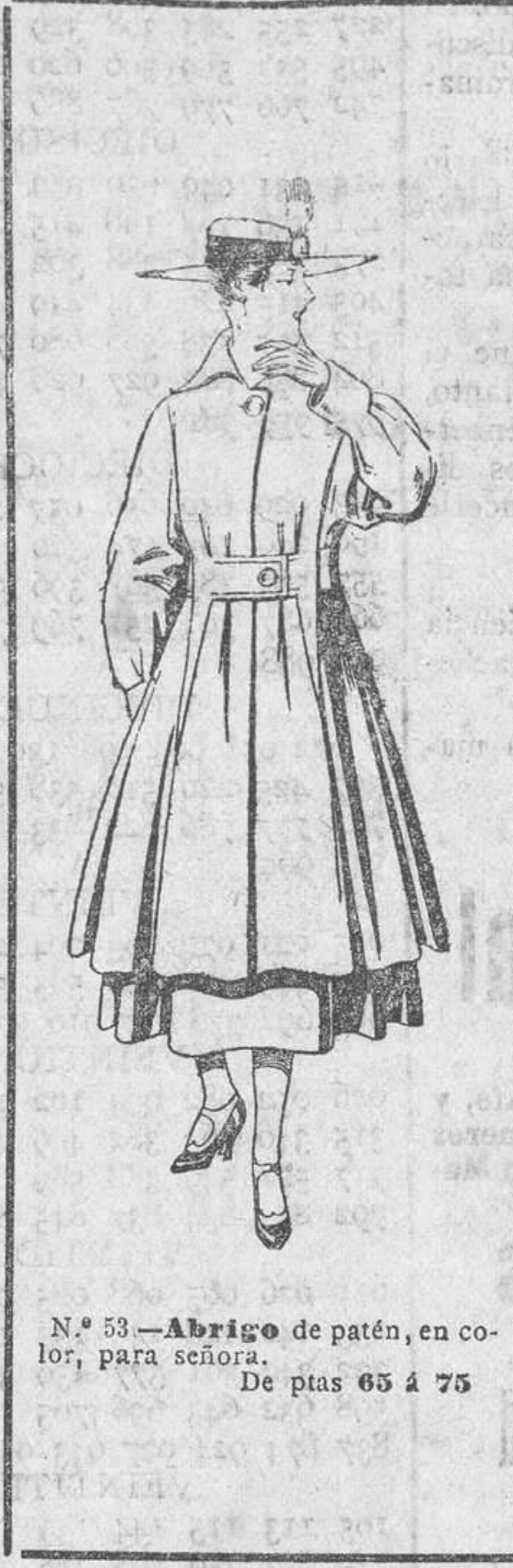
N.º 53.—Abrigo de patén, en color, para señora.