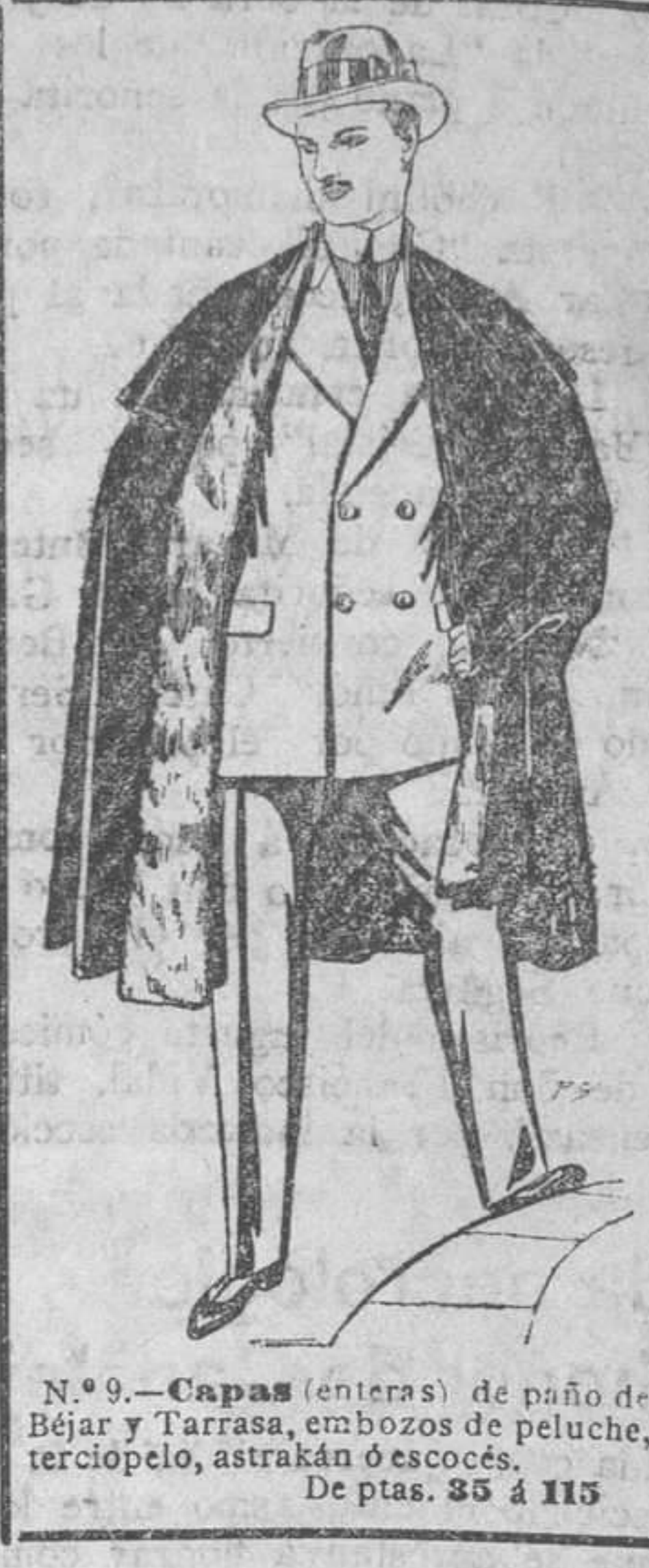
N.º 9.—Capas (enters) de paño de Béjar y Tarrasa...