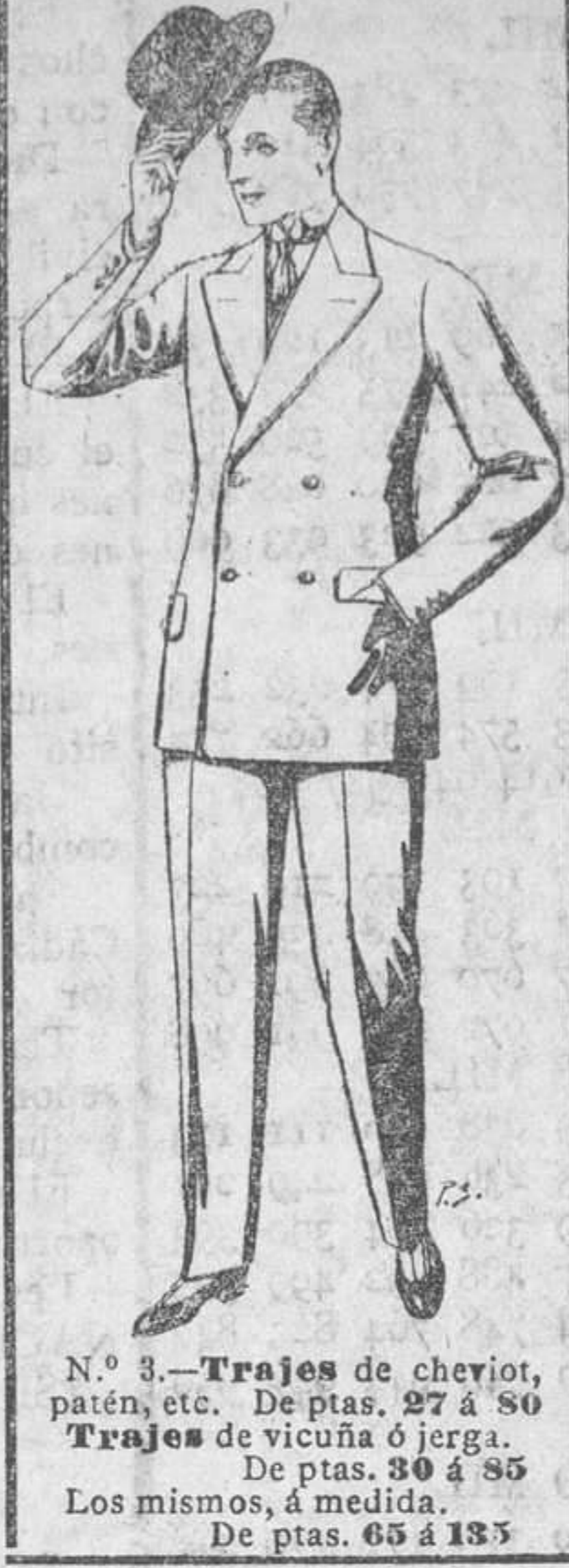
N.º 3.—Trajes de cheviot, patén, etc. De ptas. 27 á 50...