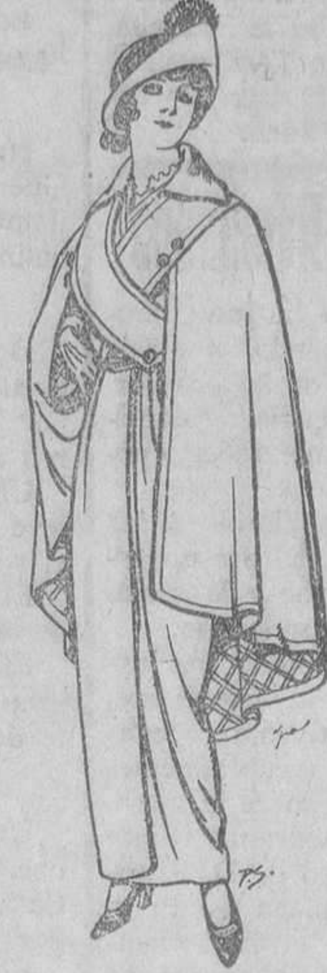
Capas de lana negra para señora. A ptas. 16

Peletería, Camisería, Géneros de punto, Comodidad. Guantería, Sombrerería, Zapatería, Paraguas, Bastones y Artículos de viaje