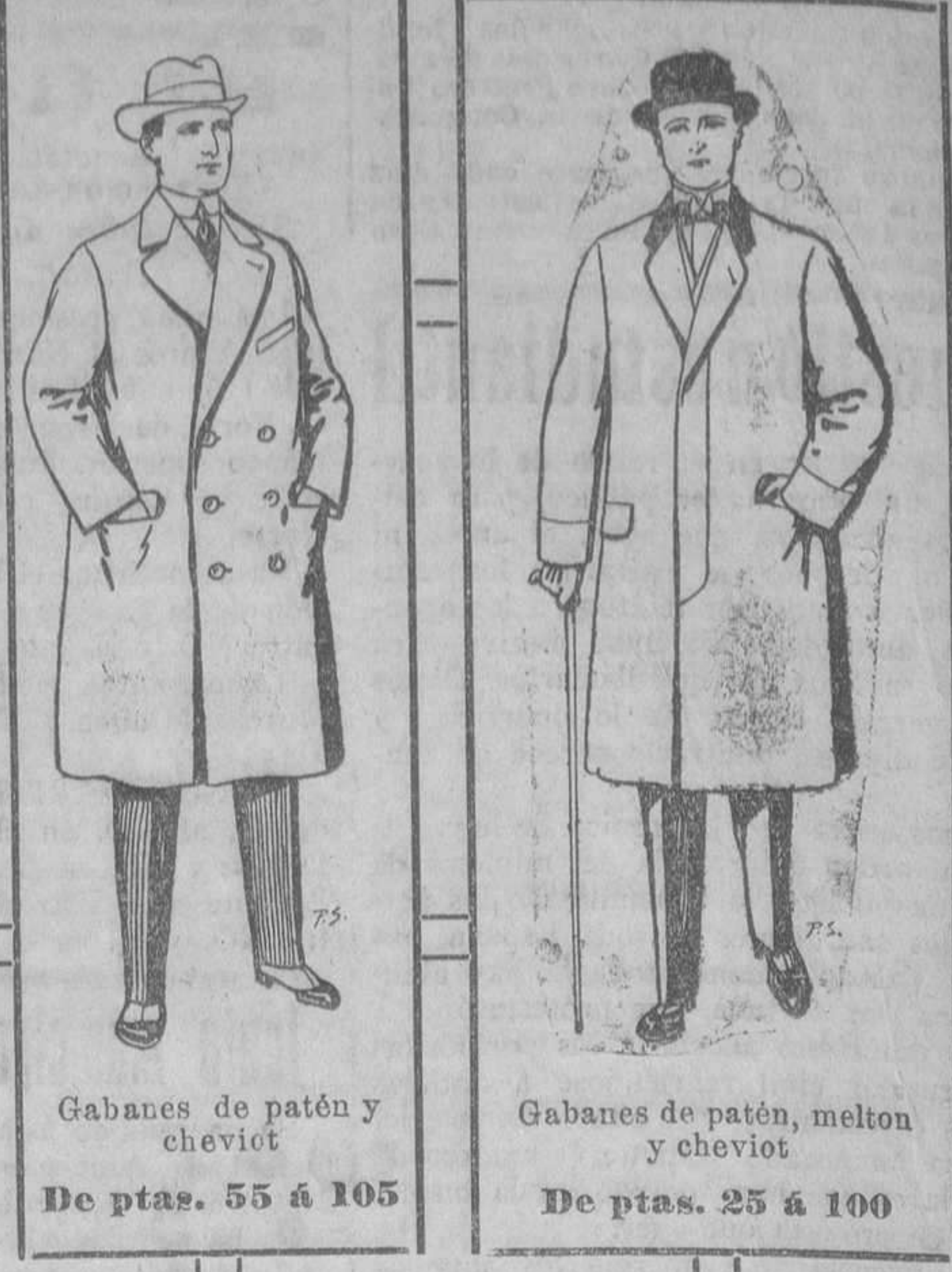
Gabanes de patén y cheviot. De ptas. 55 á 105