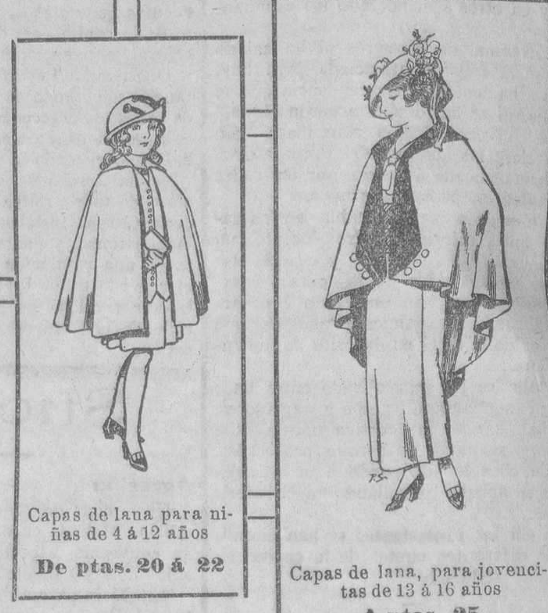
Capas de lana para niñas de 4 á 12 años. De ptas. 20 á 22