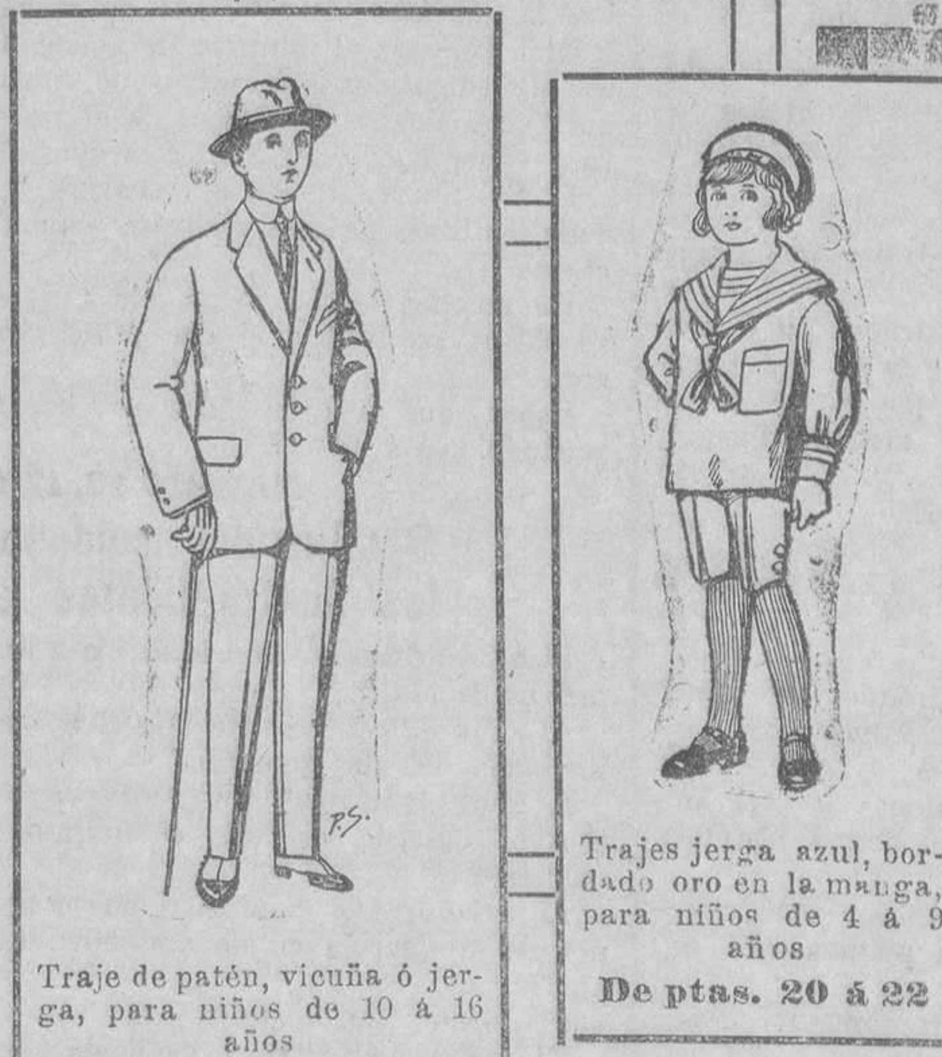
Traje de patén, vicuña ó jerga, para niños de 10 á 16 años. De 13 á 48 ptas.