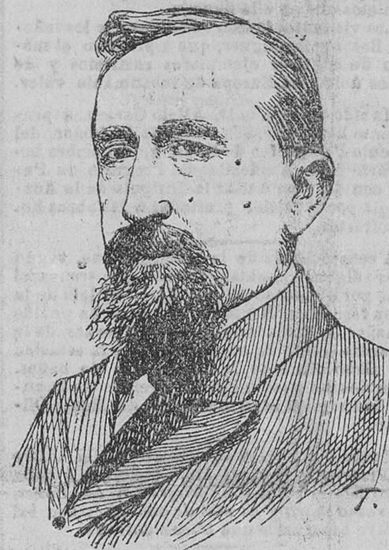
Excmo. Sr. D. Federico Requejo DIRECTOR GENERAL DE OBRAS PÚBLICAS

El puente se compone de un tramo metálico del sistema Bow-String de 60 00 de luz, de vigas parabólicas, siendo su pesalte de 8 75 metros. El ancho entre ejes es de vigas 7 00 metros, 5'00 libras,