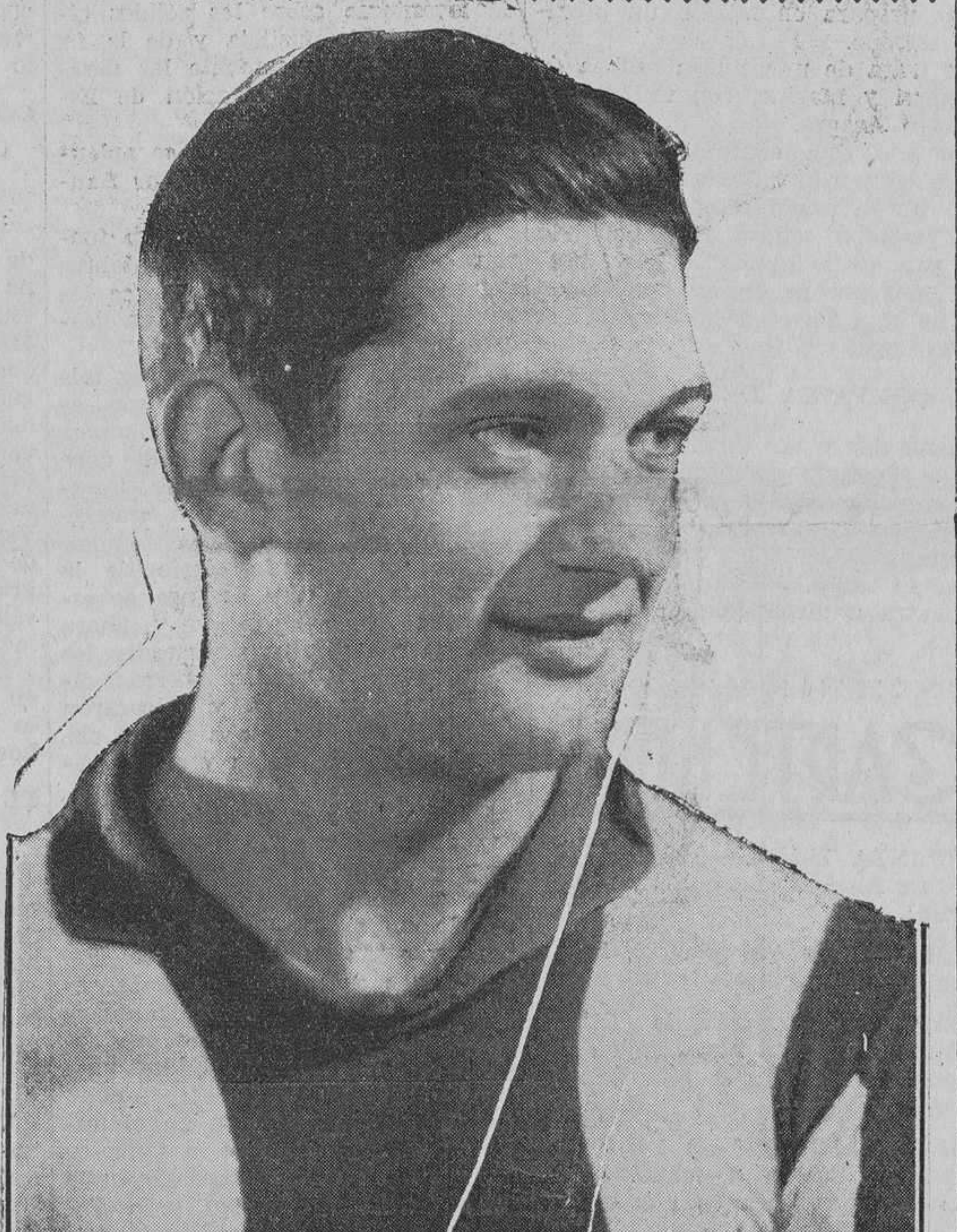
Ventorá, el extremo plantado de "Montjuich" al carque de "María Luisa".

El partido de lunes ha despertado cataratas de comentarios. La gente habla entusiasmada del empuje de Eugenio, del chut formidable de Eugenio, de lo que juega Eugenio de interior.