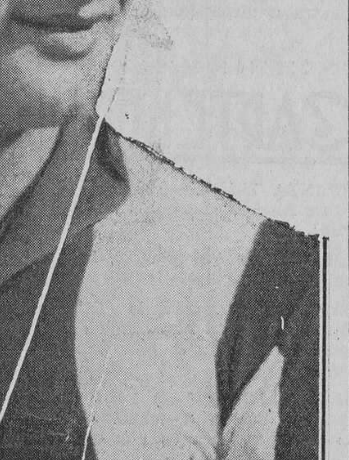
Ventorá, el extremo plantado de "Montjuich" al carque de "María Luisa".

extrañarnos nada que Calero haya sido "vendido". Pero nos vamos extendiendo excesivamente y vamos a terminar. Como fin solamente diremos que Calero se ha marchado bien a su pesar de Vitoria, y únicamente por no colocarse en la situación de "forzoso" y que ello, su excelente deseo de quedarse en Vitoria, obediencia en particular a la enorme cantidad de simpatías con que contaba aquí, que lo demuestra el homenaje de desagravio que se le preparó al que han prometido su asistencia todos los jugadores y el hecho de haberse repartido "escritos clandestinos" y anónimos "en favor del equipier puesto entendido la actitud de la Junta Directiva del Club.