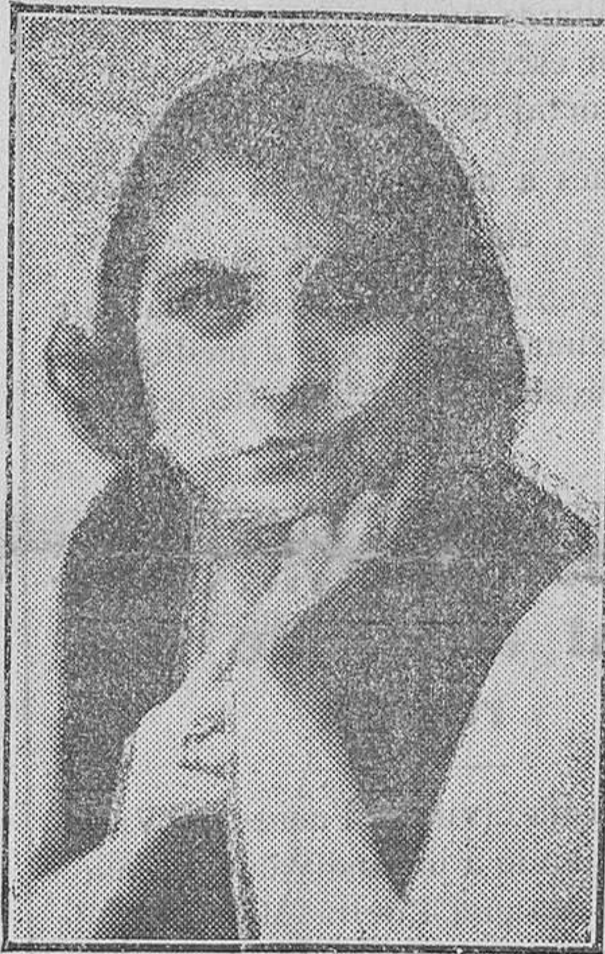
María Herrero, la bella y notable actriz, protagonista de «El peligro amarillo».