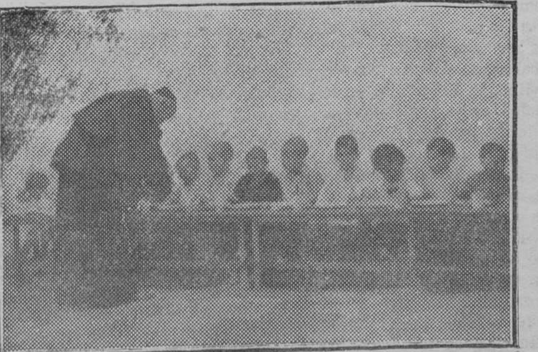
UNA CANTINA ESCOLAR EN MELILLA La hora de la comida.—Un fraile sirviendo a los niños la comida.

La Academia publicará por su cuenta los trabajos laureados.