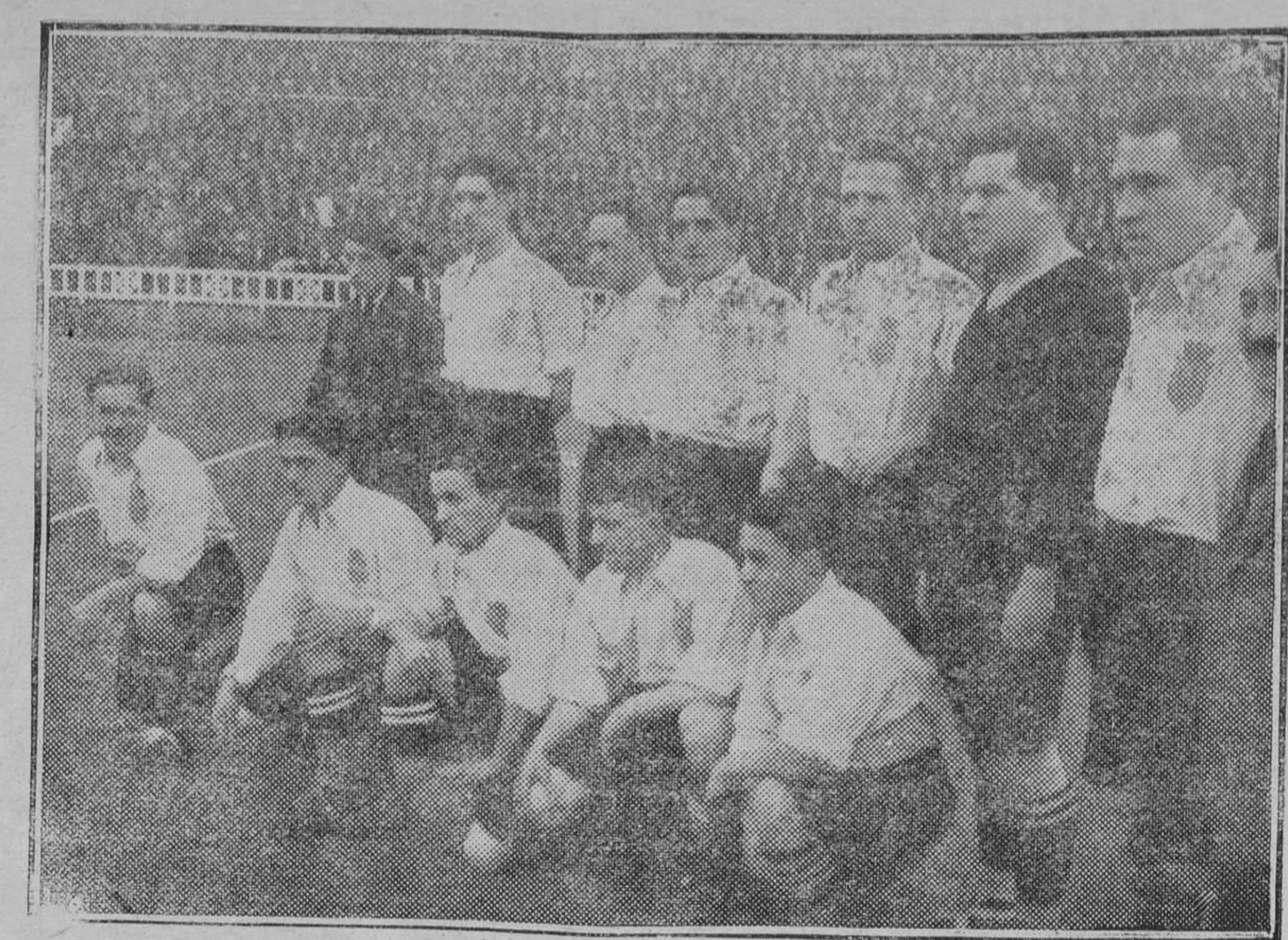
El equipo Guipuzcoano que contentió el domingo con el once de Cataluña.

Por último se habló de la intervención del Banco de Crédito Industrial, a virtud de la protección solicitada y obtenida del Estado, y con motivo de esta intervención se dió cuenta de la conveniencia, que no es en modo alguno necesidad, de reducir si es posible el capital obligacionista en circulación.