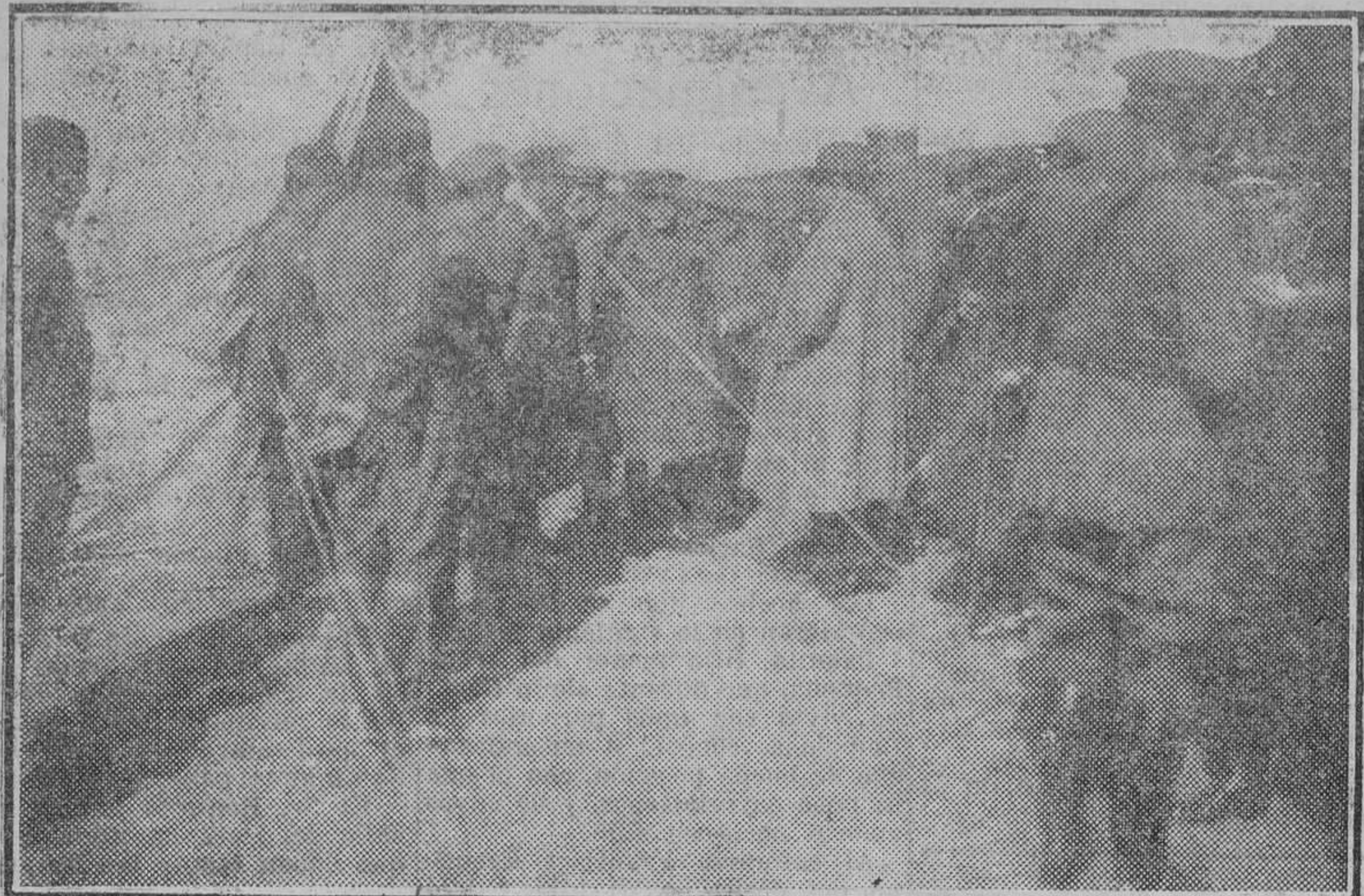
Las autoridades en la estación provisional de Benkarrich

tantas otras, para honra de dicho Cuerpo, ha sido recientemente sellada con sangre de sus individuos. Saludo a V. E. desde esta estación, que jalona un nuevo cauce en obra civilizadora que España desarrolla en Marruecos.