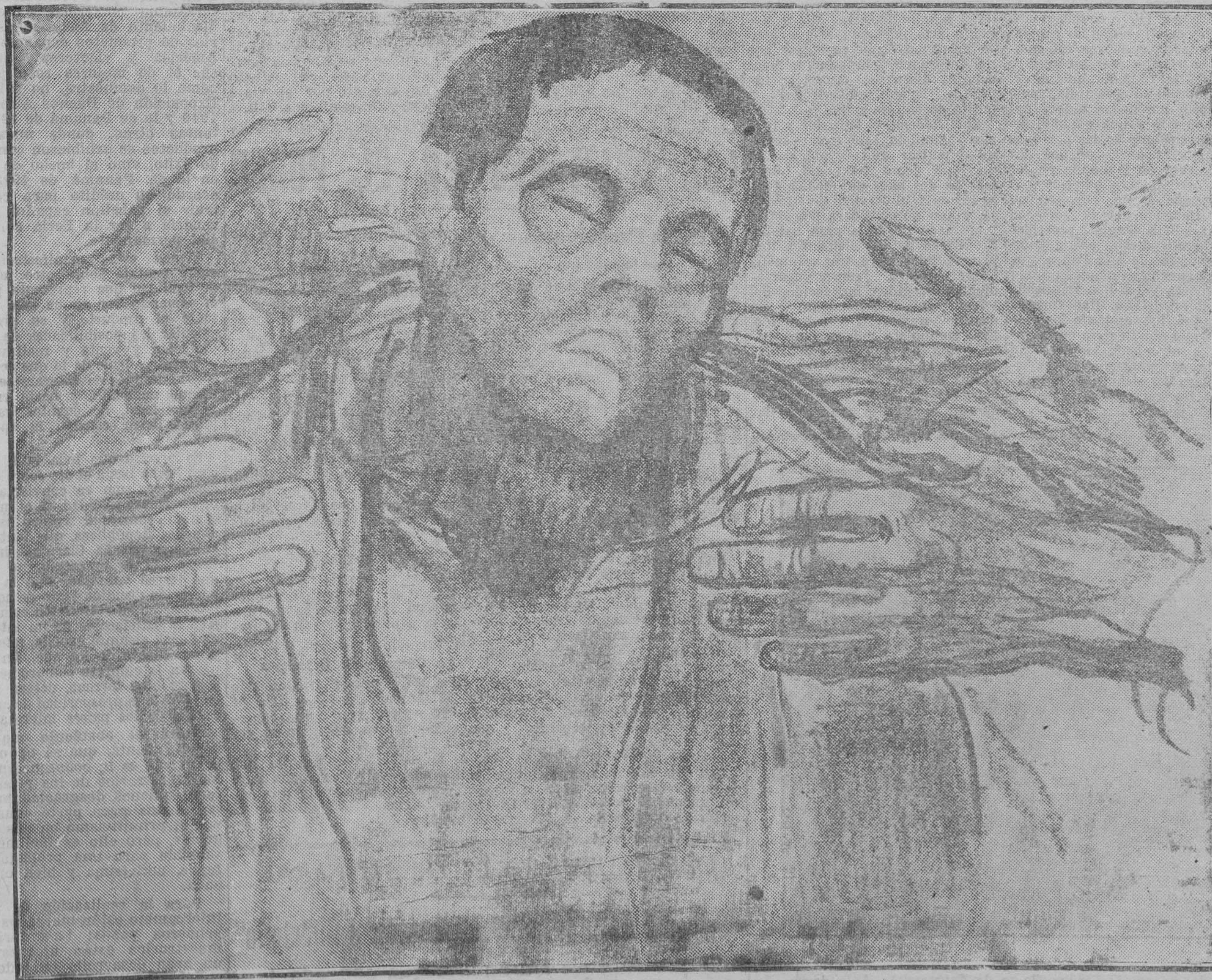
El lápiz mágico de una artista excepcional, Katha Kollevitz, da, en este magnífico dibujo que reproducimos, una de las más hondas y permanentes sensaciones de los terribles sufrimientos que está pasando el proletariado alemán en estos momentos trágicos. Este dibujo es uno de los gritos más vigorosos de apelación a la piedad de todos los pueblos. Lo reproducimos como un llamamiento energético, apremiante, desesperado a todas las personas de corazón. Socorramos a los que en Alemania están padeciendo una espantosa miseria, a los intelectuales, a los obreros, a las mujeres, a los niños, a las víctimas todas del inmenso crimen que se tramó en las alturas, pero que se espía abajo, entre las víctimas eternas, entre los desheredados de la fortuna!