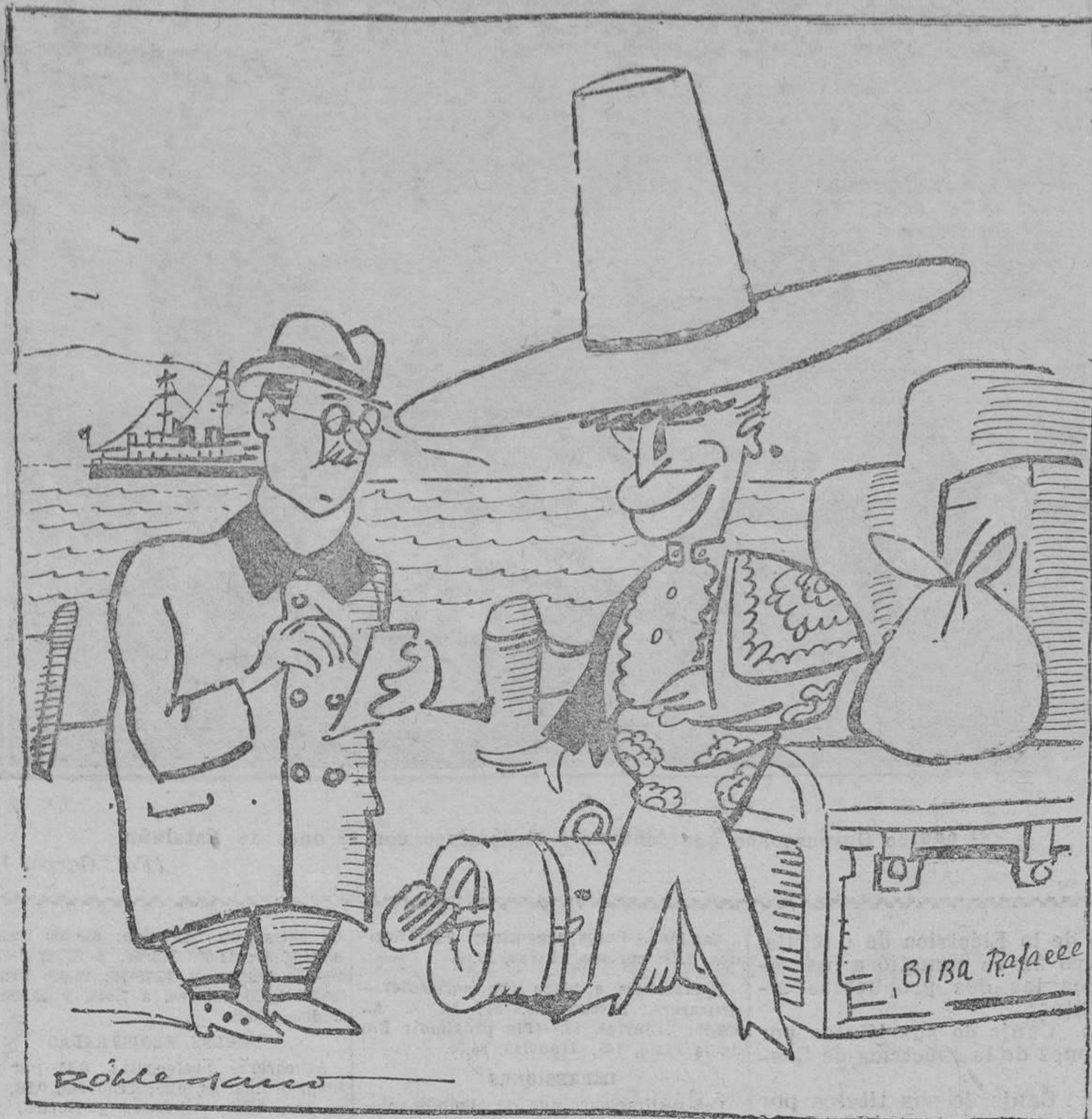
EL GALLO.—Pues, "vii"; diga "ustó" que la herida era de carácter gravísimo (1.875 pesetas); pero luego ha "quedao reduciú" a un puntazo "corrió" (650 pesetas).