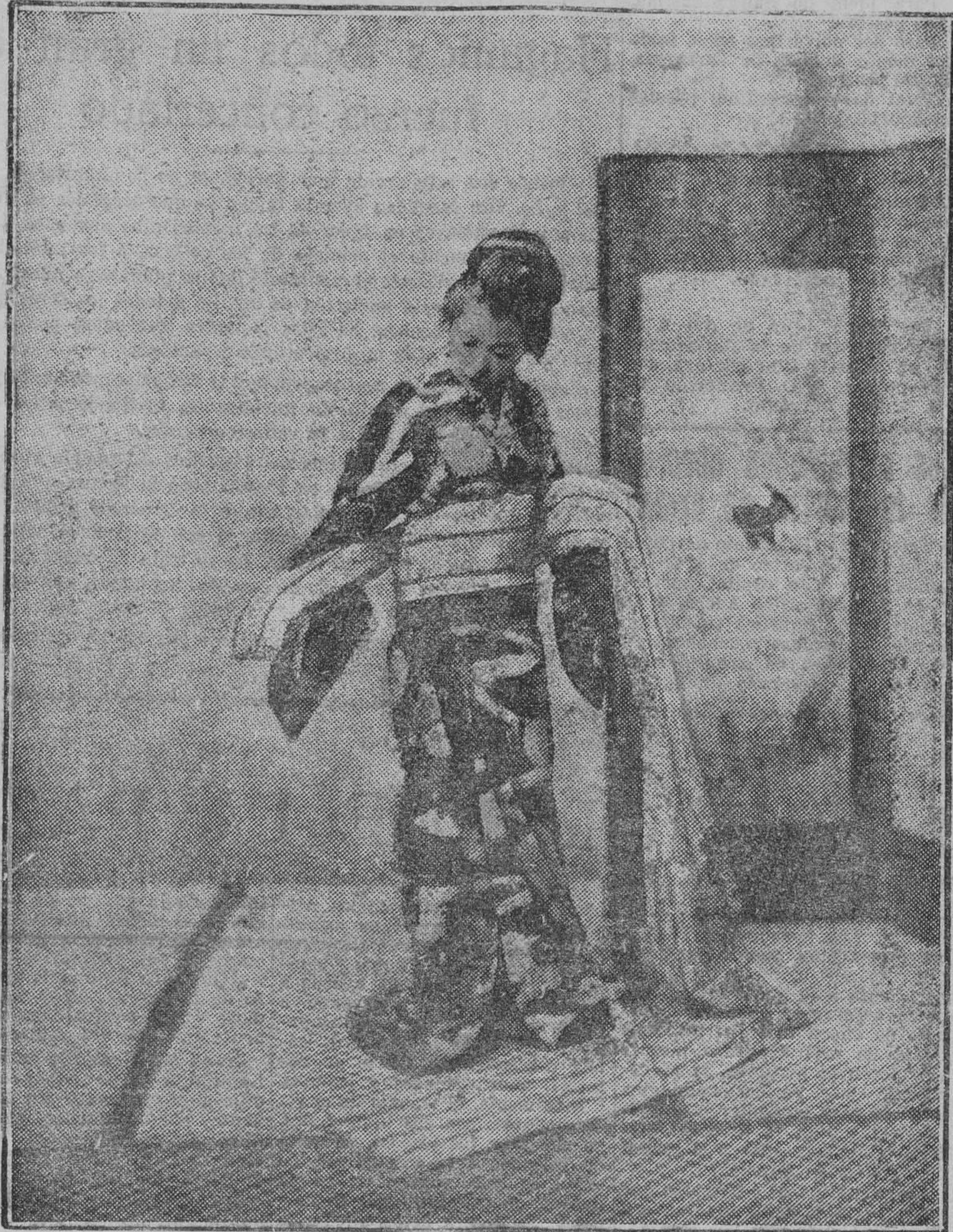
Una preciosa hija del Sol Maciente ocupándose en la difícil colocación del "obi", para lo que se requiere un arte especial, que tradicionalmente se transmiten todas las jóvenes niponas como un secreto religioso.

Leer LA OPINIÓN a diario es llevar el índice más seguro de la vida nacional.