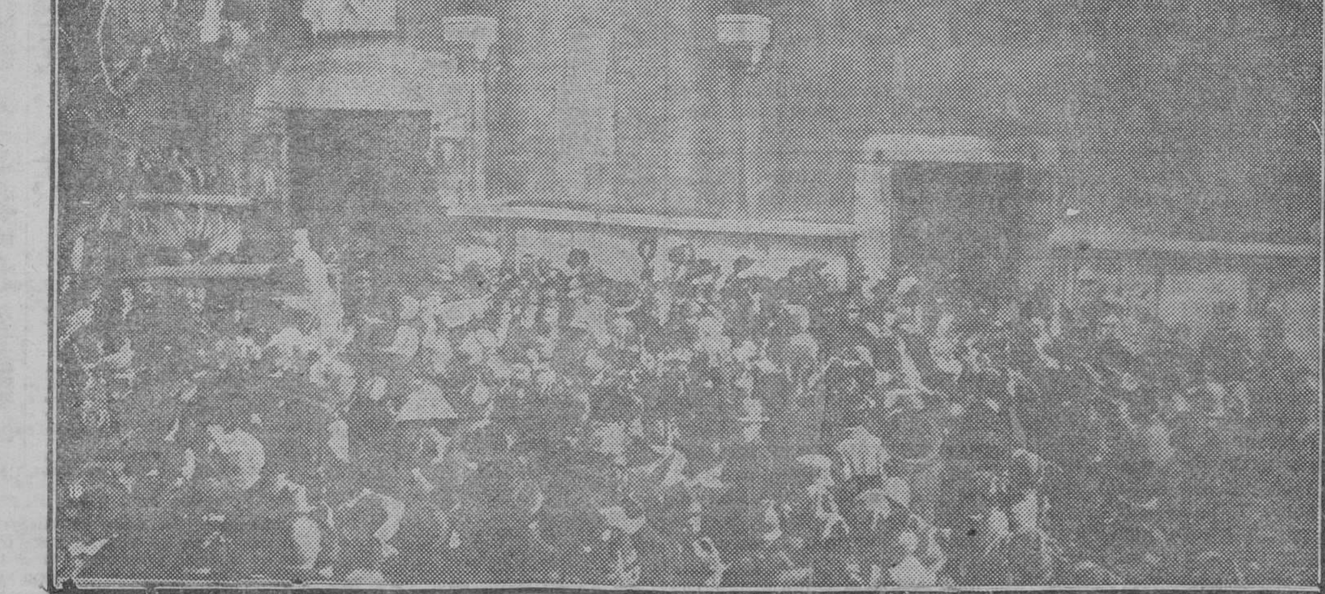
Salida de Roma de Benito Mussolini y despedida cariñosa que le dispensa el pueblo italiano a su salida para Spezia, el día 18, para acudir a recibir a nuestros Reyes

de España regresaron a la Embajada del Vaticano, desde donde, después de cambiar nuevamente de coches, regresaron nuevamente al Quirinal.—I.