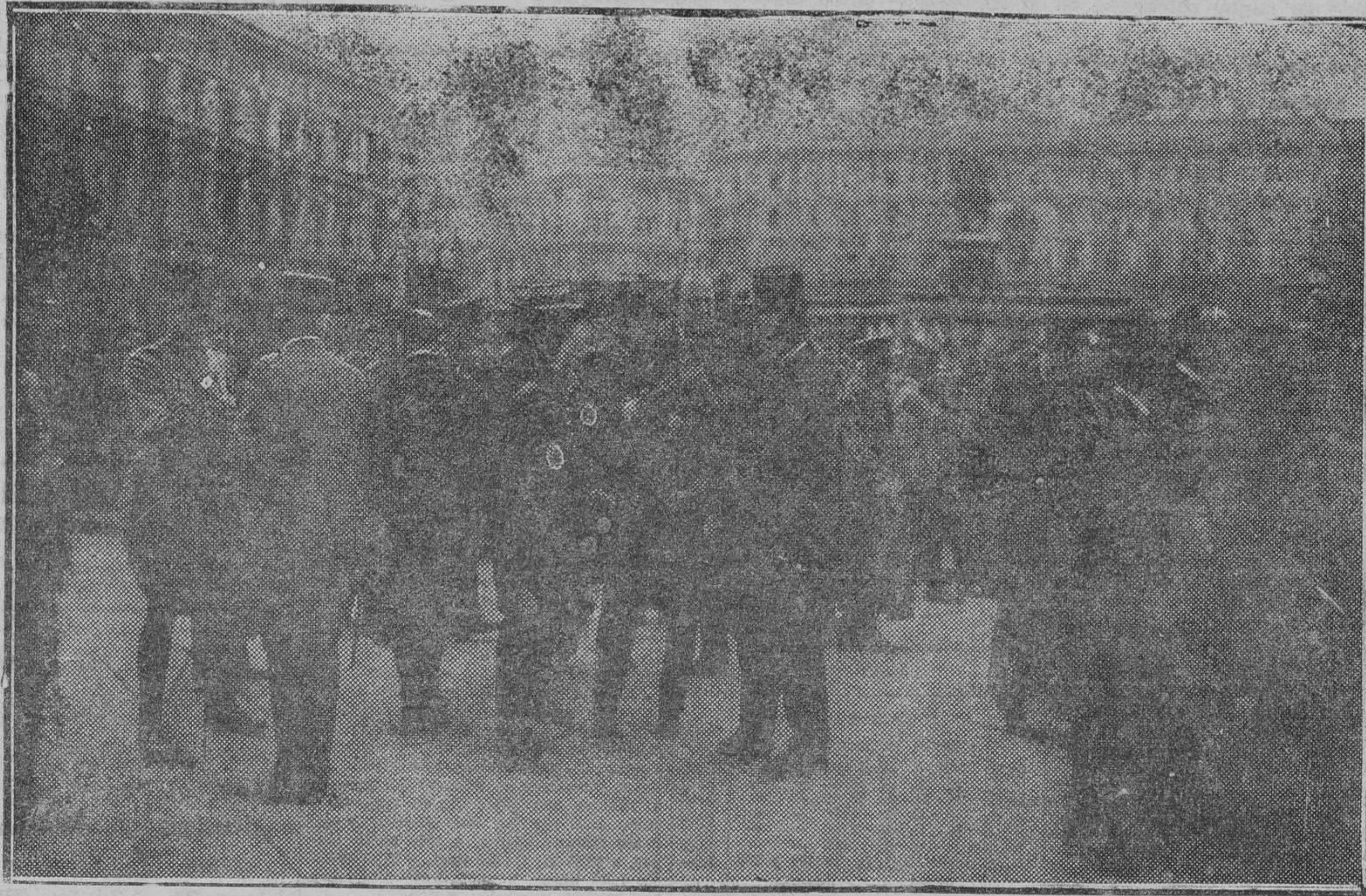
Autoridades civiles y militares italianas esperando en Roma, el día 19, por la mañana, la llegada de los Reyes de España

No hay negocio sin publicidad. Si administras bien tus intereses, anúnciate en LA OPINION y centuplicarás tus ganancias