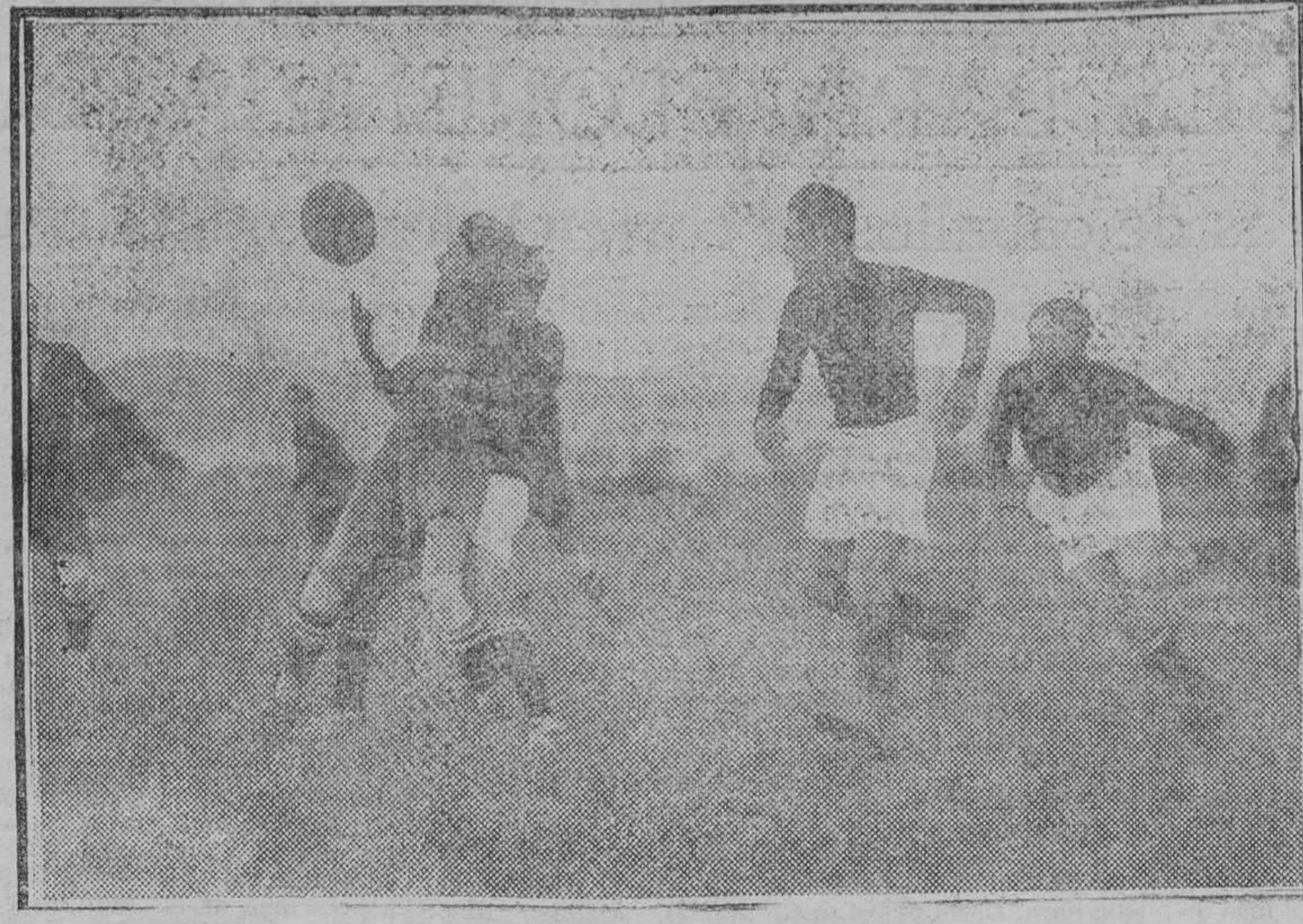
Partido de rugby celebrado en el Hipódromo entre los equipos del Atlético y Centro de de...