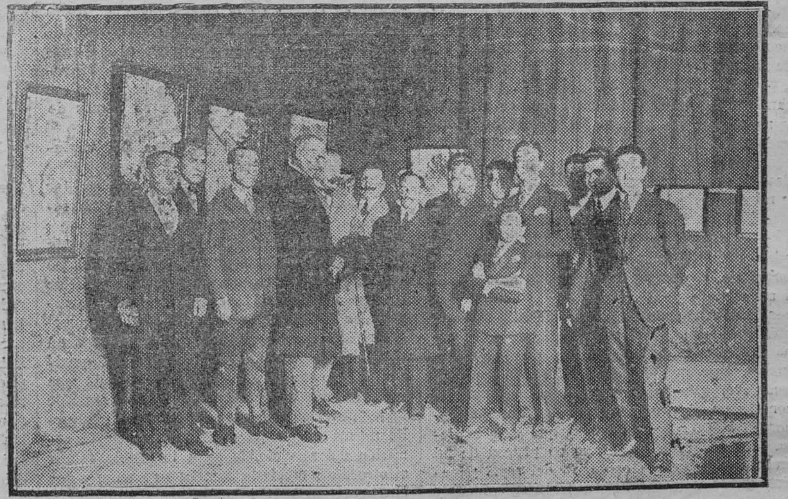
EN EL PALACIO DE BIBLIOTEGAS Y MUSEOS Inauguración de la Exposición de trabajos de los pasajistas pensionados del ministerio de Instrucción pública en El Paular.