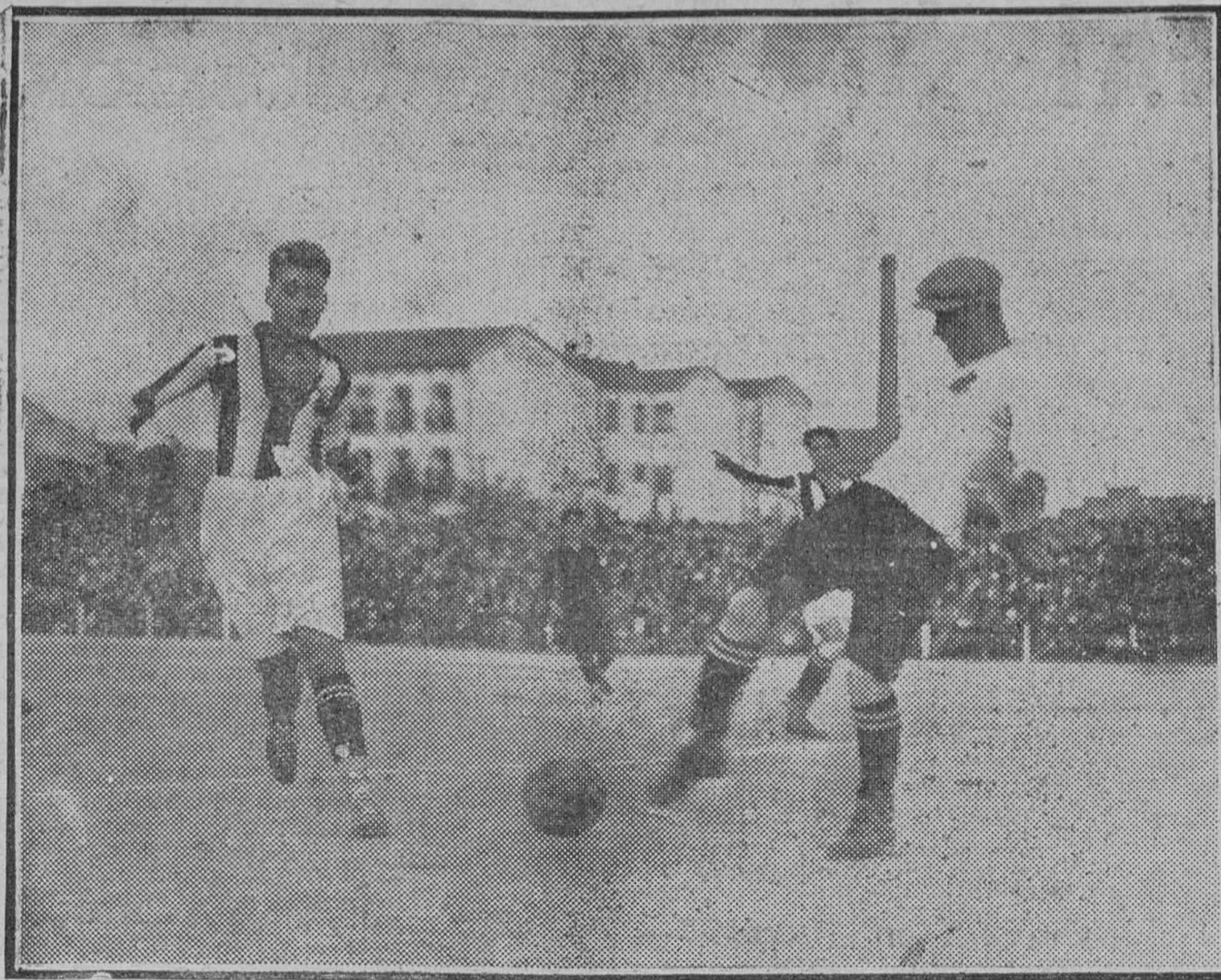
El portero de la Gimnástica parando un "shoot" en el partido de campeonato jugado contra el Racing en el campo del segundo.

El segundo tiempo se inició con arrancadas del Racing, que parecían producto de las