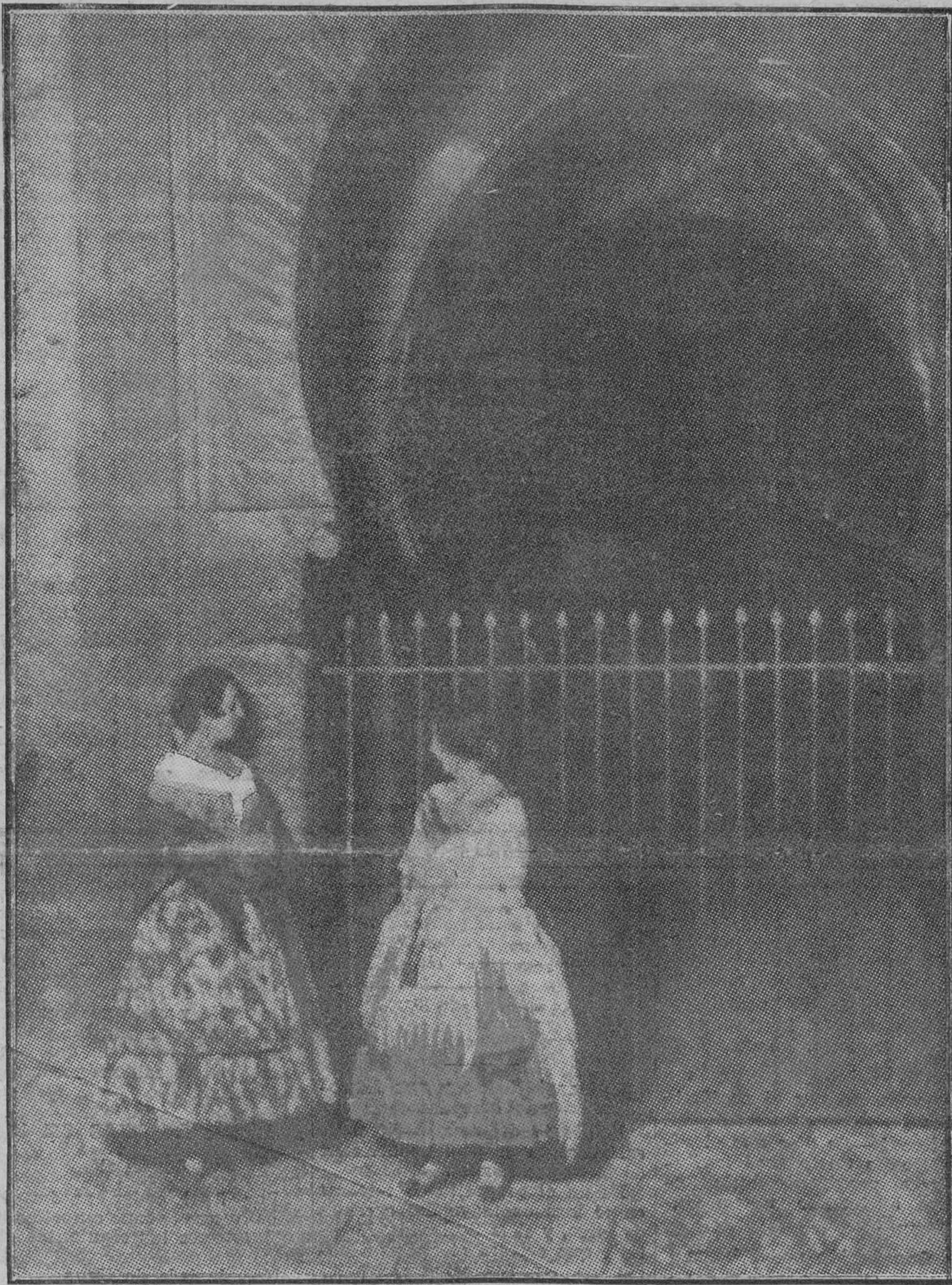
EN LA ALHAMBRA La famosa Puerta del Vino.