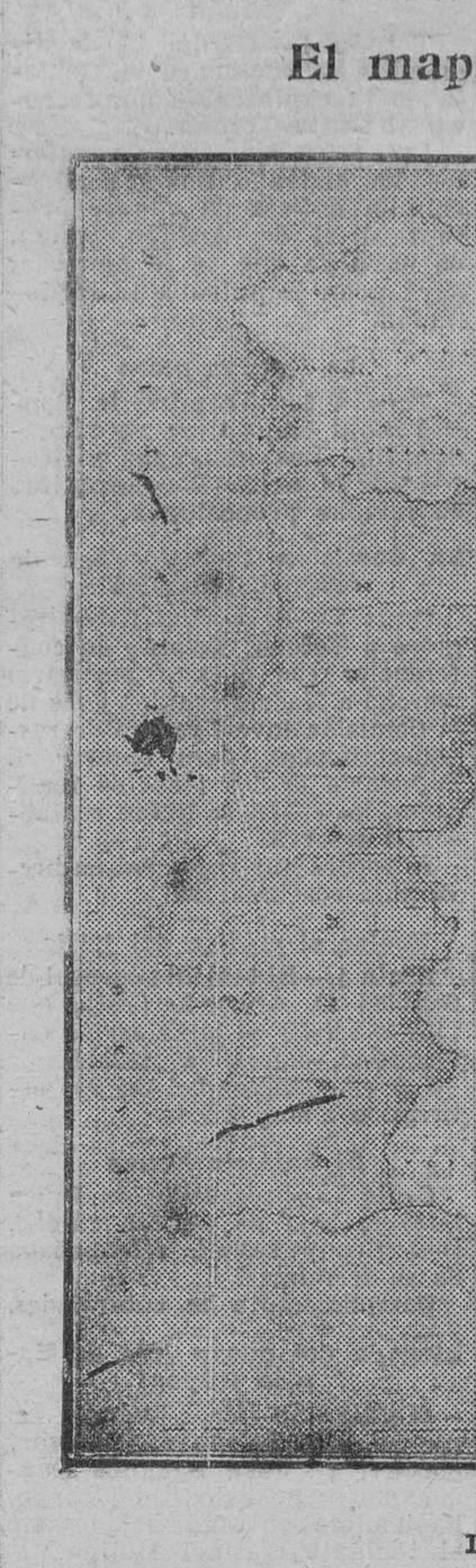
La parte oscura representa las hojas hasta ahora publicadas.

drográficos siempre han sido propios y peculiares de dicha Comisión. Las necesidades militares, tanto en relación a los aprovisionamientos y requisas como al conocimiento del terreno de operaciones y señalamiento de fronteras, han hecho que en todas las épocas y en todos los países se haya preocupado el Ejército de procurarse el mismo el material cartográfico, informativo y estadístico indus-