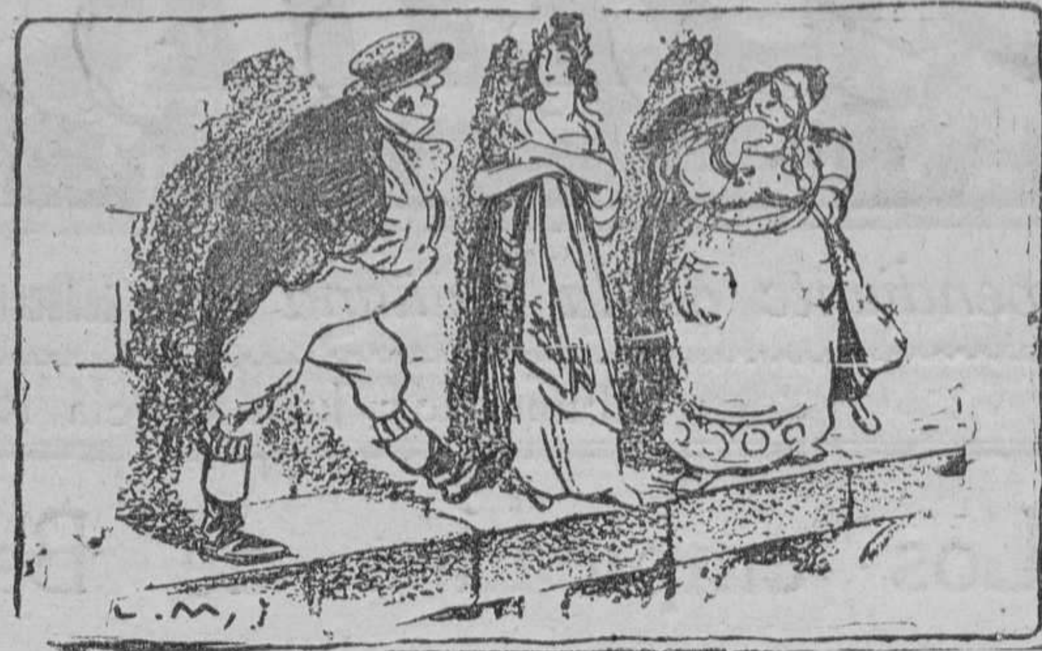
MARIANA A JOHN BULL.—¿Pretendes acercarte a ella o pisarme a mí? (Le Rire, de Paris.)