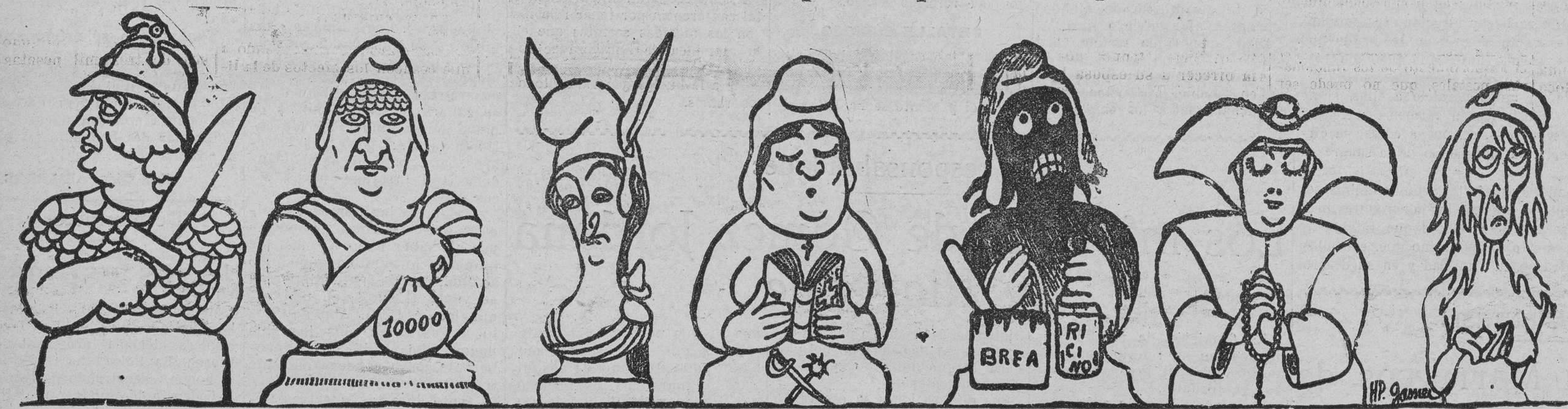
República de Poincaré. La del Bloque Nacional. La del ministro de Instrucción pública. La del general Castelnau. La de 'La Acción Francesa'. La de Mauricio Barrés. La del ministro de Abastecimientos.