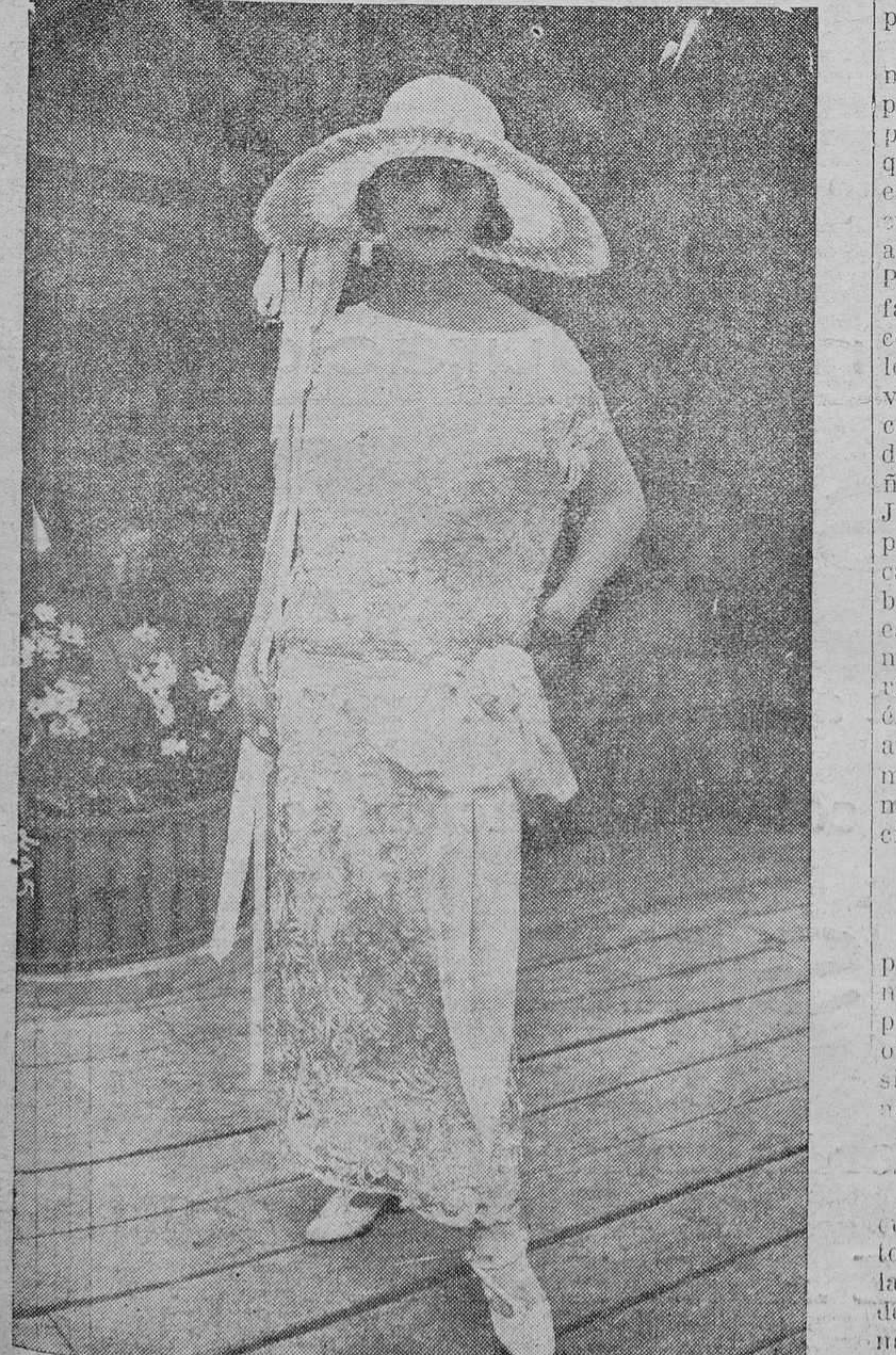
Una de las elegantes de las carreras de París