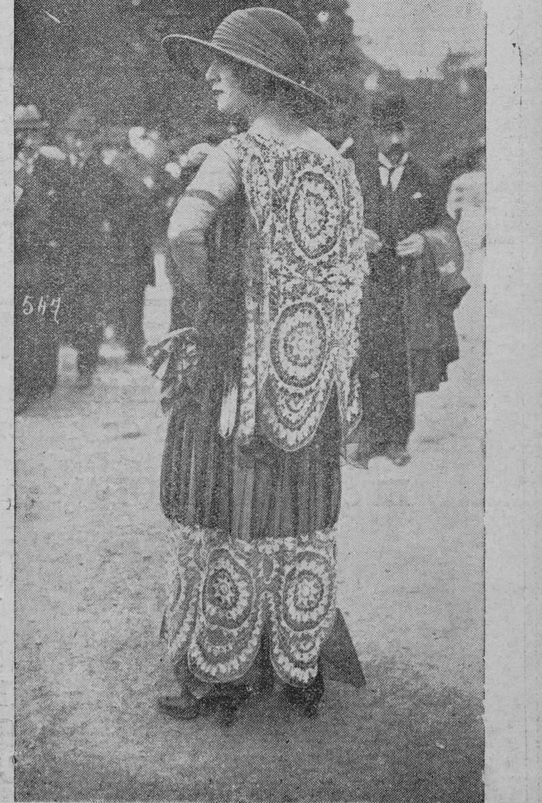
Una de las «toilettes» que más han llamado la atención en las carreras de Auteuil.

El Juzgado se constituyó en el lugar del suceso, practicando las oportunas diligencias.