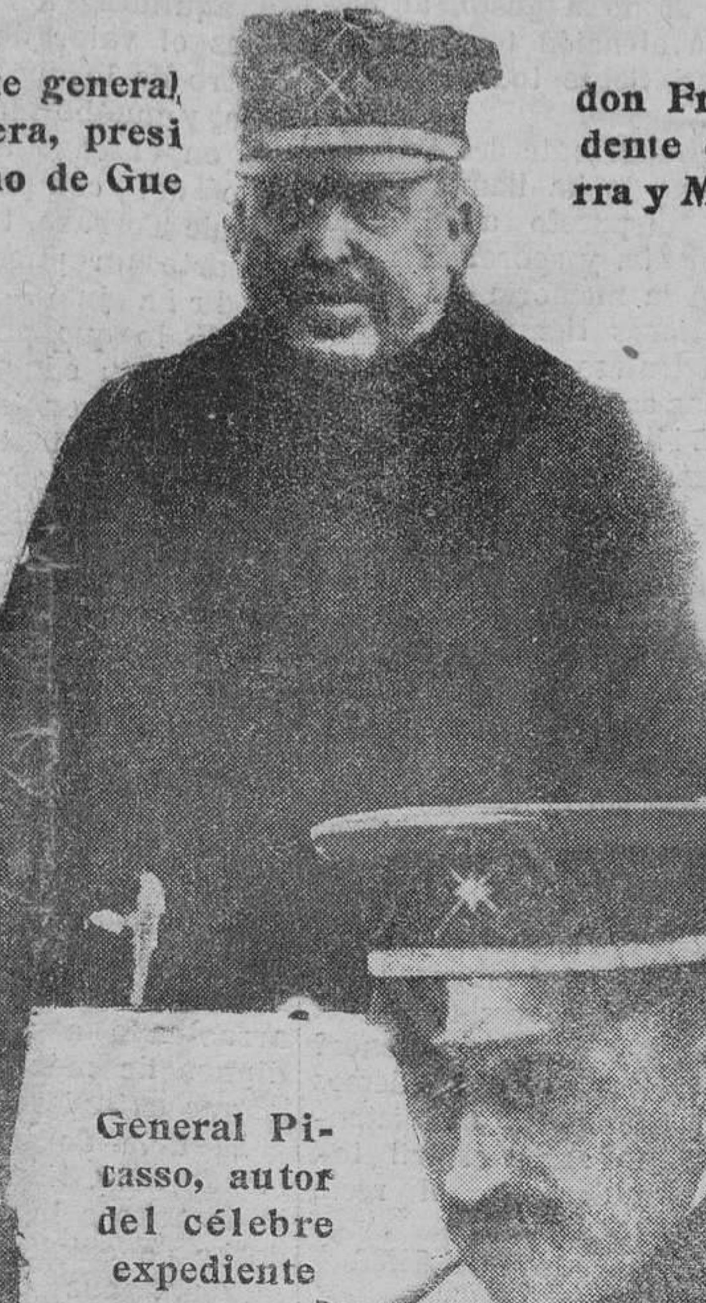
General Piasso, autor del célebre expediente