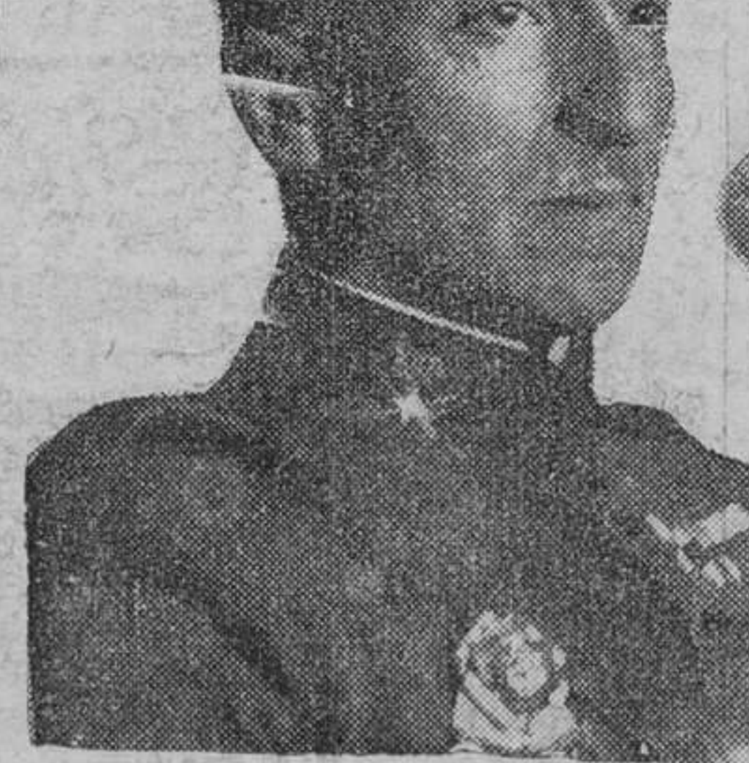
General Ayala, juez de la causa de Berenguer