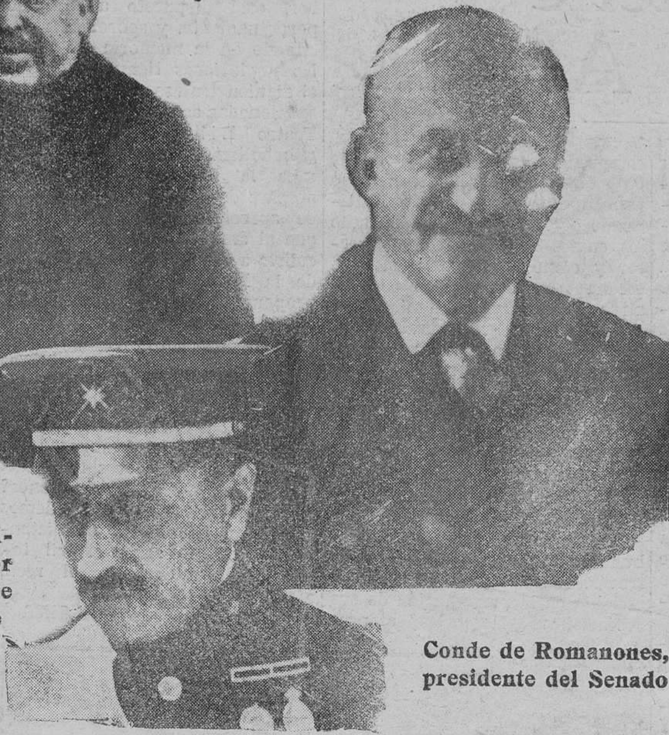
Conde de Romanones, presidente del Senado