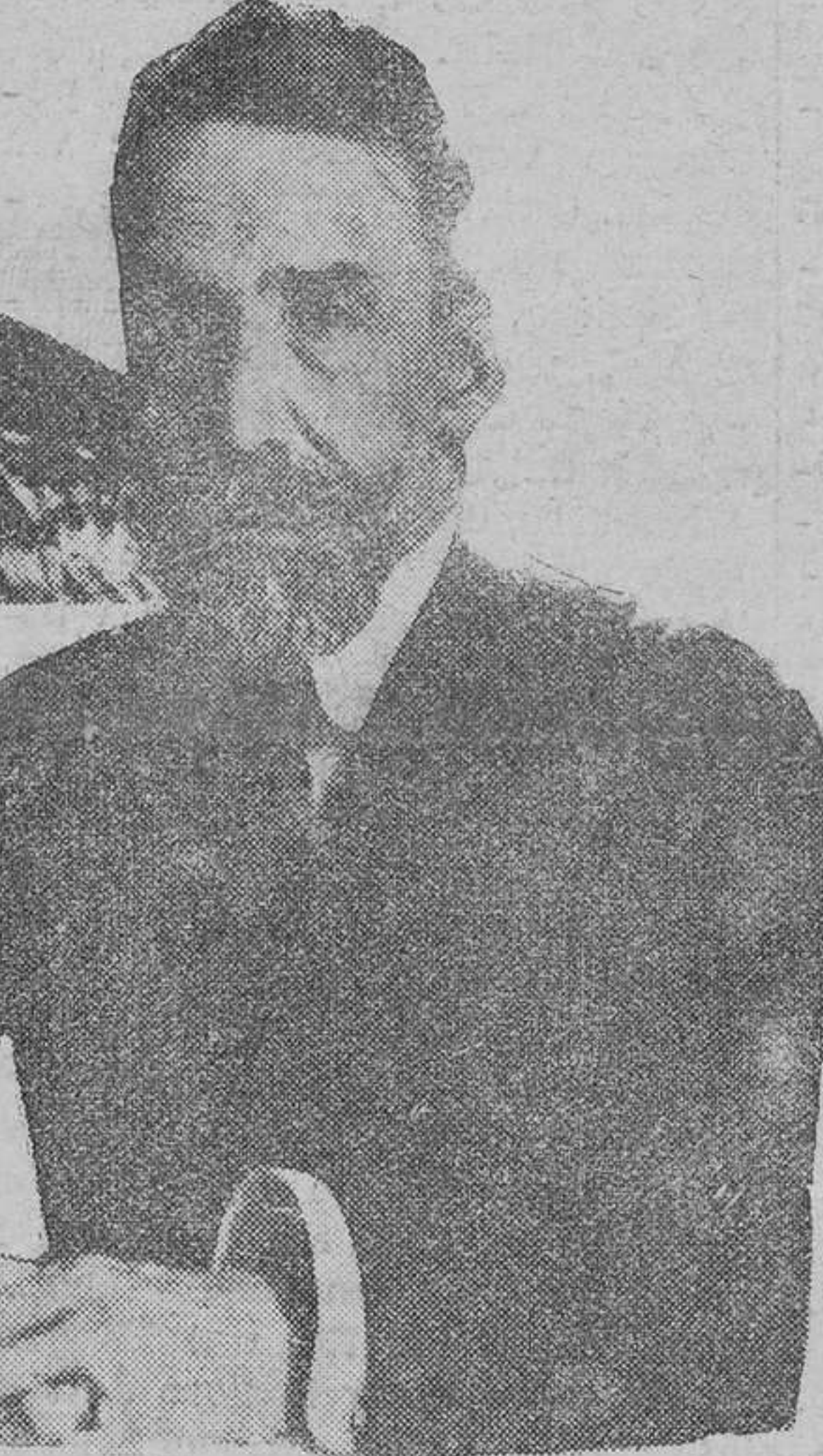
Teniente general Villalba, Consejero del Supremo