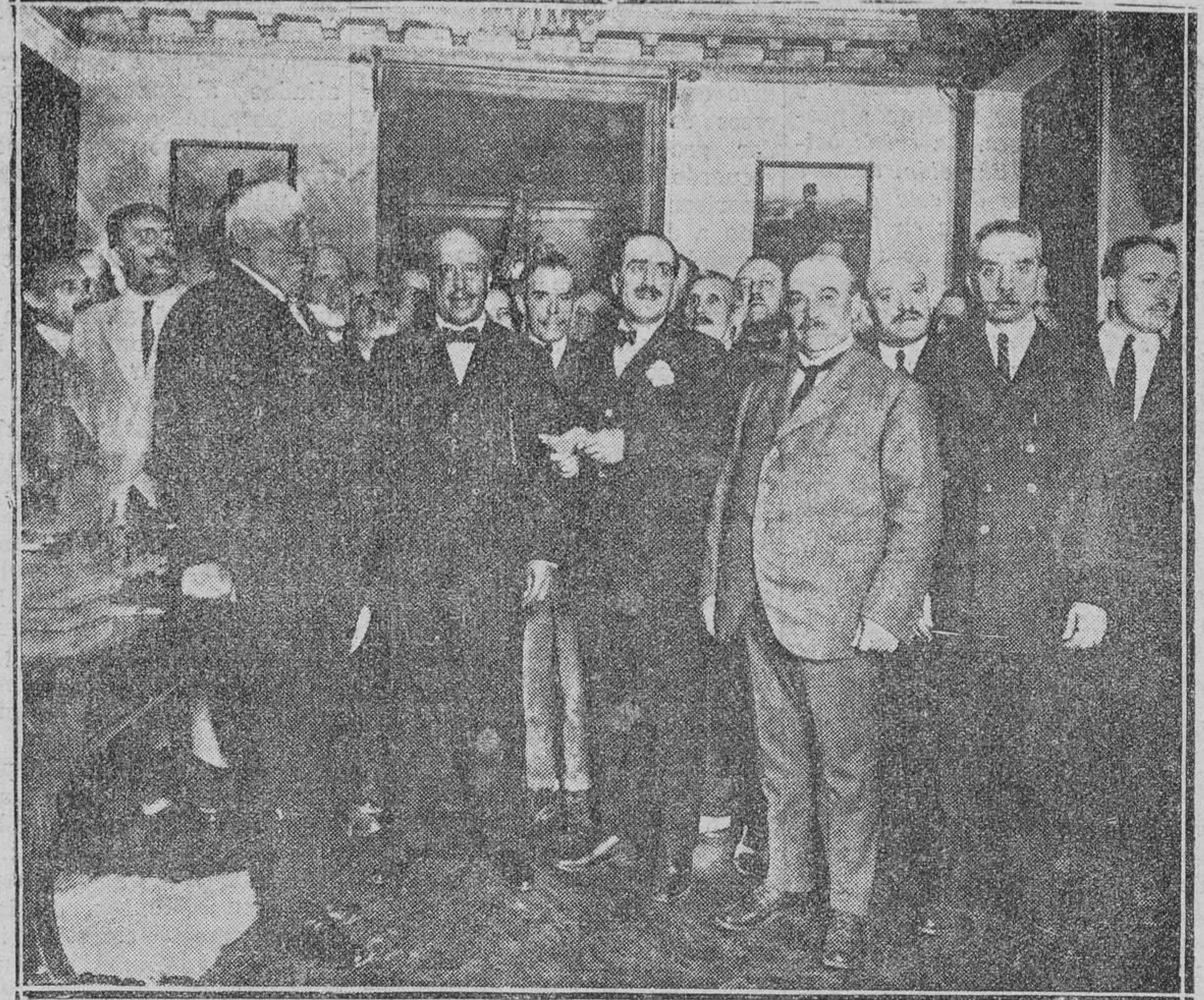
DEL HOMENAJE DE ANOche AL GENERAL AGUILERA. El capitán general de Madrid y el gobernador militar rogaron a nuestros fotógrafos que no se les retrataran. Por eso no aparecen aquí, aun cuando asistieron a la reunión.

Poco antes de las cuatro de la tarde estaban en el despacho del