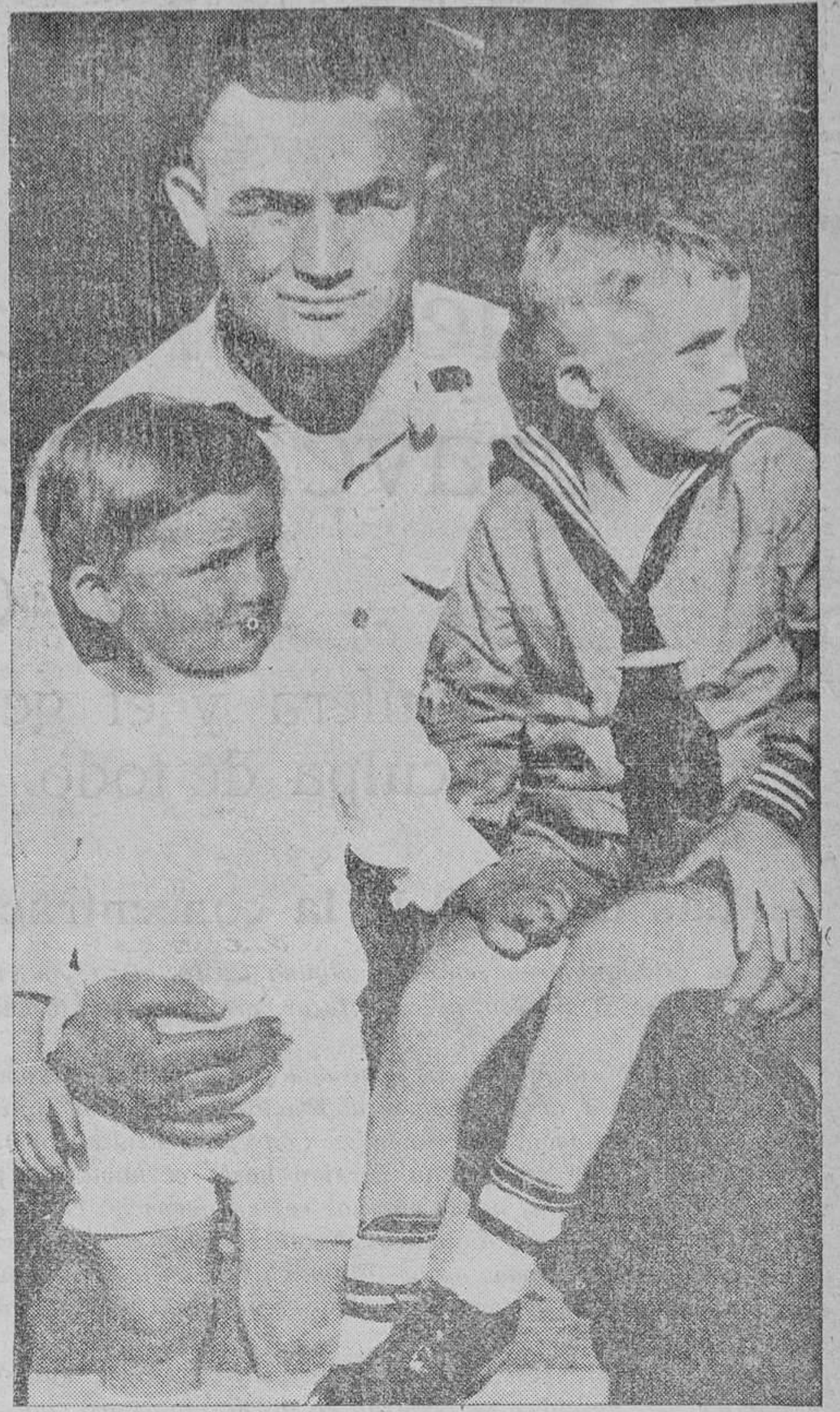
Johnny Gibbons, que en estos días va a luchar con Dempsey para disputar a este último el campeonato del mundo de boxeo.—En esta fotografía aparece Gibbons acompañado de dos de sus hijos.