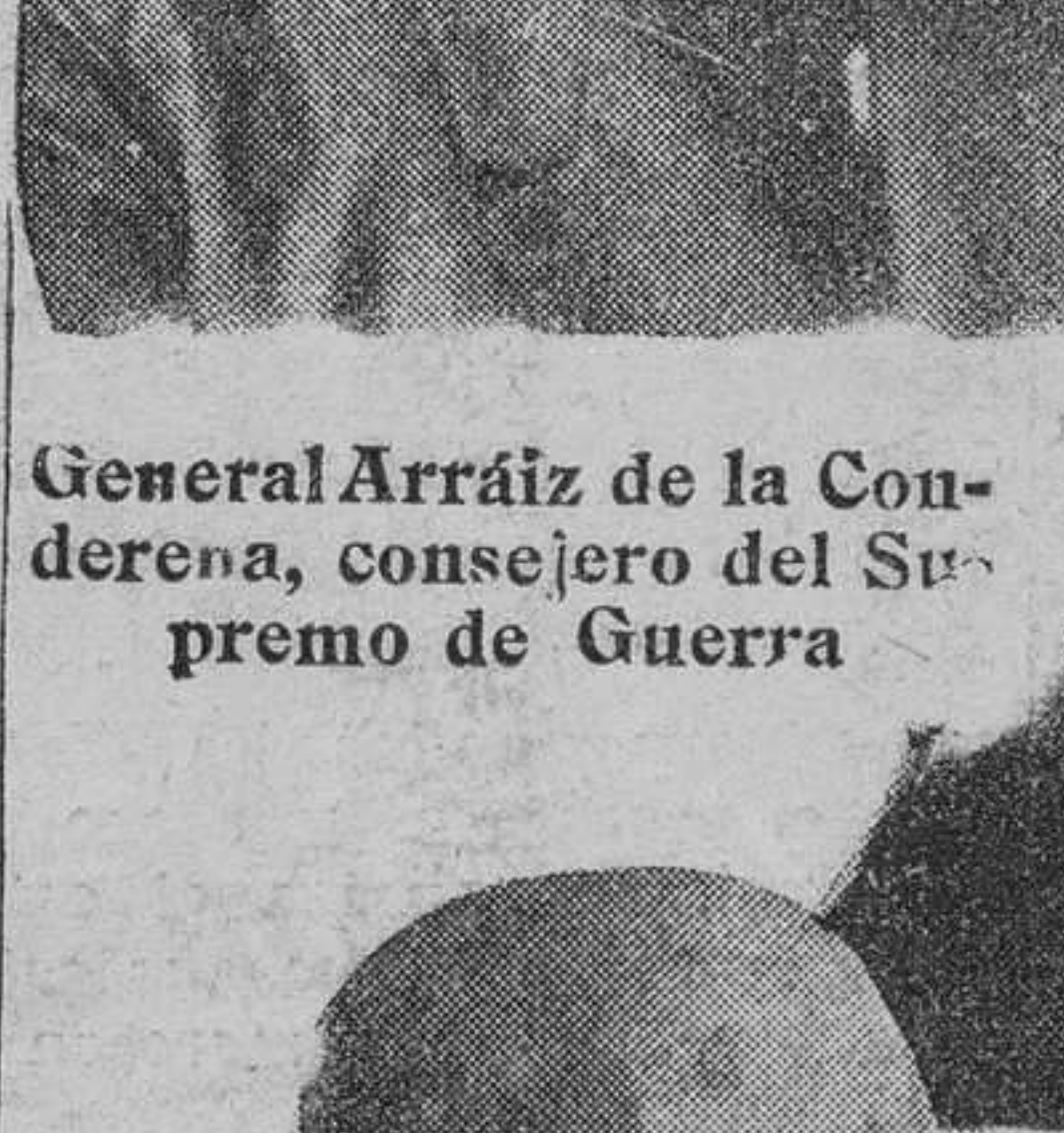
General Arráiz de la Condena, consejero del Supremo de Guerra