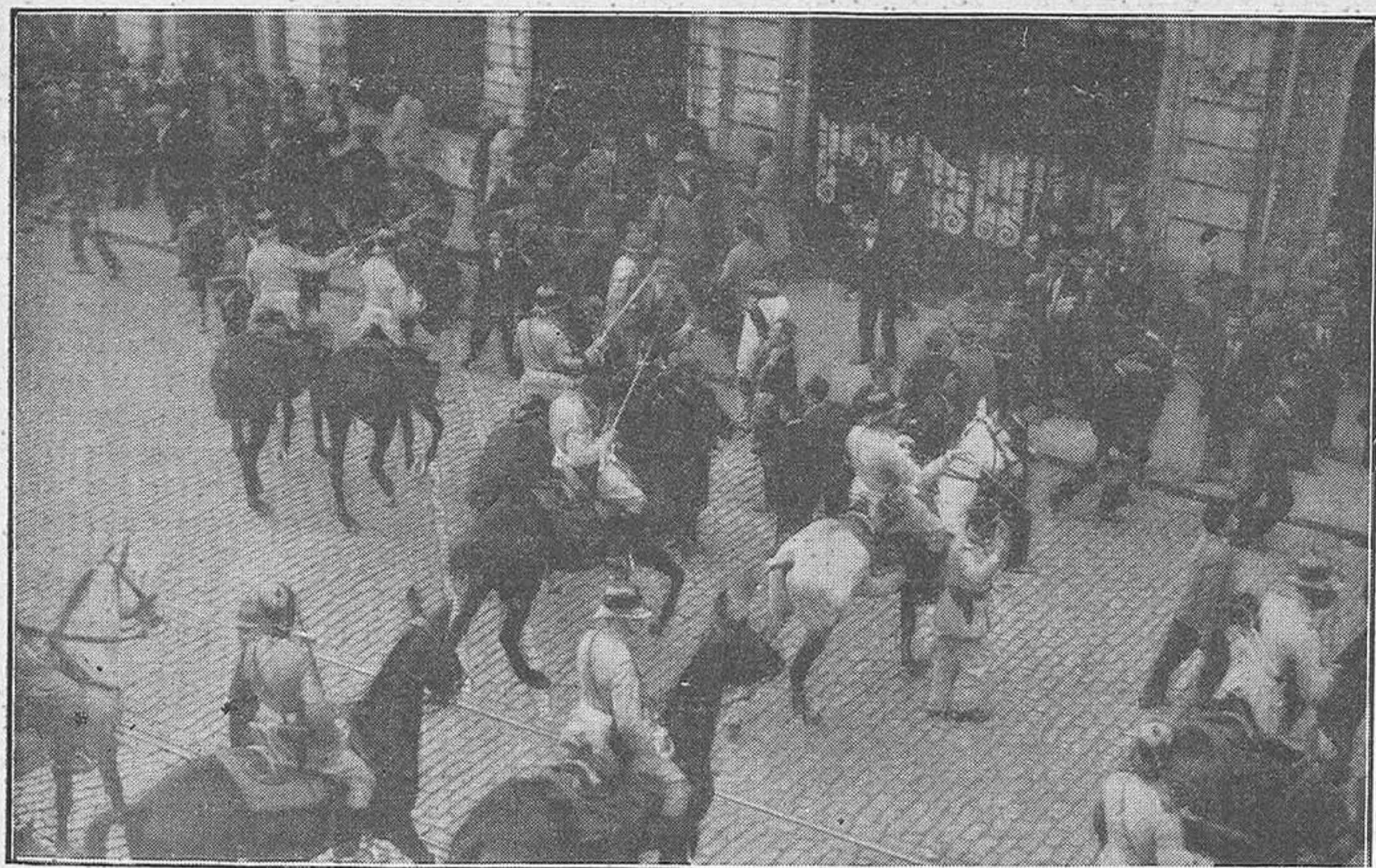
Una de las muchas cargas efectuadas por la Guardia Nacional Republicana contra las manifestaciones obreras del 1.º de mayo.

En la lucha a muerte empeñada ahora entre los hombres de la libertad y los hombres siniestros de la tiranía, estos cuatro nombres son la síntesis y el símbolo de la Barbarie y de la Iniquidad, las cuatro cabezas de la misma monstruosa Hidra.