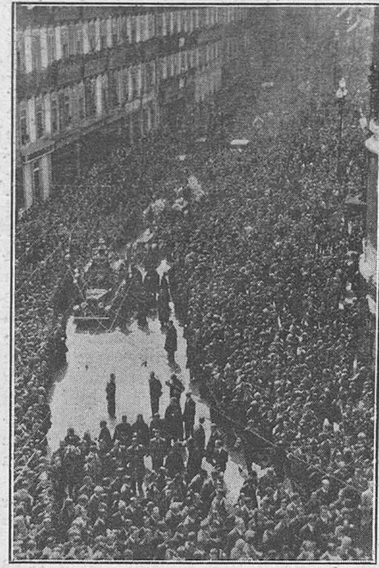
Un aspecto del entierro del estudiante muerto.

mana de los Calígula y los Caracalla; decir Cuba, Chile, Perú, la Argentina, la ferocidad tradicional de los tópicos. ¡Y