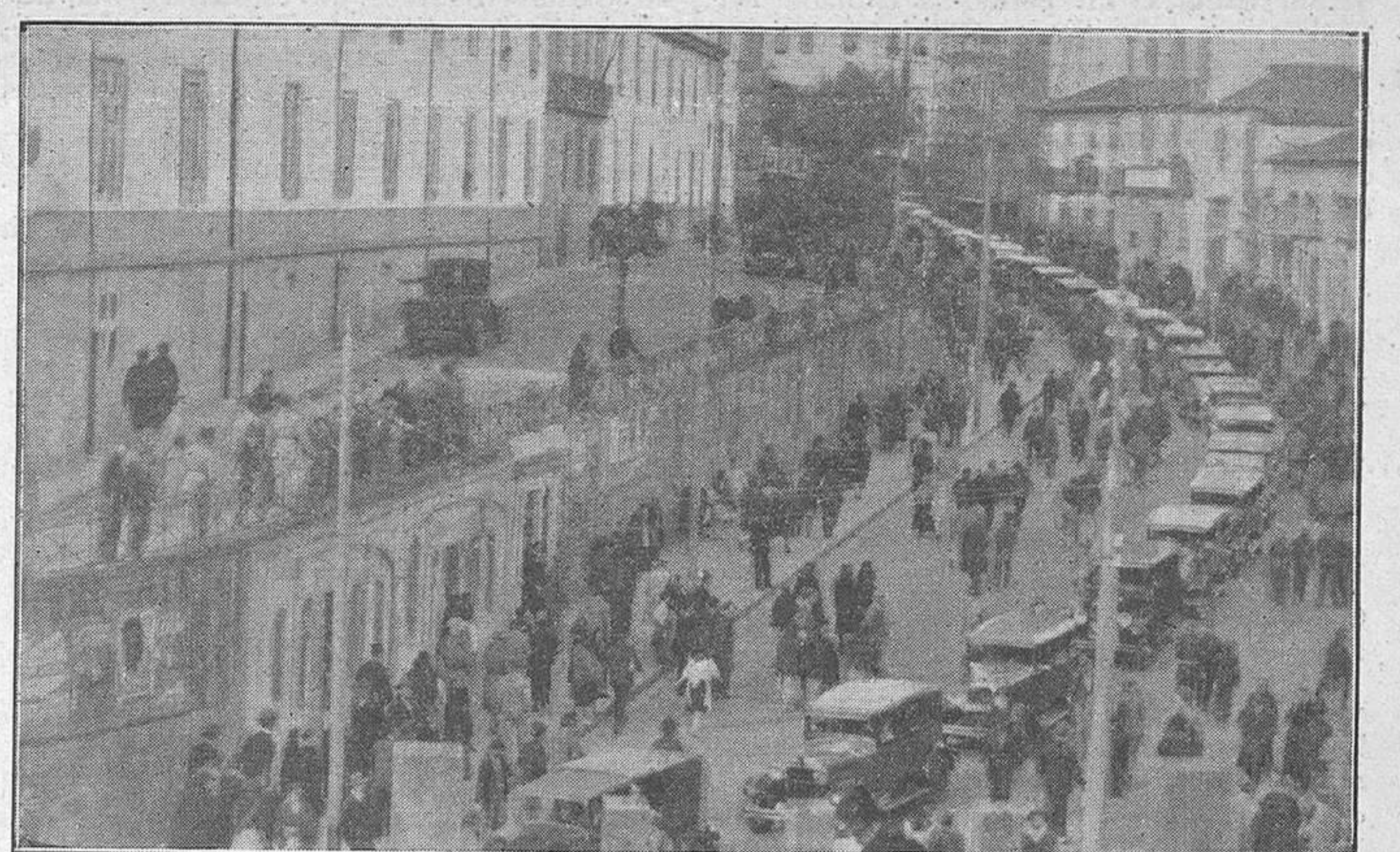
Desfile de automóviles, que acompañaron los restos del estudiante asesinado por la policía en la grandiosa manifestación de su entierro.

Se habla de obligar a los padres a que lleven sus hijos a la escuela hasta los catorce años. ¿Por qué permitir que los padres se estén en la taberna hasta las tantas de la noche?