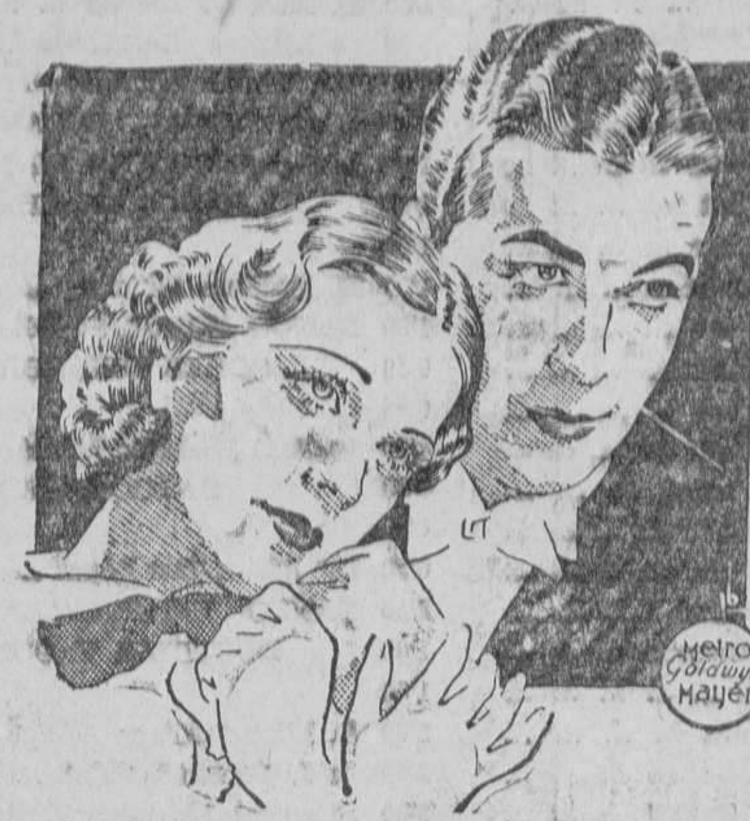
ELEANOR POWELL y ROBERT TAYLOR LA MAGNIFICA PAREJA DE LA SOBERBIA REVISTA DE LA METRO GOLDWYN MAYER («LA MELODIA DE BROADWAY») QUE SE ESTRENARA ESTA TEMPORADA EN NUESTRA CIUDAD, EN LOS SALONES DE LA AEMPRESA L. M. S.

Ronald Colman, el actor de rara simpatía y de más atrayente personalidad artística de la pantalla, es el principal protagonista de este film que, por las noticias que se reciben de su filmación, ha de constituir un sonado éxito.