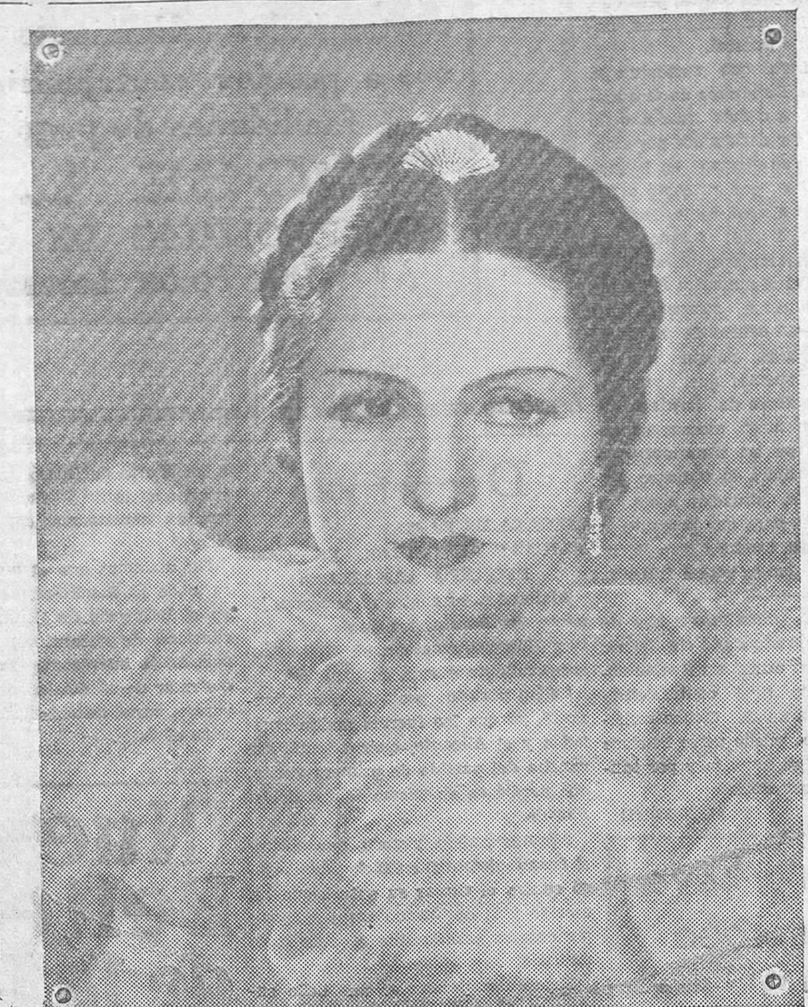
Simosarka, la bella actriz polaca, contratada recientemente por la Metro Goldwyn Mayer

Ministerio de Educación, Cultura y Deporte