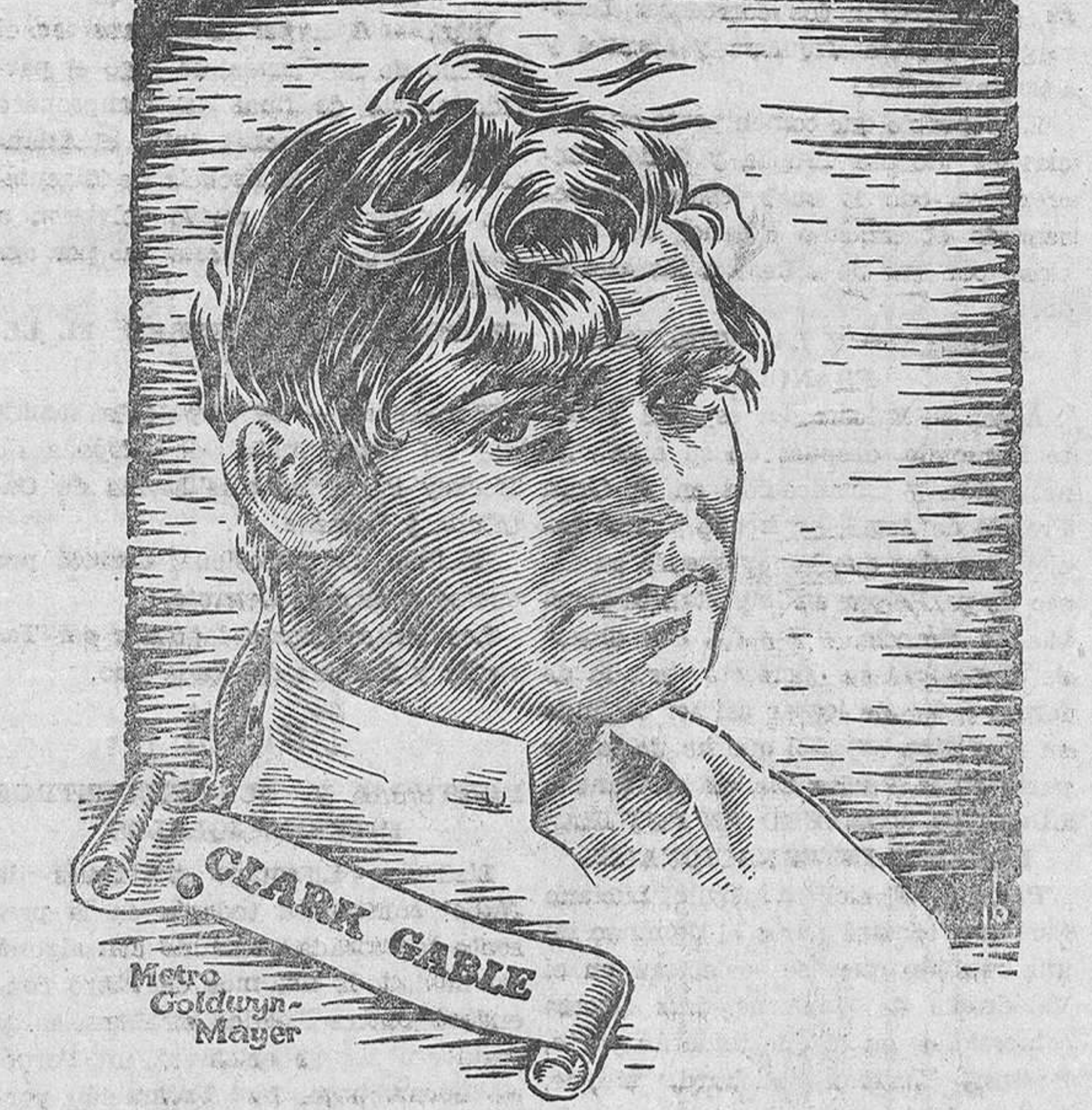
CLARK GABLE Metro-Goldwyn-Mayer

batalla de Trafalgar debían escribir fueran de fama consolidada si no también, actores de una sensibilidad y temperamento que se prestara a una perfecta adaptación a los difíciles papeles que se les tenía que confiar. Después de larga y laboriosa búsqueda, tres nombres fueron sometidos a la aprobación de los directivos de Metro-Goldwyn-Mayer mereciendo por parte de estos la más absoluta y unánime sanción: Clark Gable, la energía subyugante, Franchot Tone, la simpatía arrulladora y como oposición la figura destacada de Charles Laughton, ofreciéndonos un nuevo tipo, en soberbia creación artística, estimada por la crítica como su más perfecta interpretación. Allá por el año 17... zarpó la goleta «Bounty» de la Real Armada Inglesa, con rumbo a las Islas Polinésicas, en