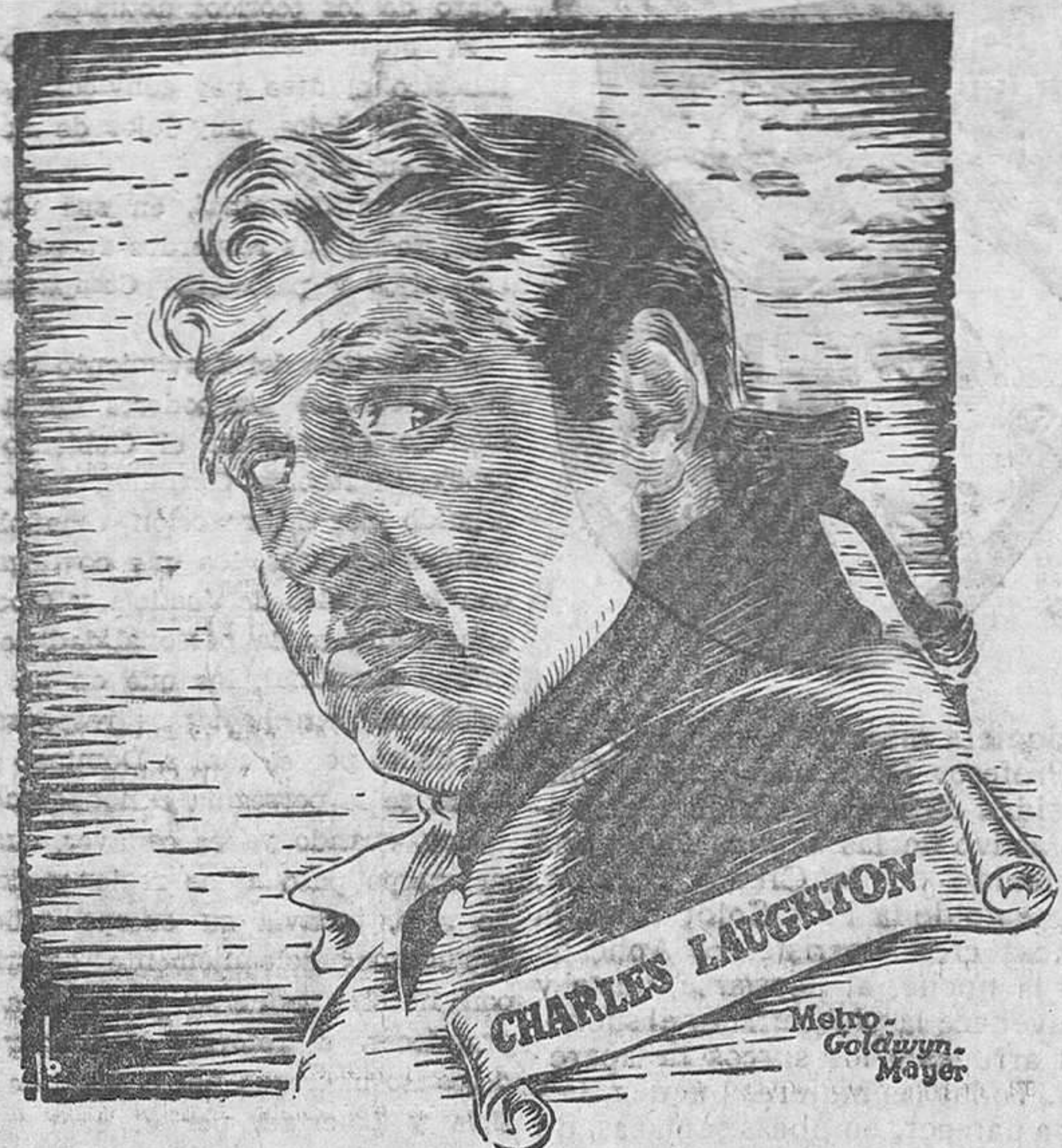
CHARLES LAUGHTON Metro-Goldwyn-Mayer

La producción cinematográfica ha llegado ya a un nivel de perfección técnica y artística tan superior, y en especial, en los estudios de Hollywood que el crear una obra que pueda y logre destacarse entre las muchas y muchas cintas excelentes que sin interrupción van presentándose, puede considerarse como esfuerzo de titán. Cada año tienen lugar varias y rigurosas selecciones, tamizadas por equánimes y severos concursos que organizan revistas técnicas o entidades especializadas y así se premian indistintamente los mejores films y directores y los más destacados artistas cuyas interpretaciones hayan logrado svanzar con mayor éxito por el camino glorioso de la perfección.