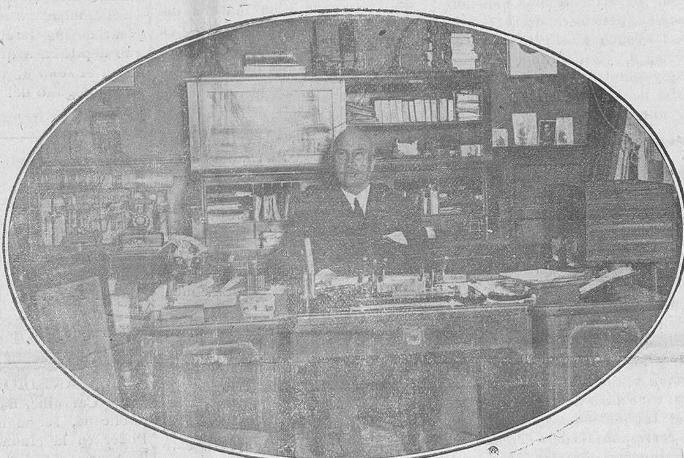
Don Alejandro Lerroux, el prohombre del radicalismo, en su despacho.

IZQUIERDA, por el exceso de sus originales se reserva el derecho de retrasar la inserción de todo lo que tenga carácter publicitario y haya de pasar por sus oficinas administrativas. De tal guisa, advertimos a nuestros favorecedores que sólo se le enviará los números en que aparezca sus anuncios.