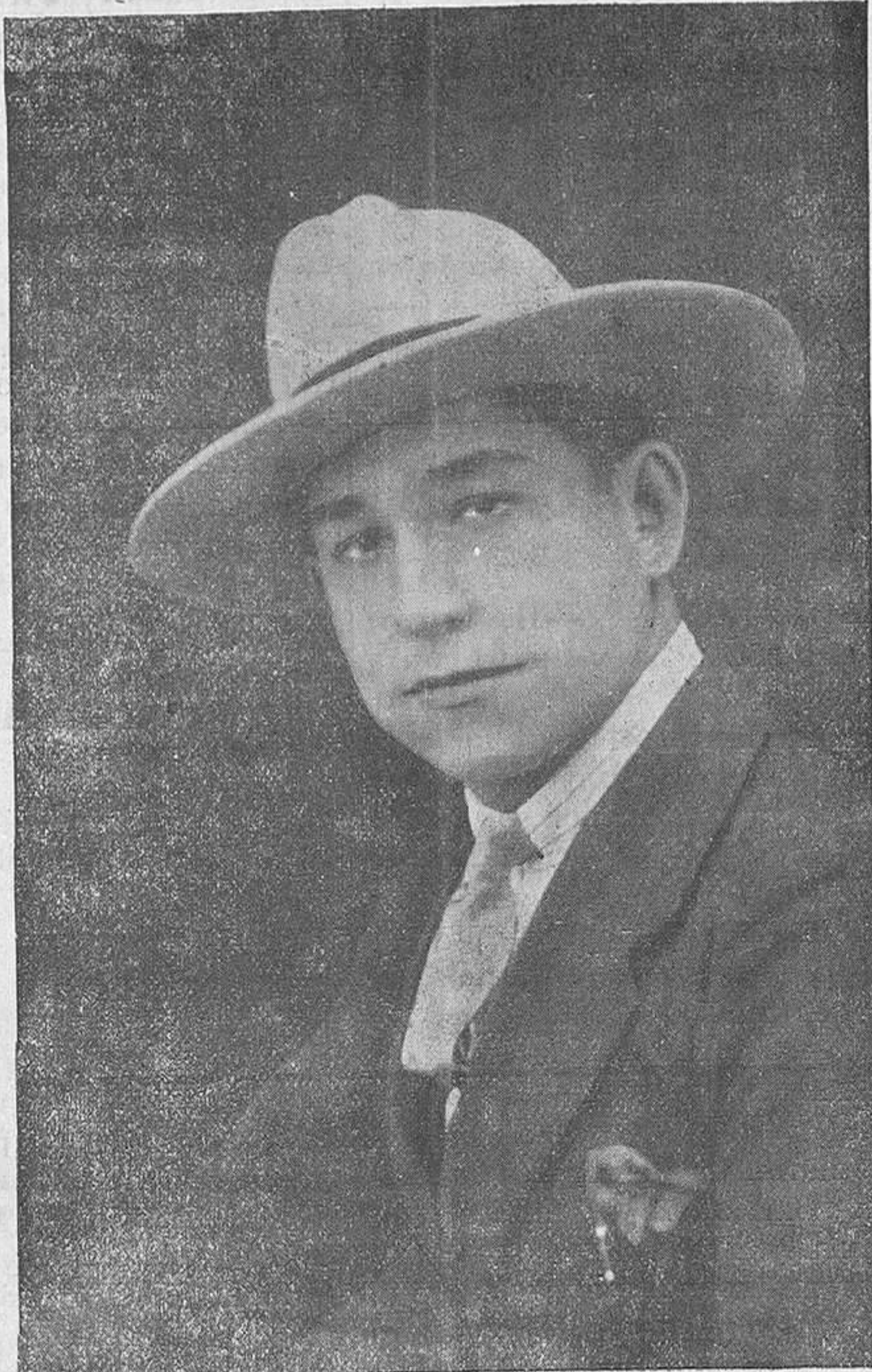
Madridiño. El formidable torero de ayer, desnudado por un toro en la plaza de Madrid. ¡Valiente es el muchacho!

Quinto. «Sotana, negro lombardo. ¡Estas cosas de «sotanas» no gustan a los lectores de IZQUIERDA!... Pero el bichejo, saltando por los fueros talares en esta época de la separación de la Iglesia y el Estado, quiso darnos a entender que eso de la separación no está bien; que un «sota-