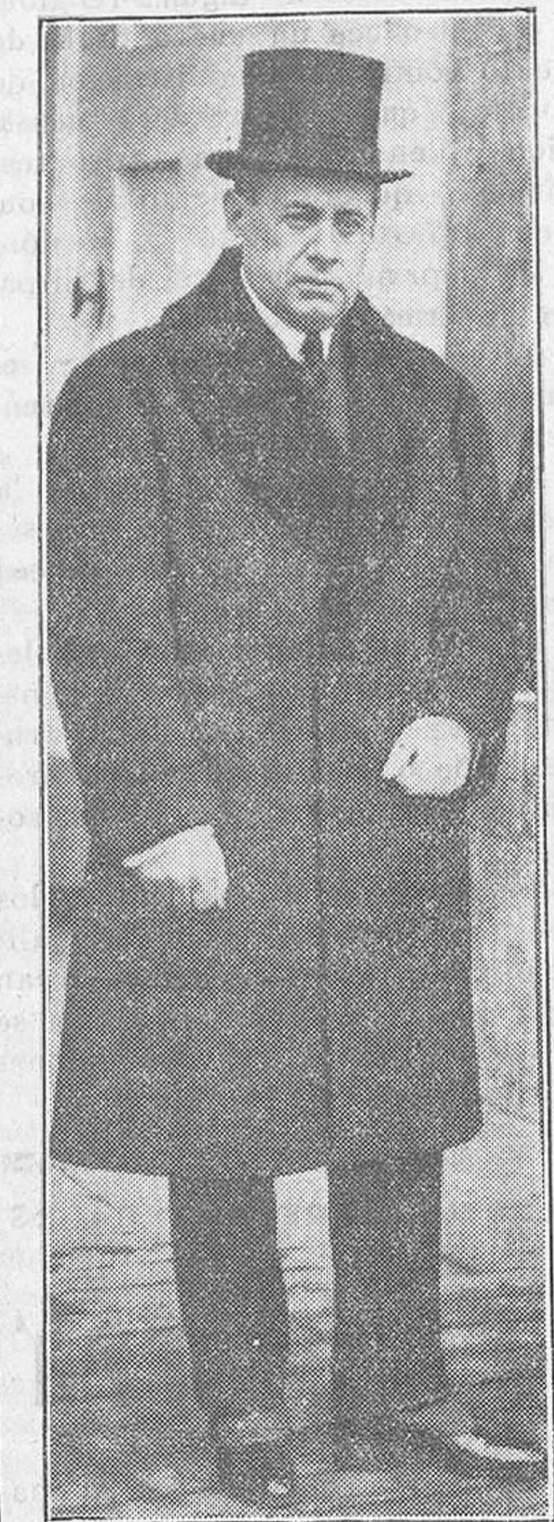
El Excmo. Sr. Embajador de la República de Cuba.

contener nuestra alegría, le interrogamos. —Verdad. ¡Don Niceto Alcalá Zamora...! Su Excelencia el señor Presidente de la República española, es una mentalidad. ¿Y qué me dicen ustedes del señor presidente del Consejo de ministros?