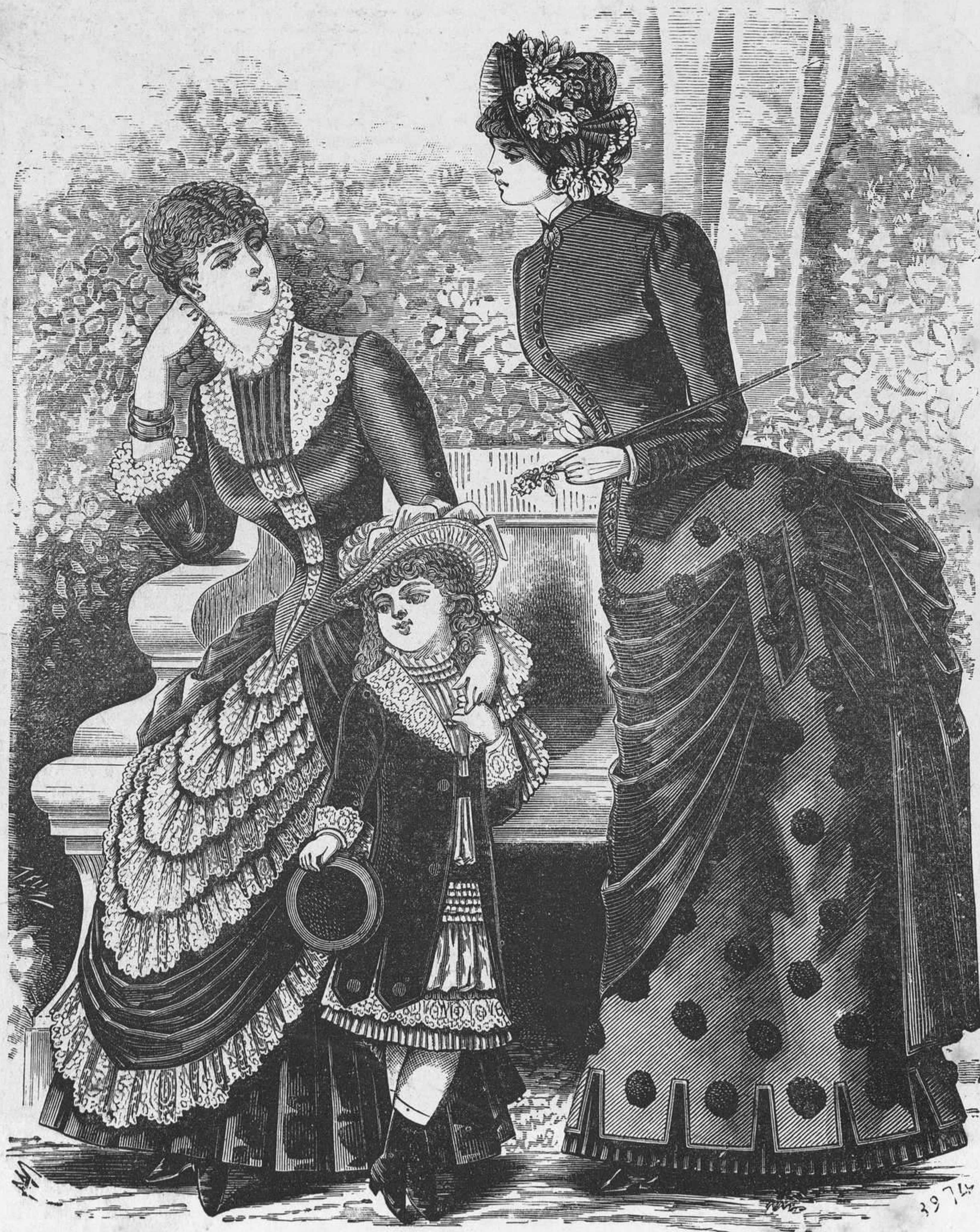
1, 2 y 3.—Trajes de paseo.

Esta, mis queridas lectoras, es una de tantas manifestaciones