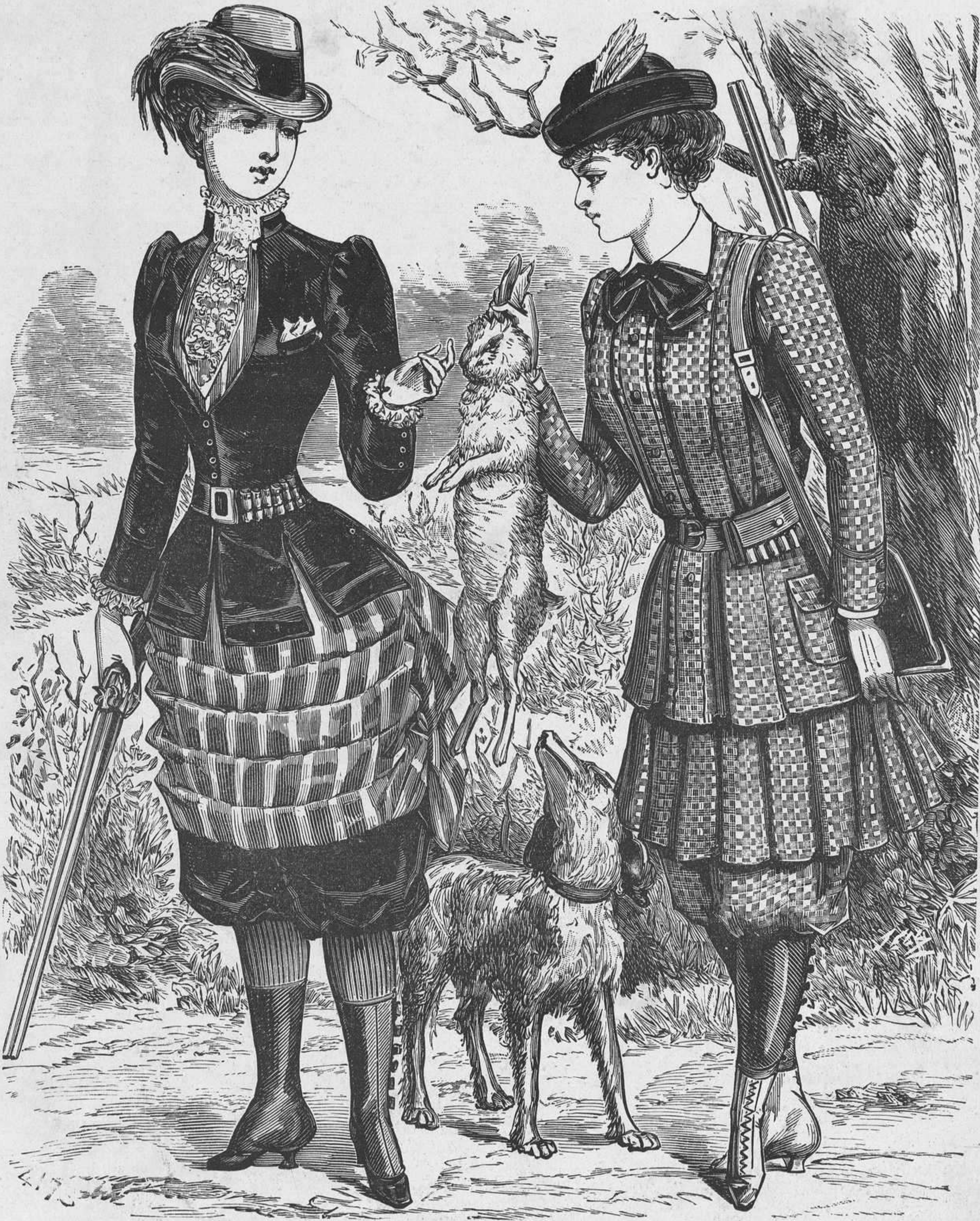
17 y 18.—Trajes de caza.

Barcelona: Imp. de Luis Tasso, Arco del Teatro, núms. 21 y 23.