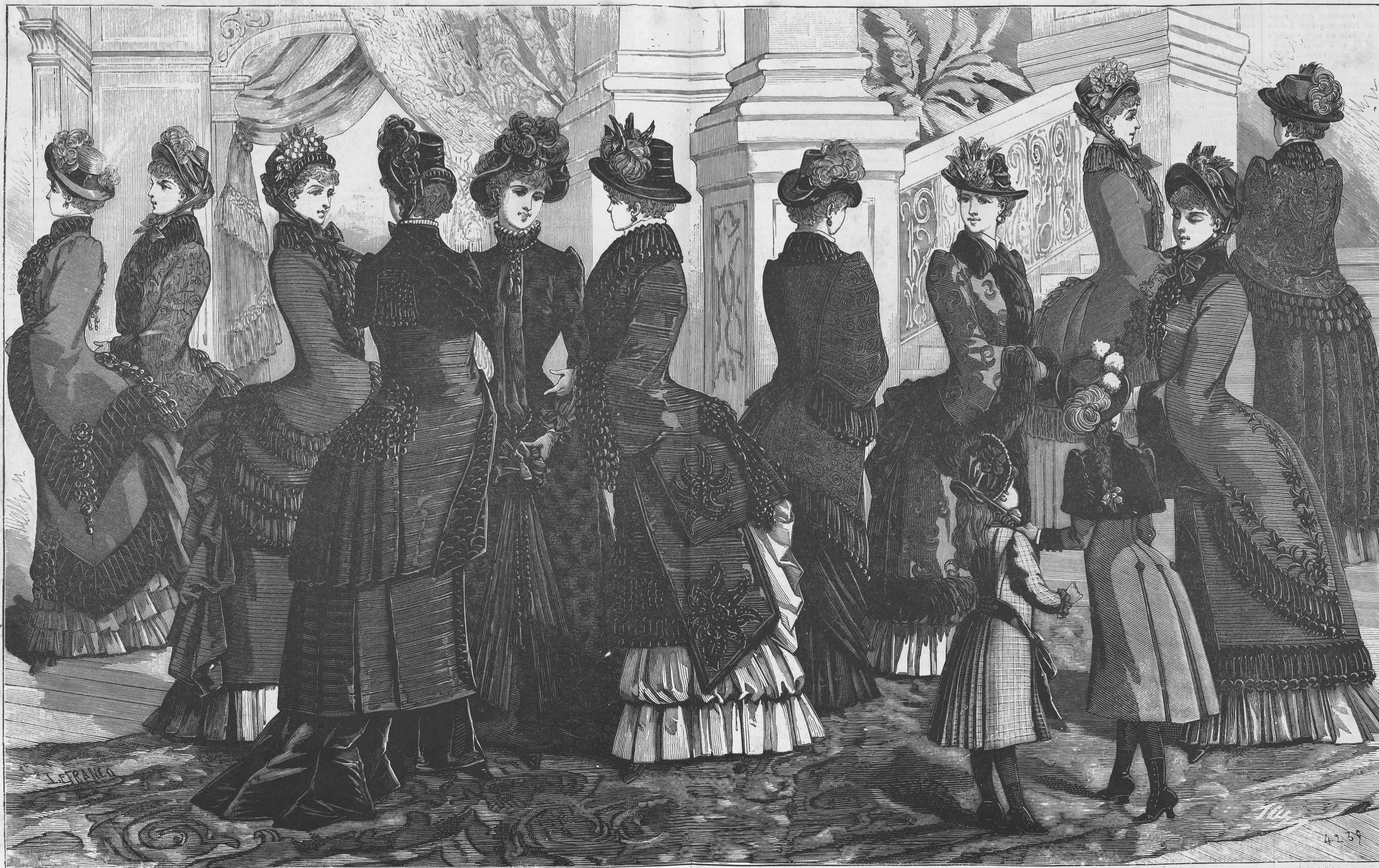
4 á 16.—Gran plana de trajes y abrigos de invierno.