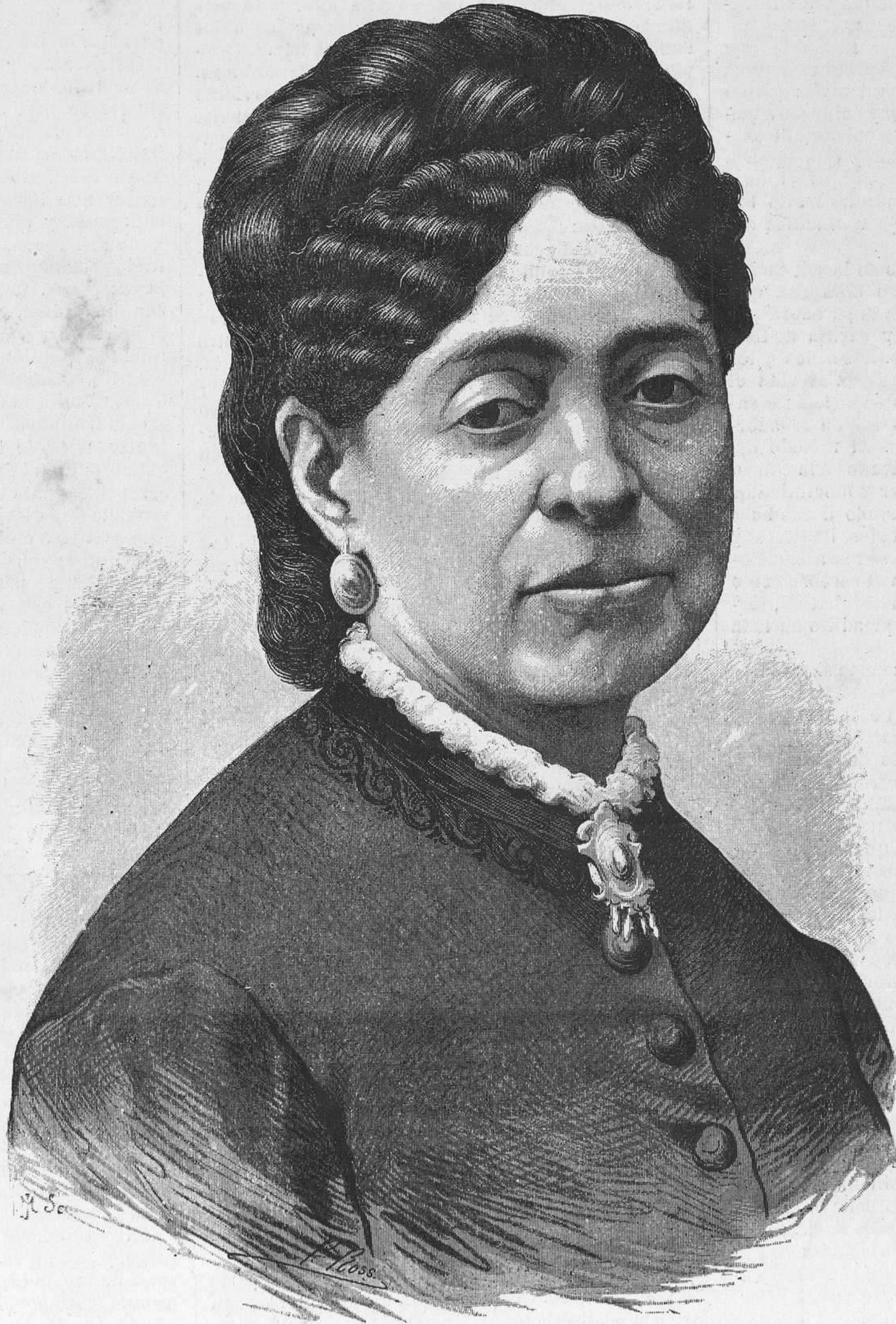
ANGELA GRASSI, dibujo original de Paciano Ross.