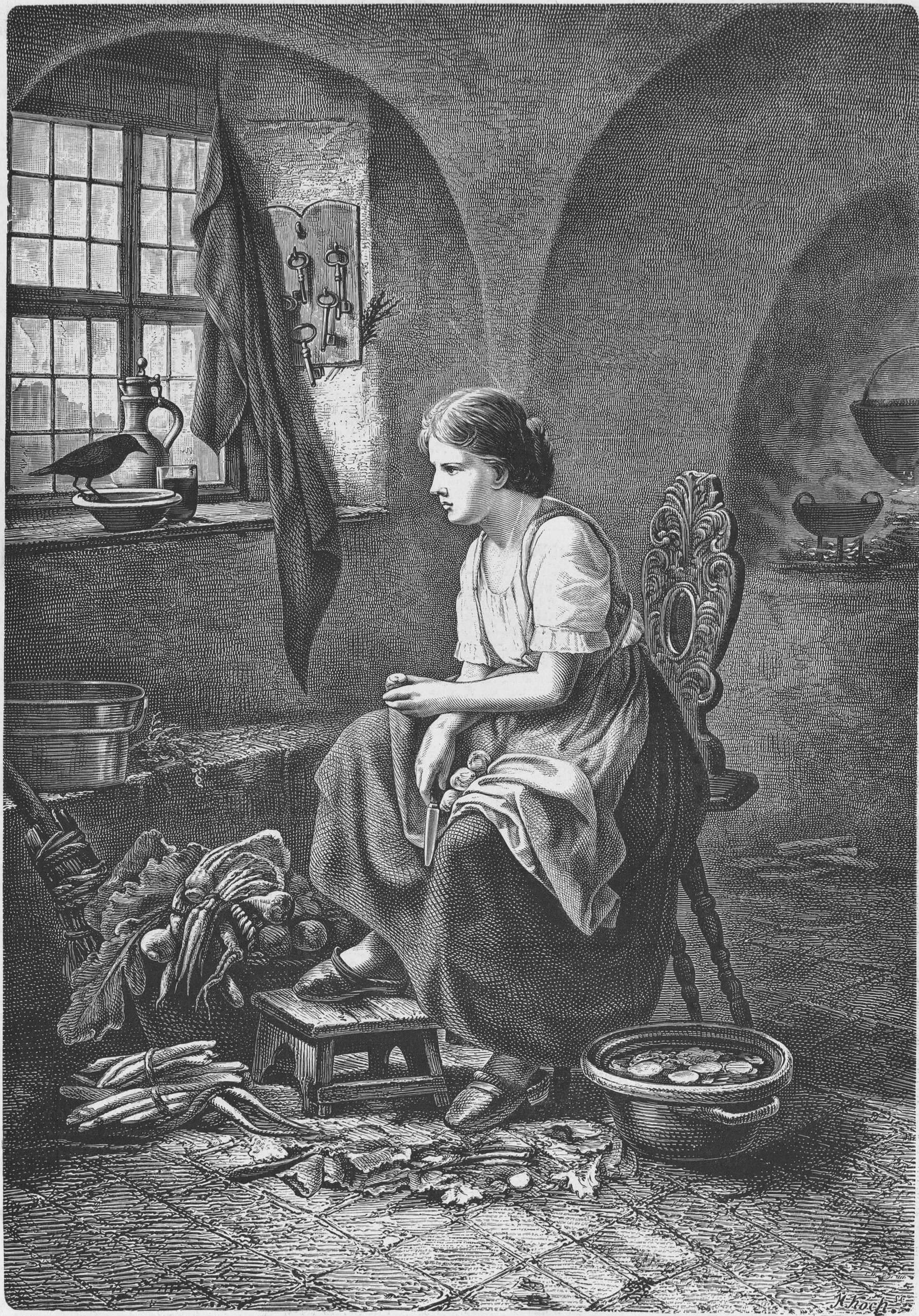
COLOQUIO, cuadro de Antonia Boltmar.