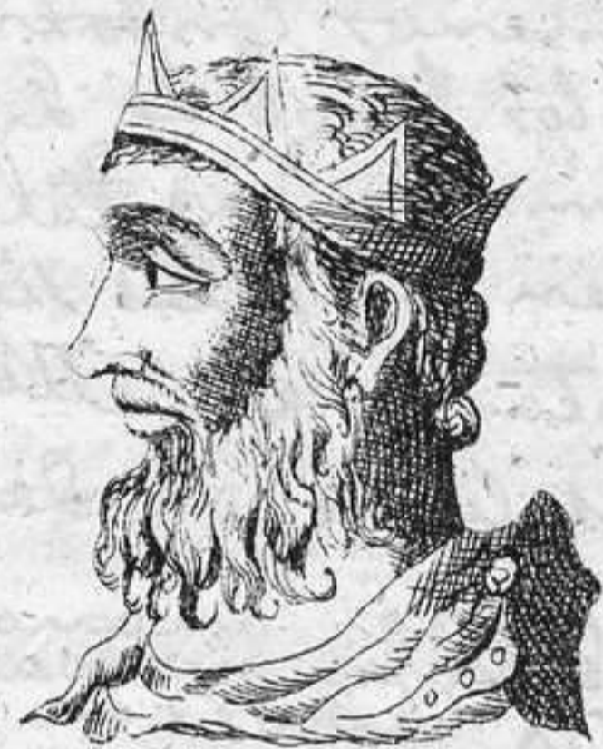
Tarquino el Soberbio. 7.º Rey de R.º

pero no mejor. Dos partes comprende lo que en el hombre se llama razon: la aprensiva que conoce lo verdadero; y la apetitiva que sigue lo bueno. Las ciencias, aunque sublimes, perfeccionan solamente la primera; mas las virtudes morales perfeccionan a un tiempo, la una con la prudencia, y la otra con las demas virtudes. La virtud moral es, pues, un habito electivo en la potencia apetitiva el cual dispone al hombre para obrar cosas honestas, segun el dictamen de la prudencia.