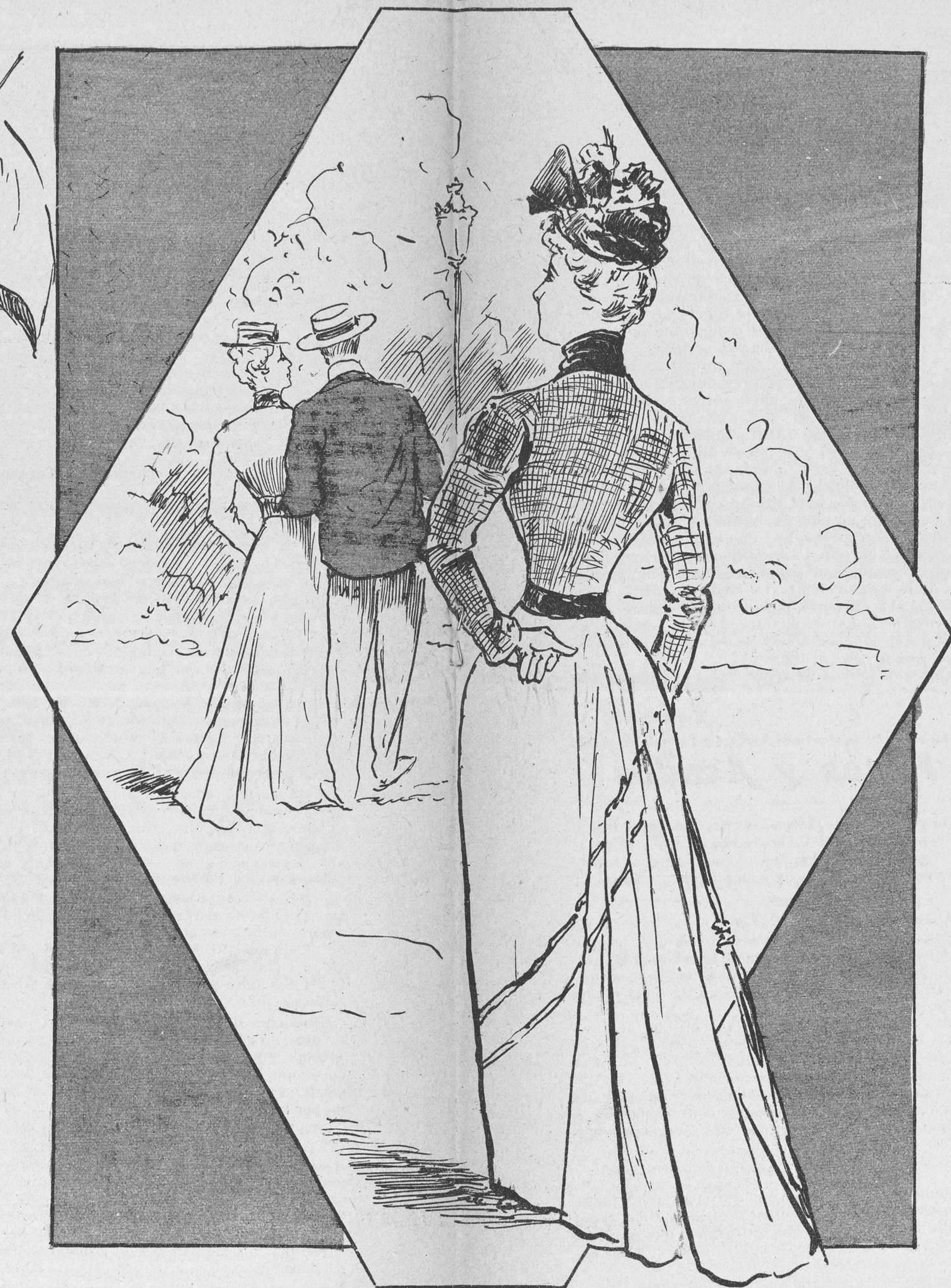
—Si me gusta mi marido es por lo listo, qué pronto se toma el desquite.