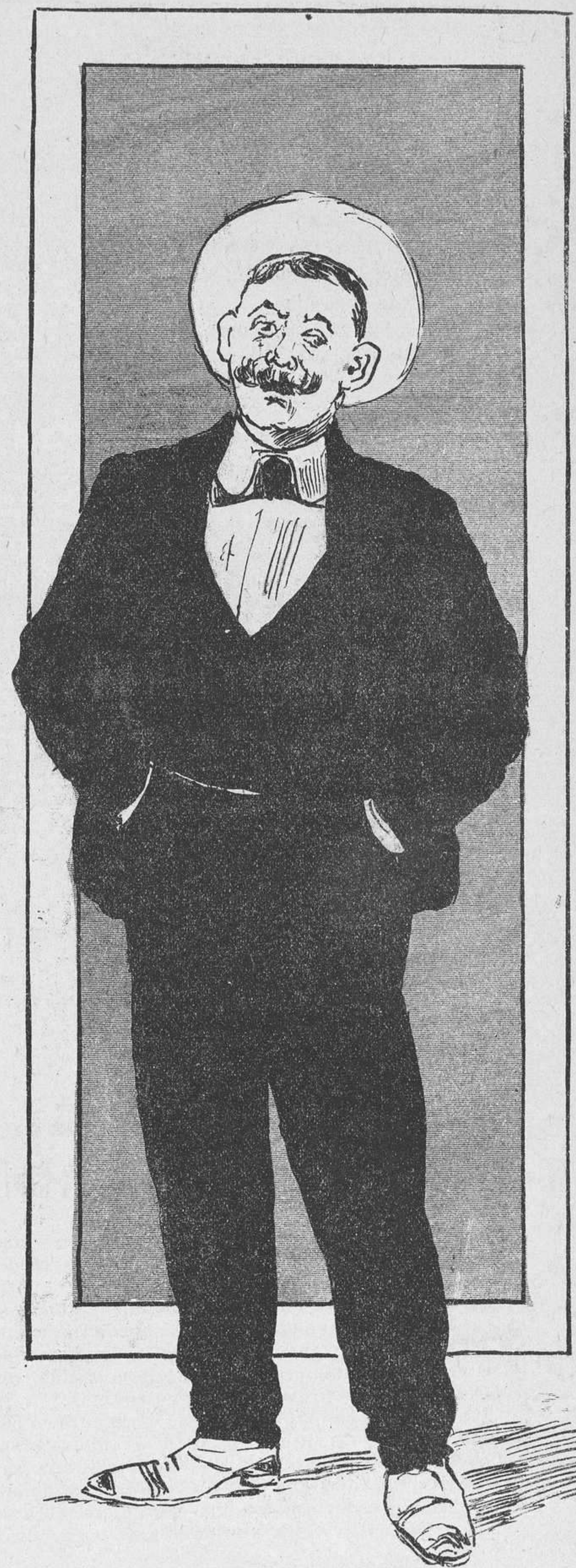
—¡Miren Vds. que es desgracia! Viudo y sin niños, gustándome tanto las niñas.