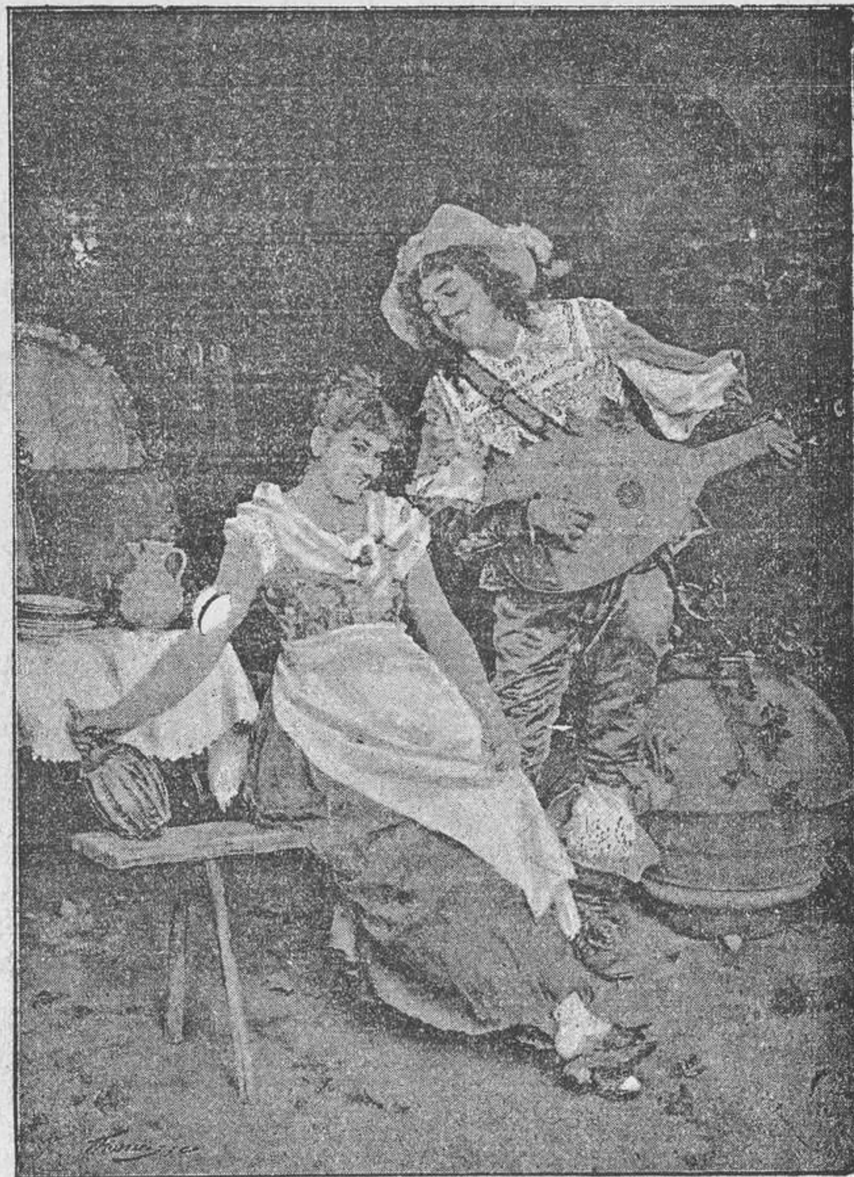
El Tenorio de la Taberna