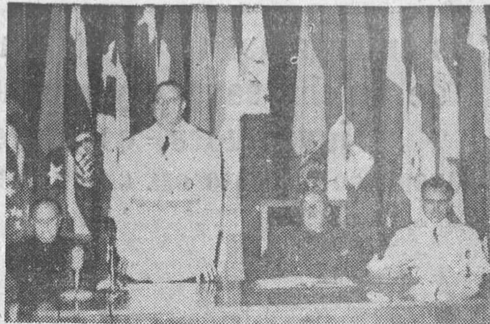
Un momento del discurso del señor Martín Artajo en el acto del Colegio de Nuestra Señora de Guadalupe