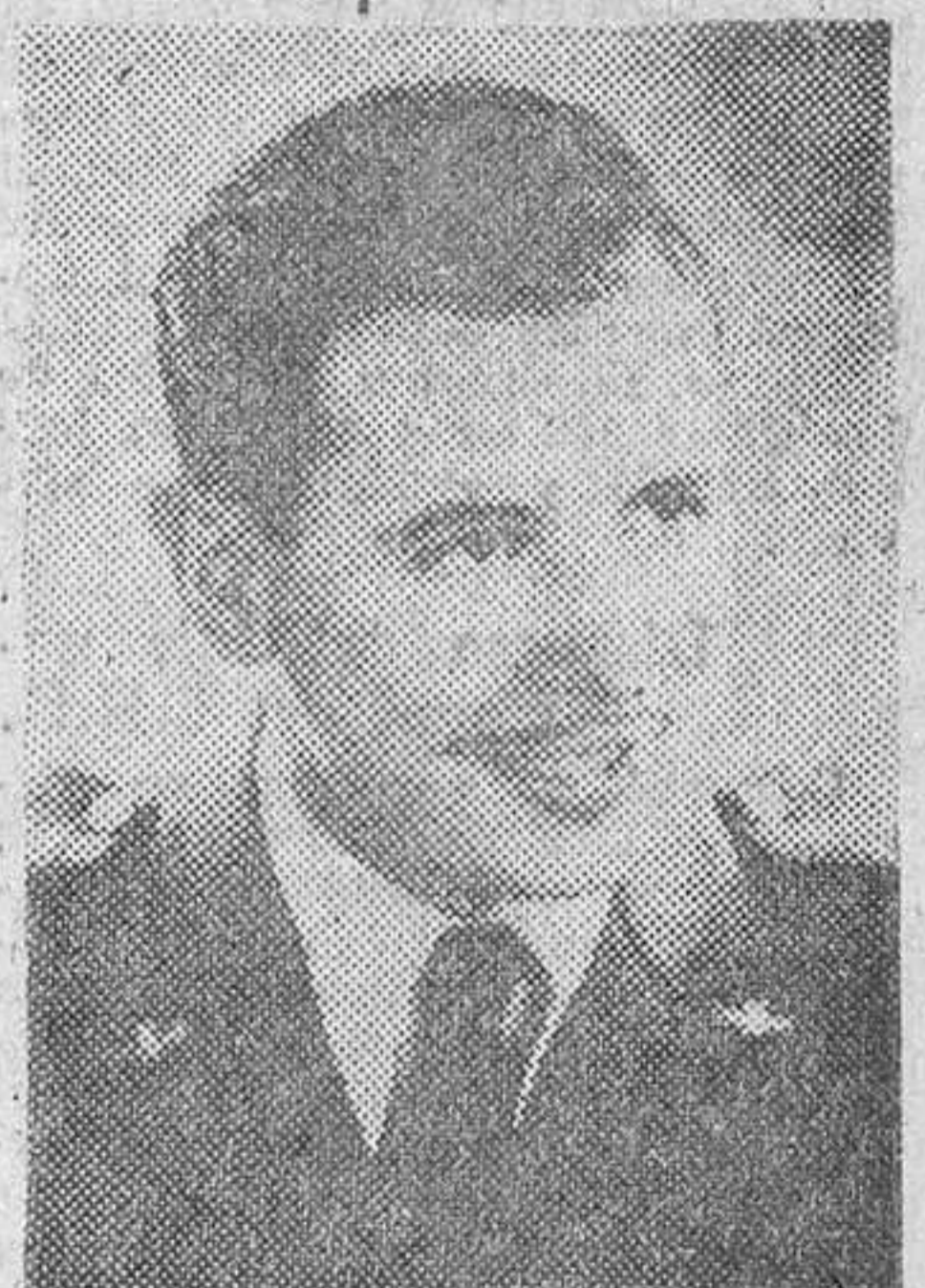
El Comandante don Demetrio Zorita Alonso, primer piloto aviador español que ha traspasado la barrera del sonido, volando en un «Mystere II», en el campo de Margnane (Marsella)