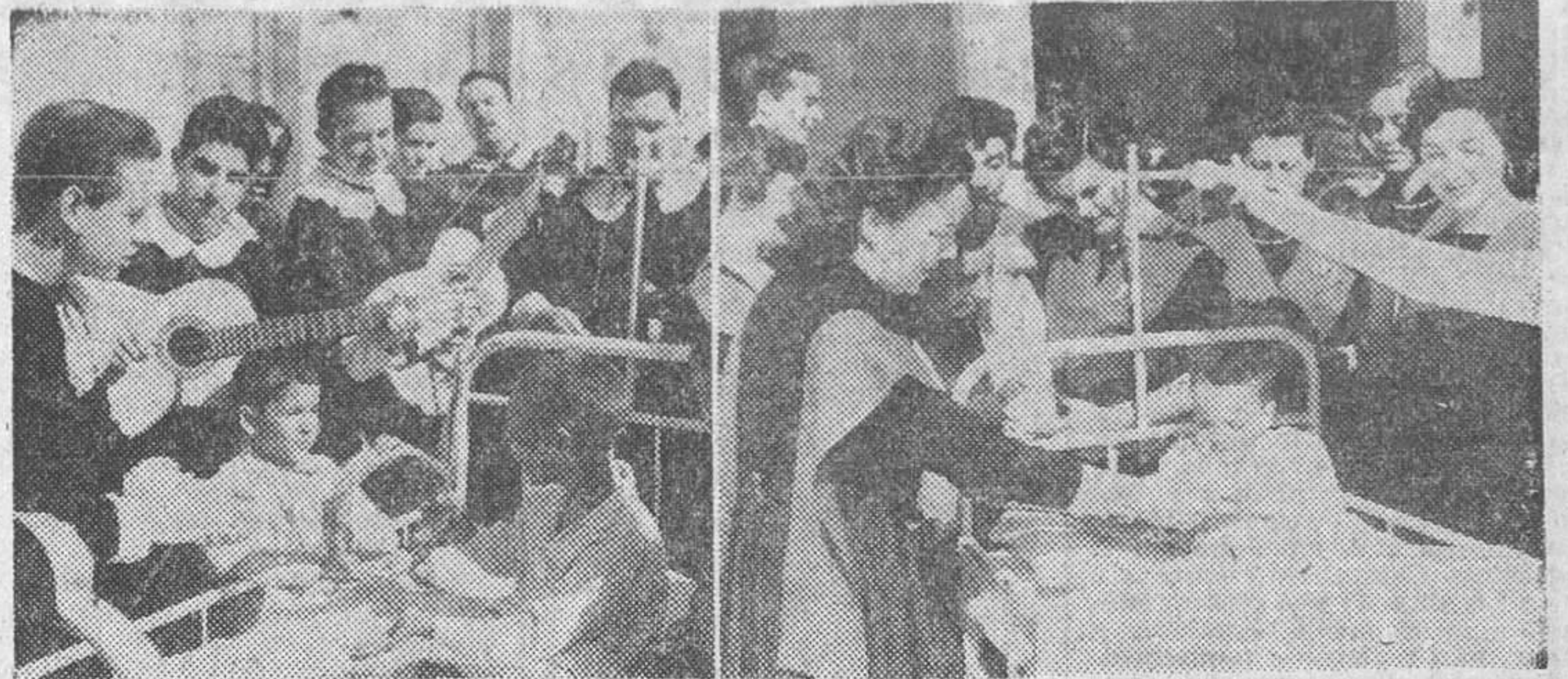
Las Juventudes Universitarias honraron ayer a su Patrón, Santo Tomás de Aquino, celebrando varios actos, entre los que figuró uno muy simpático, que se reproduce aquí: el concierto que las agrupaciones corales estudiantiles del S. E. U. dieron en el Asilo-Hospital de San Juan de Dios, proporcionando a los pequeños enfermos un inolvidable espectáculo, en el que la alegría y el buen humor se hermanaron con un hermoso espíritu de caridad.