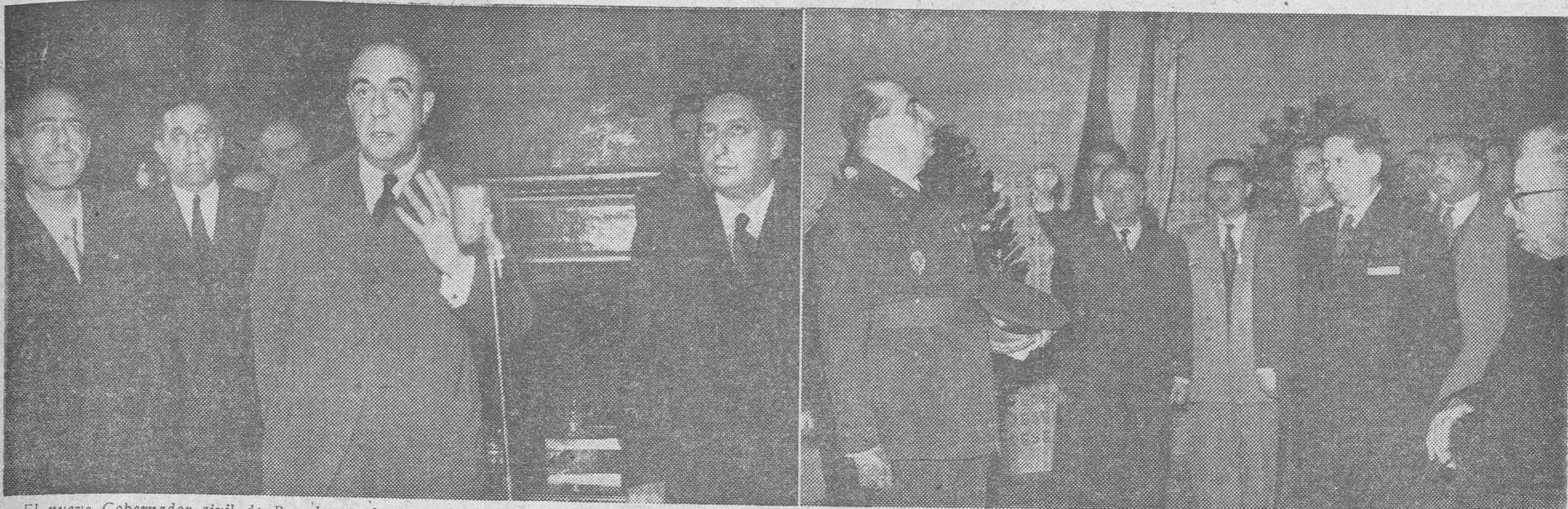
El nuevo Gobernador civil de Barcelona, al tomar posesión de su cargo. — Don Felipe Acedo, durante su visita a la Cripta de los Caídos de la Jefatura Provincial del Movimiento

Año XXVI - Número 629 - 10 páginas 19 de marzo de 1951 - Precio: 70 céntimos