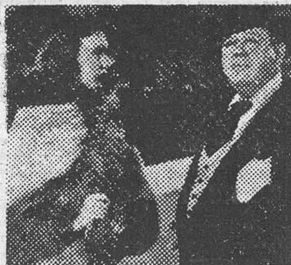
Diana Durbin y Charles Laughton en una escena de su primera noche, que se proyecta en el cine Fantasio

W. Holden - M. O'Driscoll, en JUVENTUD AMBICIOSA (Ambas en continuación de estreno y salón exclusivo)