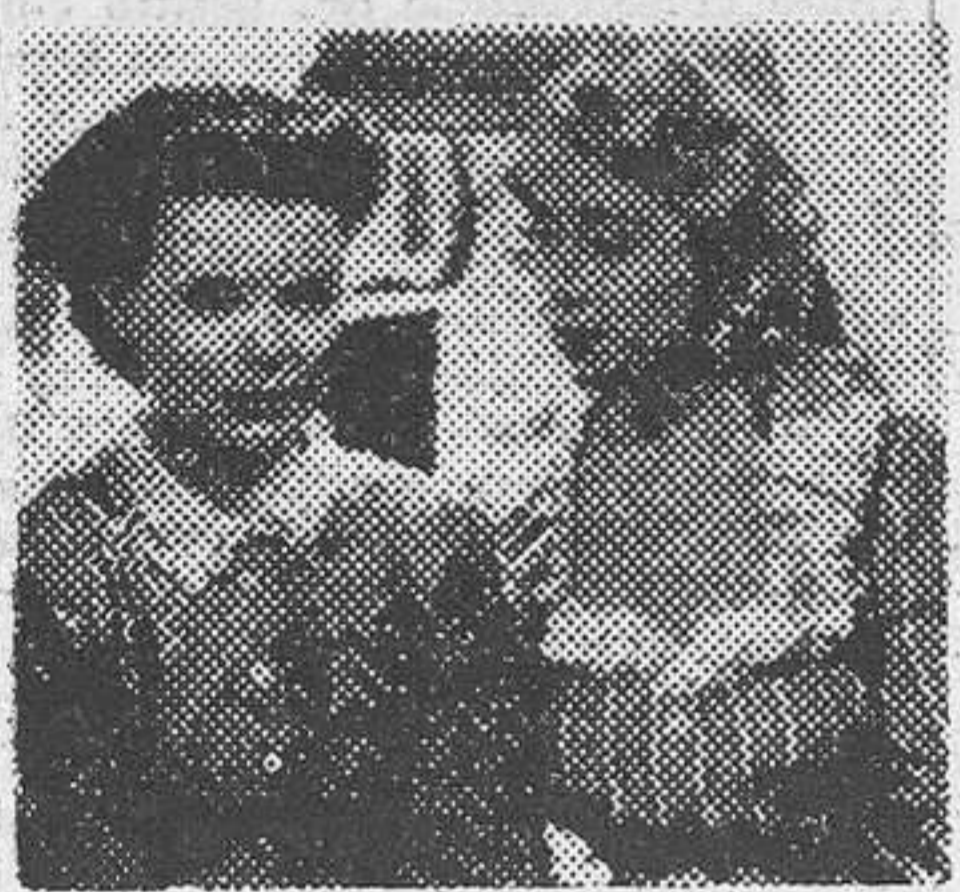
Dorothy Mac Guire y Joan Blondell en un interesante fotograma de Lazos humanos, que hoy se estrena en los salones Capitolio y Metrópoli

Hoy, en el Capitolio y Metrópoli, la Fox presentará una de las más interesantes películas de la presente