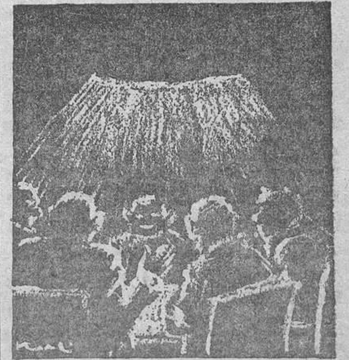
— Se trata de repartirnos las carteras españolas. — ¡Anda! ¡Pero si nós las trajimos todas! (De Arriba)