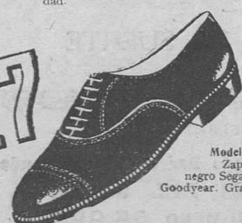
Modelo 2501.—Zapato charol negro Segarra. Cosido Goodyear. Gran vestir.