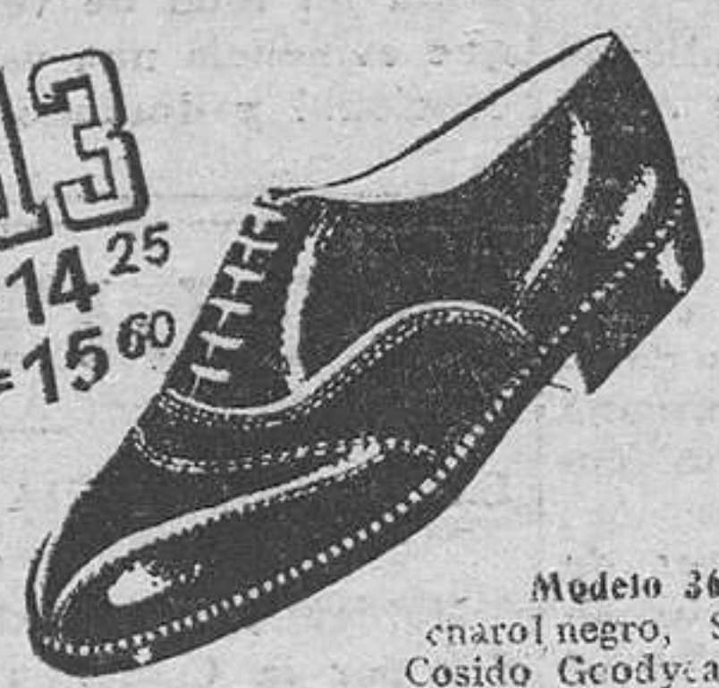
Modelo 3607.—Zapato charol negro, Segarra. Cosido Goodyear, muy elegante. (Tenemos el mismo en box-calf color).