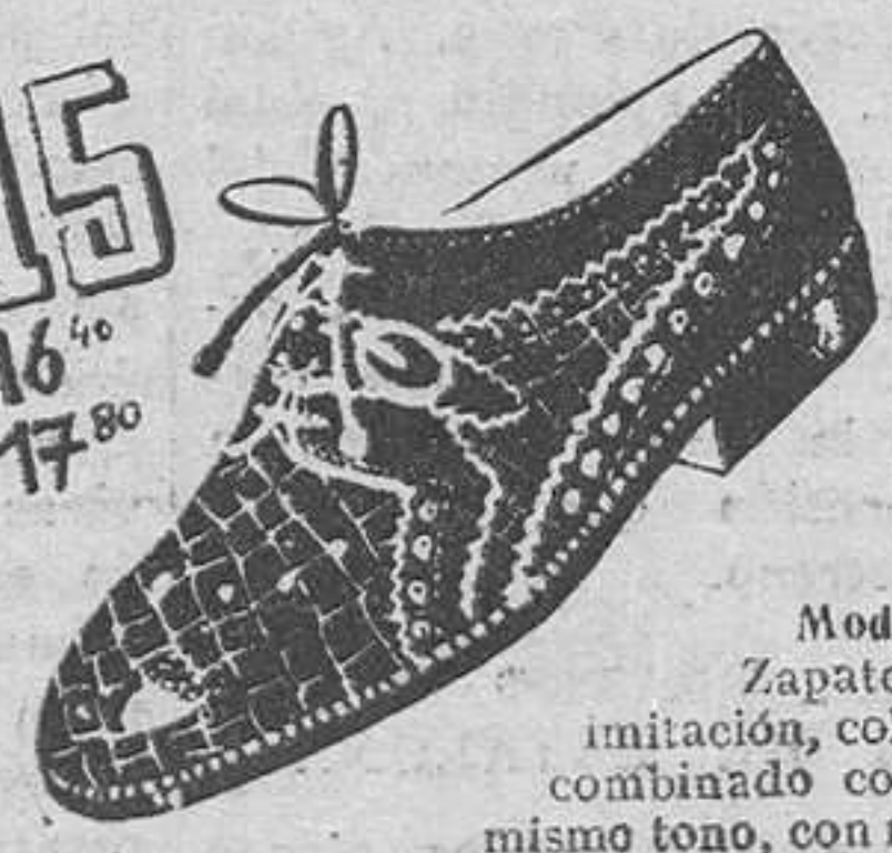
Modelo 3500.—Zapato cocodrilo imitación, color marrón, combinado con box-calf mismo tono, con robloncillos metal. Mucha moda. Cosido Goodyear. (Tenemos el mismo con piso de goma.)