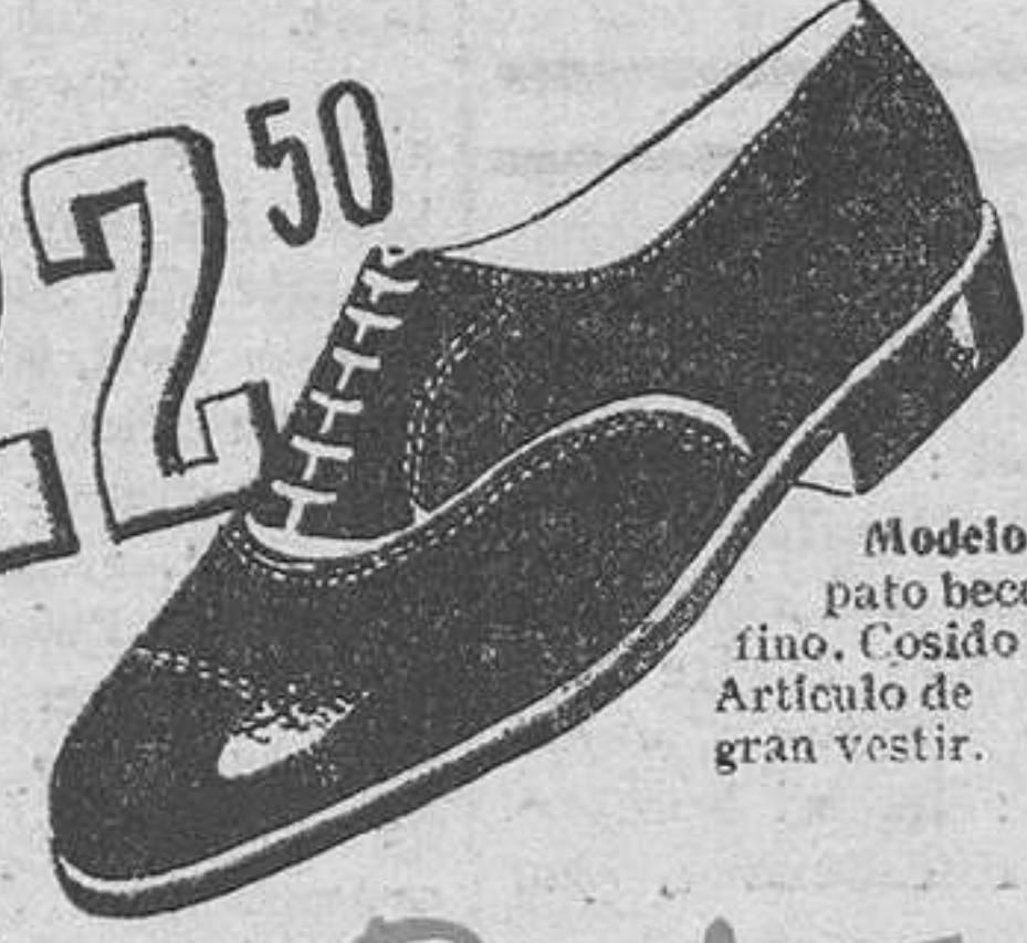
Modelo 511.—Za-pato becerrito, muy fino. Cosido Goodyear. Artículo de gran vestir.