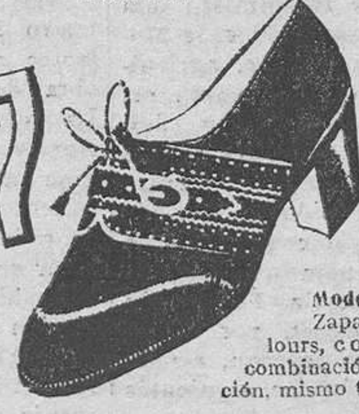
Modelo 3934.—Zapato export ve-lours, color azul ma-ino, combinación lagarto, imita-ción, mismo tono, tacón suela 4 cm. Cosido Goodyear. Última creación Segarra.