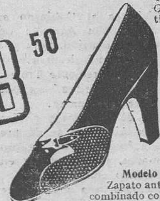
Modelo 4116.—Zapato ante negro, combinado con fanta-sia «mil puntos». Broche metal, mucha moda, tacón 5 cm., sbouttiers. Cosi-do Littleway.