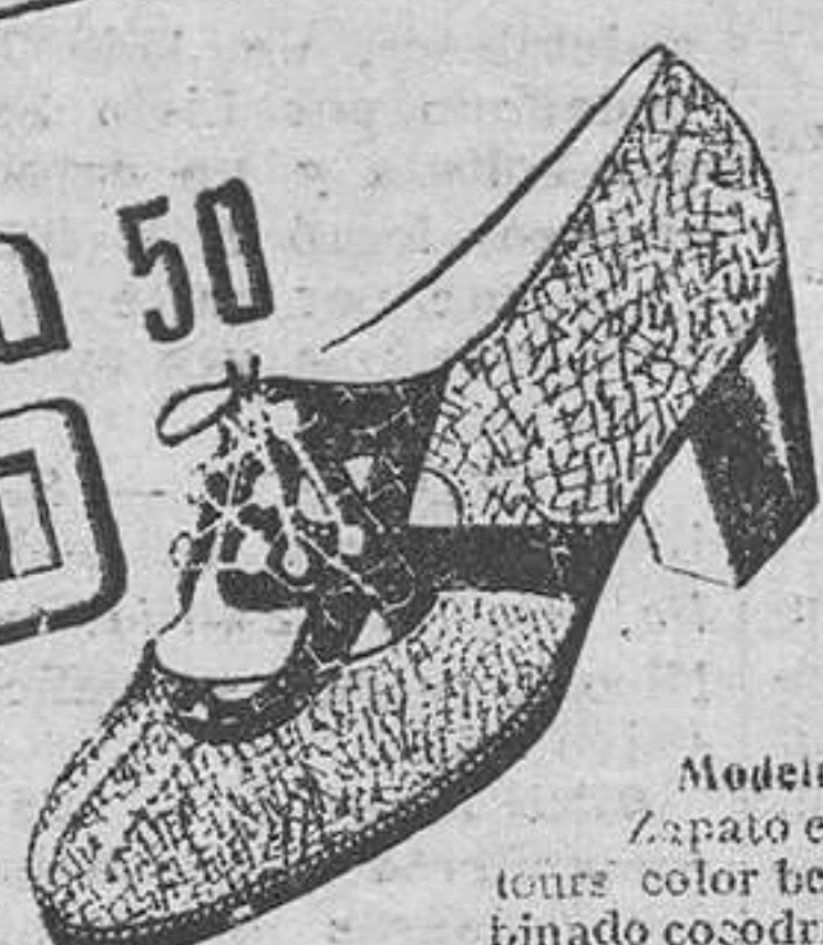
Modelo 3932.—Zapato export ve-tours color beige, com-binado cocodrilo imita-ción, color marrón. Tacón suela de 4 cm. Gran moda.