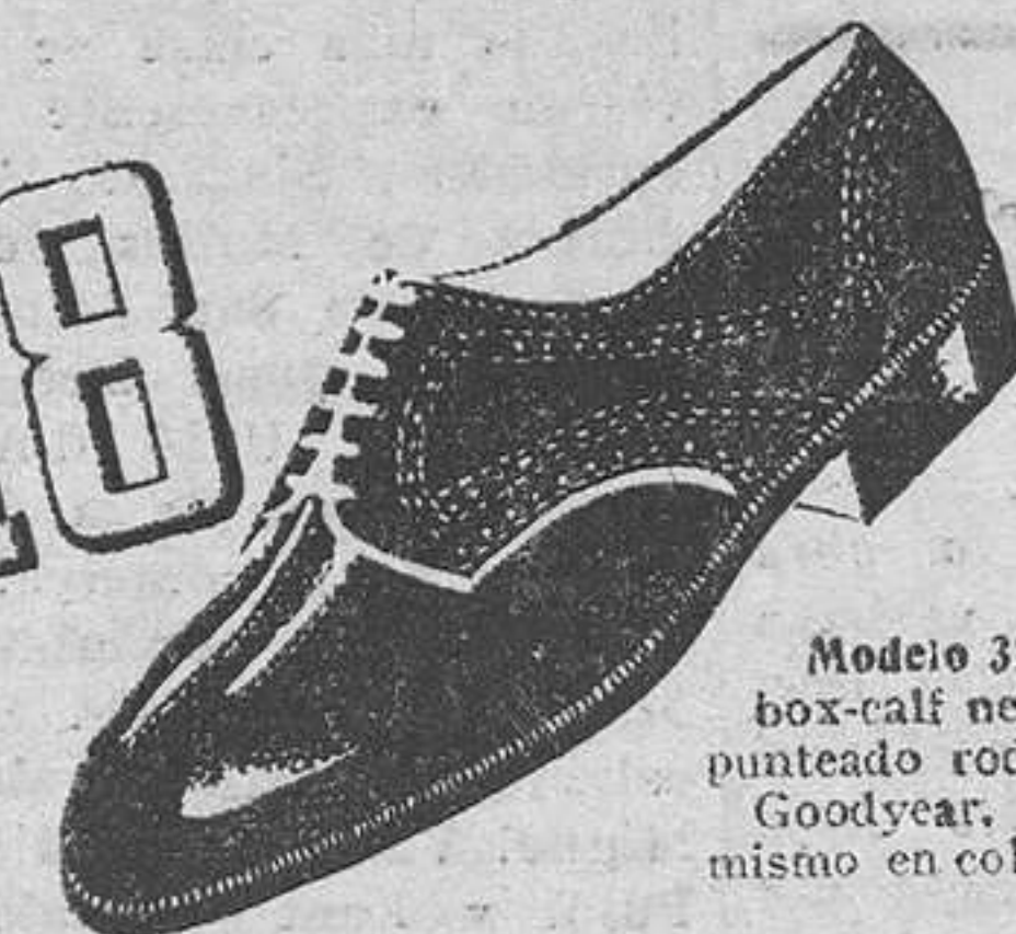
Modelo 3225.—Zapato box-calf negro, Segarra, punteado rodado. Cosido Goodyear. (Tenemos el mismo en color).