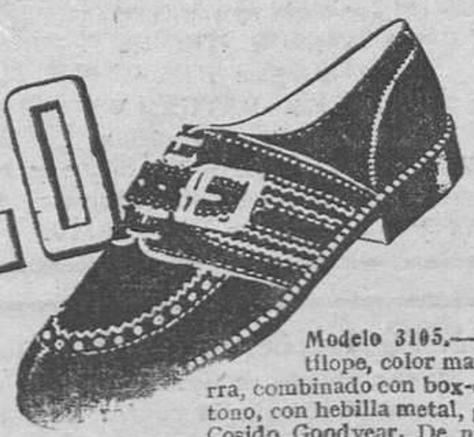
Modelo 3105.—Zapato antilope, color marrón, Segarra, combinado con box-calf mismo tono, con hebilla metal, gran moda. Cosido Goodyear. De nuestras recientes creaciones.

Para las personas de gusto el calzado de calidad