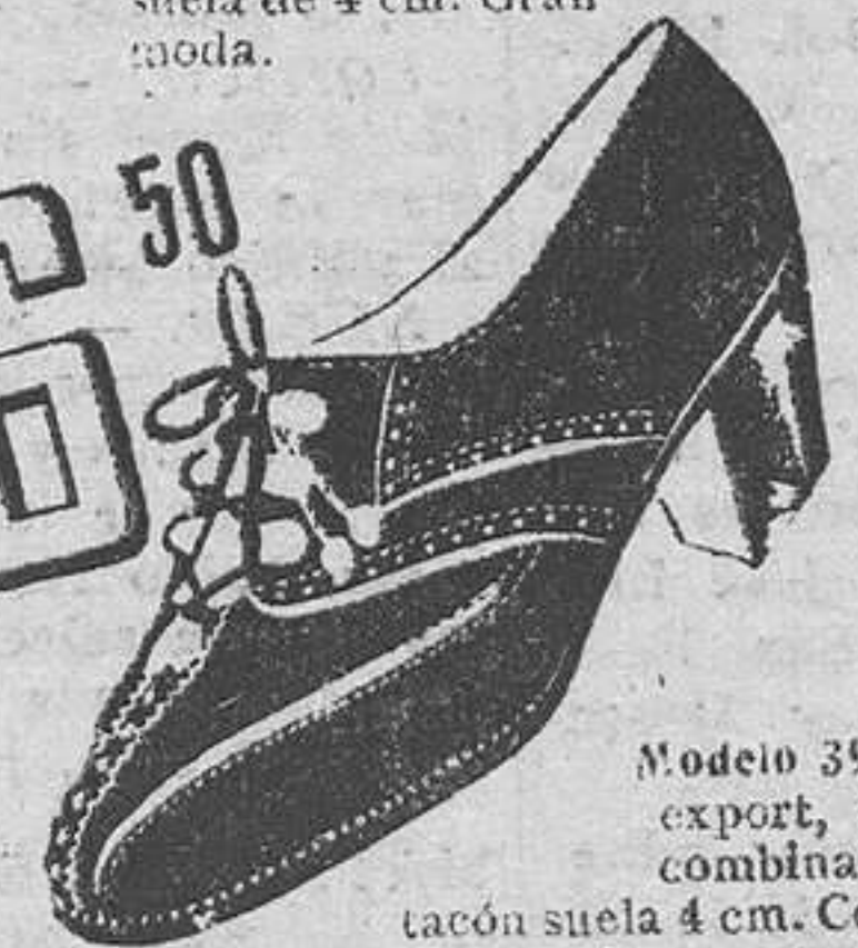
Modelo 3936.—Zapato export, ante negro, combinación charol, tacón suela 4 cm. Cosido Goodyear. De nuestras últimas creaciones.