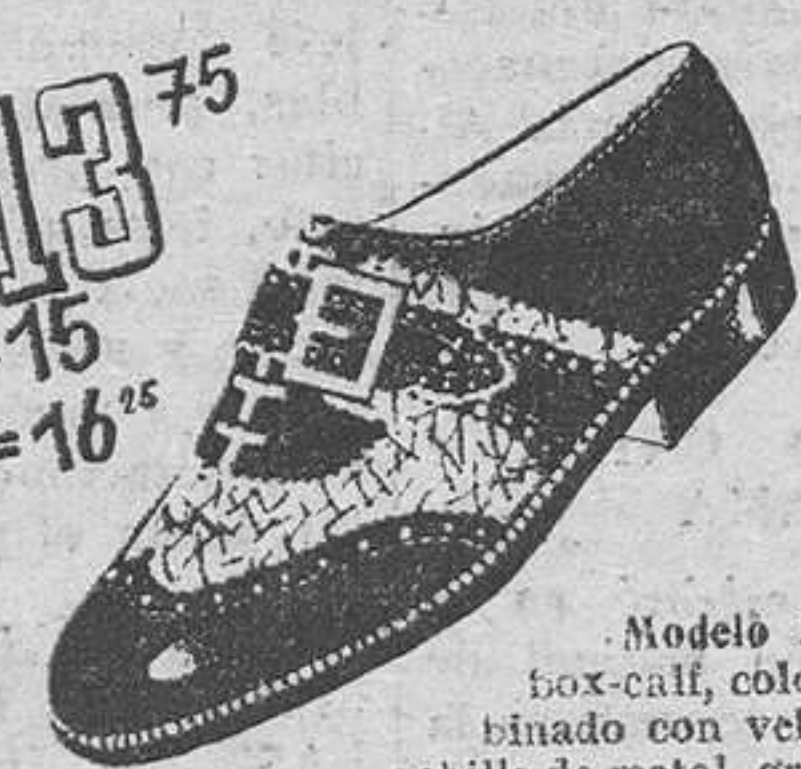
Modelo 3614.—Zapa-to box-calf, color marrón, com-binado con ve-loure beige con hebilla de metal, gran moda. Cosido Goodyear.