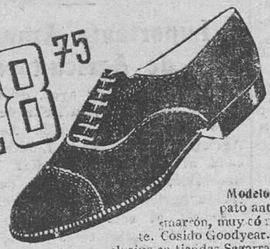
Modelo 3227.—Za-pato antilope, color marrón, muy có-mo y elegan-te. Cosido Goodyear. (Artículo ex-clusivo en tiendas Segarra).