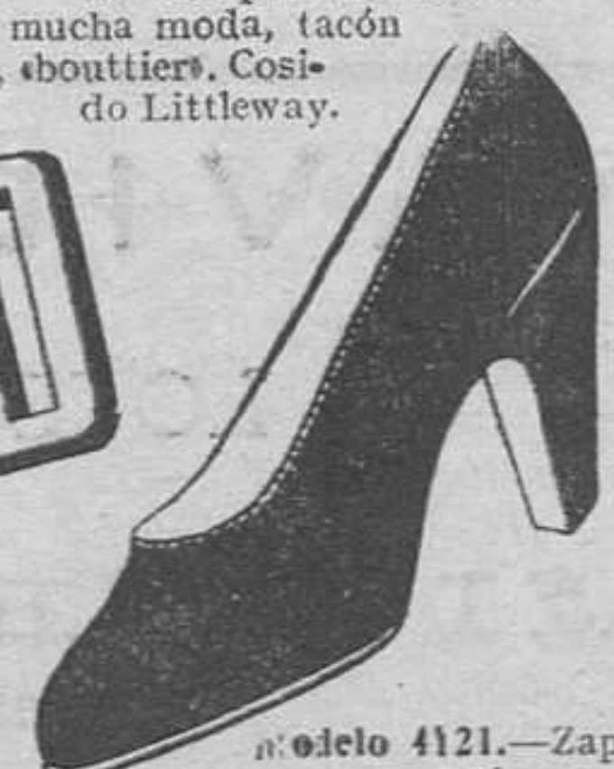
Modelo 4121.—Zapato salón, antilope negro, primera, tacón sbouttier 6 cm. Cosido Littleway. (Tenemo el mismo en charol negro).