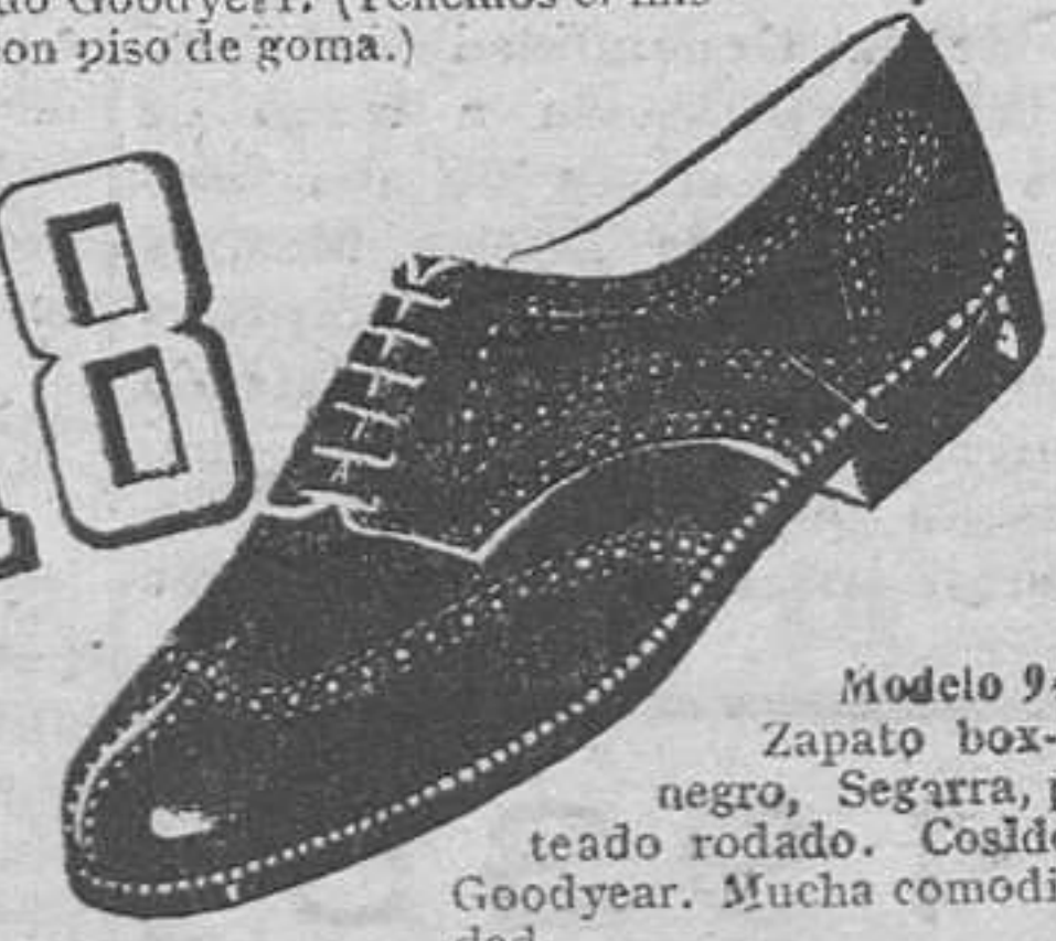
Modelo 94.—Zapato box-calf negro, Segarra, pun-teado rodado. Cosido Goodyear. Mucha comodi-dad.