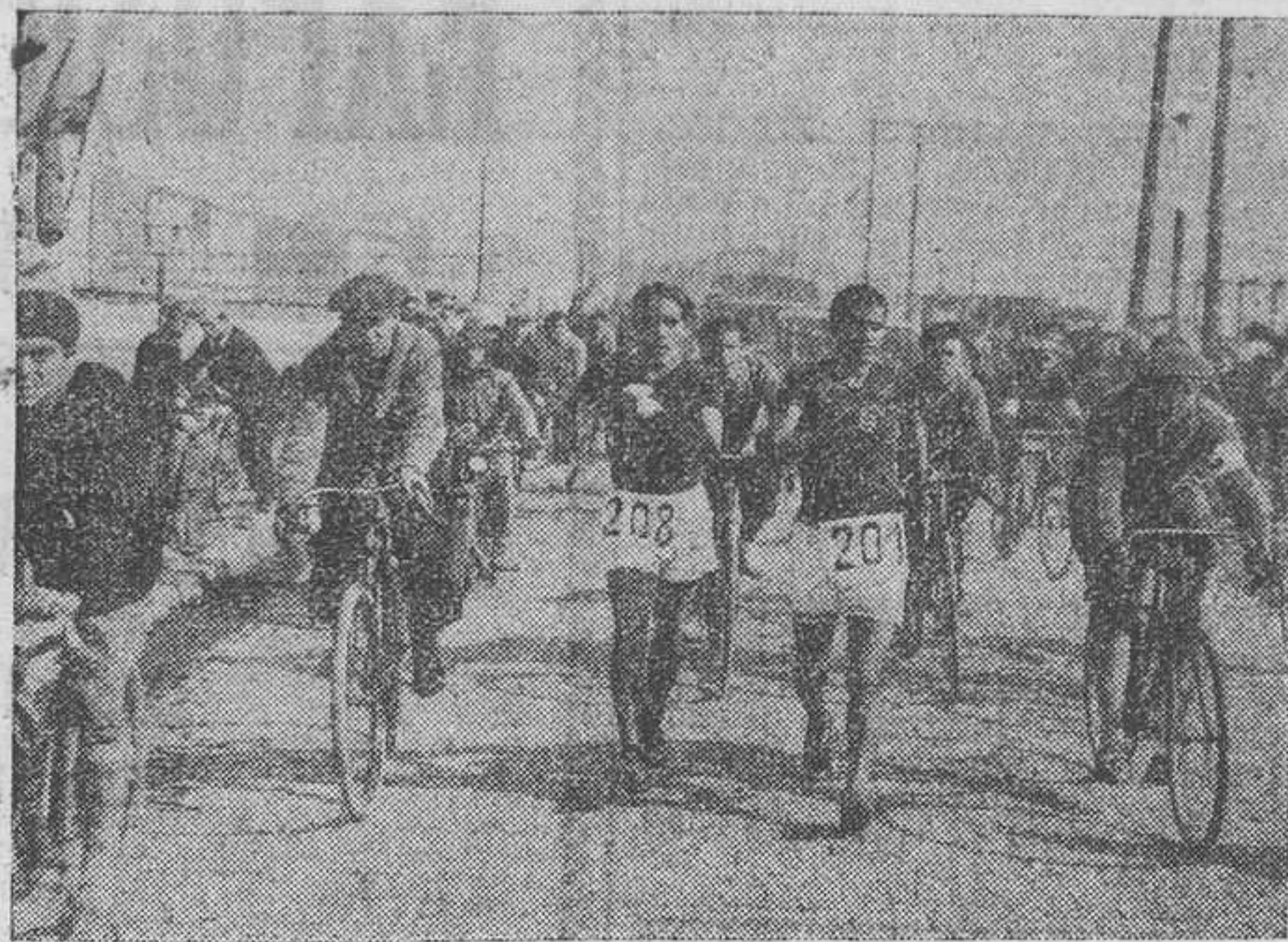
La alta calidad atlética de los dos primeros clasificados quedó demostrada en el «codo a codo» entablado en el campo del F. C. Badalona después del gran número de kilómetros recorridos.

El constante labor de los participantes del III Campeonato de España de Marcha (fondo), y el trabajo de propaganda deportiva, predicando con el ejemplo, de nuestro querido colega Deportes, organizando esta competición en colaboración con la Federación Catalana de Atletismo, han vuelto a colocar a la marcha atlética en el puesto espléndido a que la habían instituido los Caerlot, Meléndez, Badia, etc., en sus días de gloria y esplendor. El numeroso público que acudió a presenciar la magna manifestación de esta rama del atletismo así lo comprendió, haciendo acto de presencia en lo largo del circuito y a la llegada a la meta en el Salón de San Juan, complaciéndose de poder admirar nuevamente las luchas nobles entre los especialistas de este deporte.