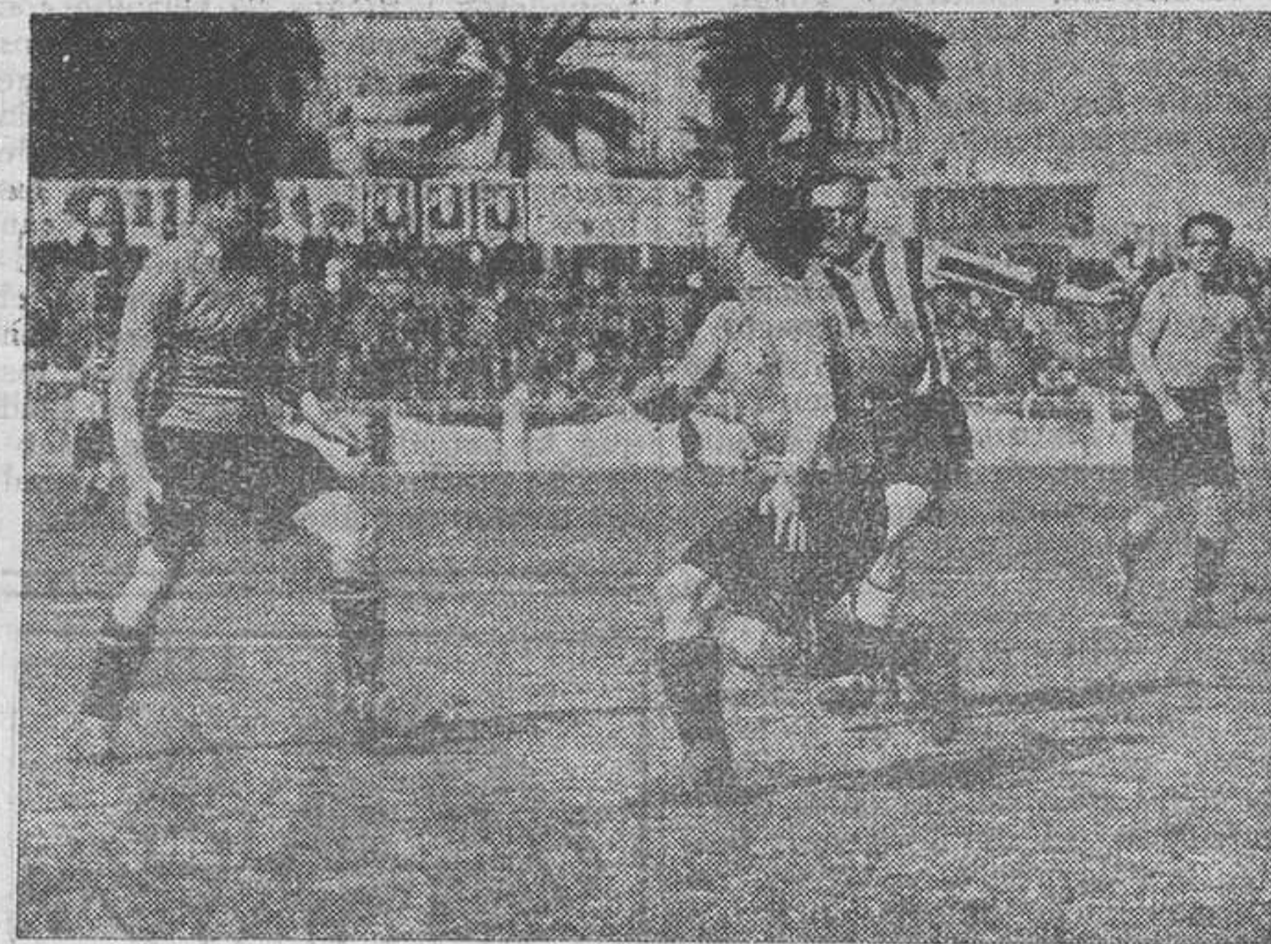
La línea media españolista interceptando una gran jugada del delante guipuzcoano.

R. U. de Irún. — Emery, Alza, Anza, Gamborena, Maya