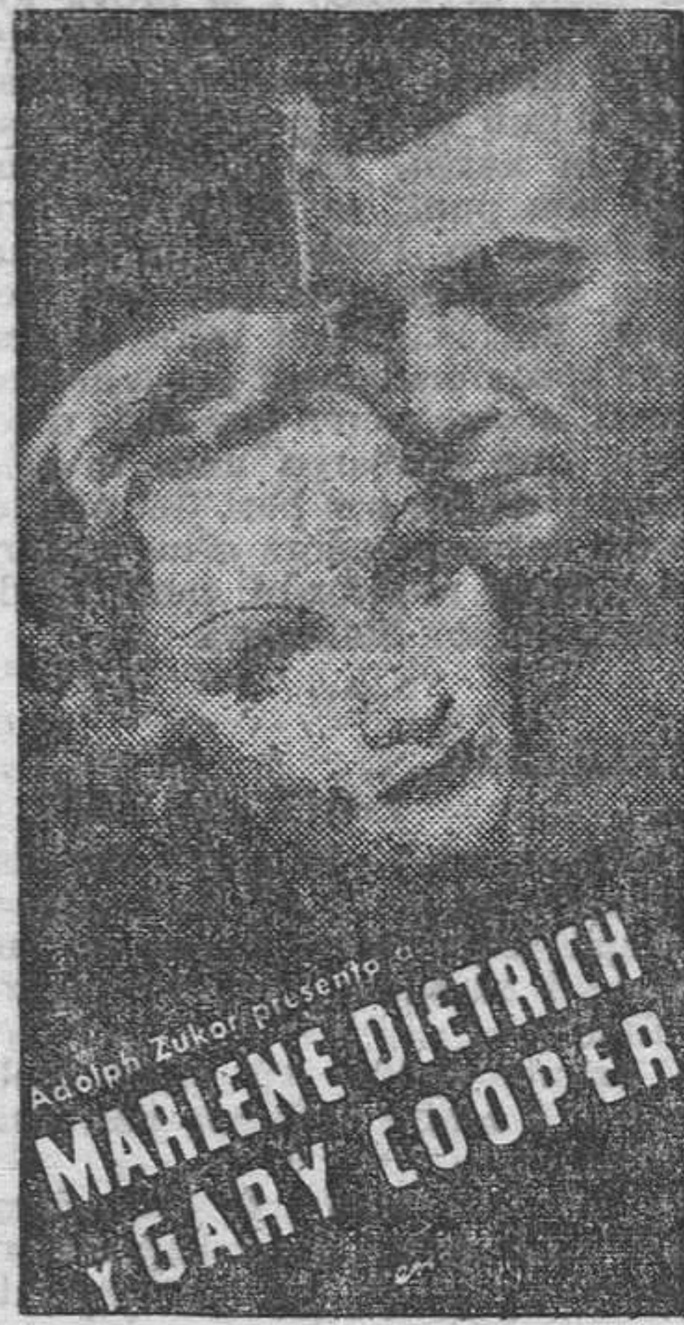
«Desig», la superproducció Paramount, l'èxit més gran d'aquesta temporada al Coliseum.

«Francesc Camacho ha realitzat El cura de aldea amb absoluta dig-