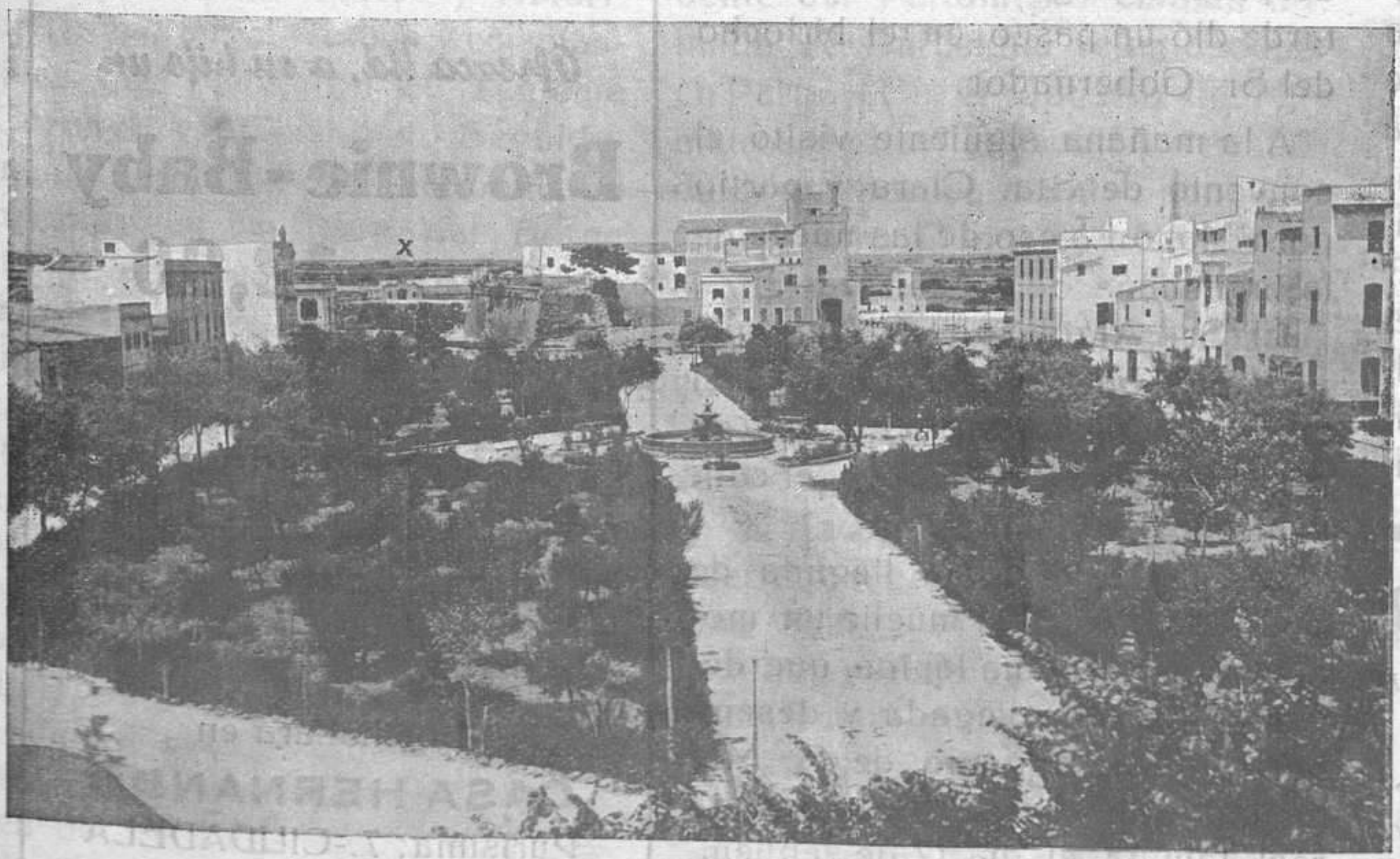
CIUDADELA—Plaza de Colón. Al fondo (x) se ve la entrada a los Cuarteles donde se aloja el batallón de Ametralladoras recientemente llegado.

Ciudadela se portará hidalgamente con ellos, como sabe se han de comportar ellos con sus hijos.