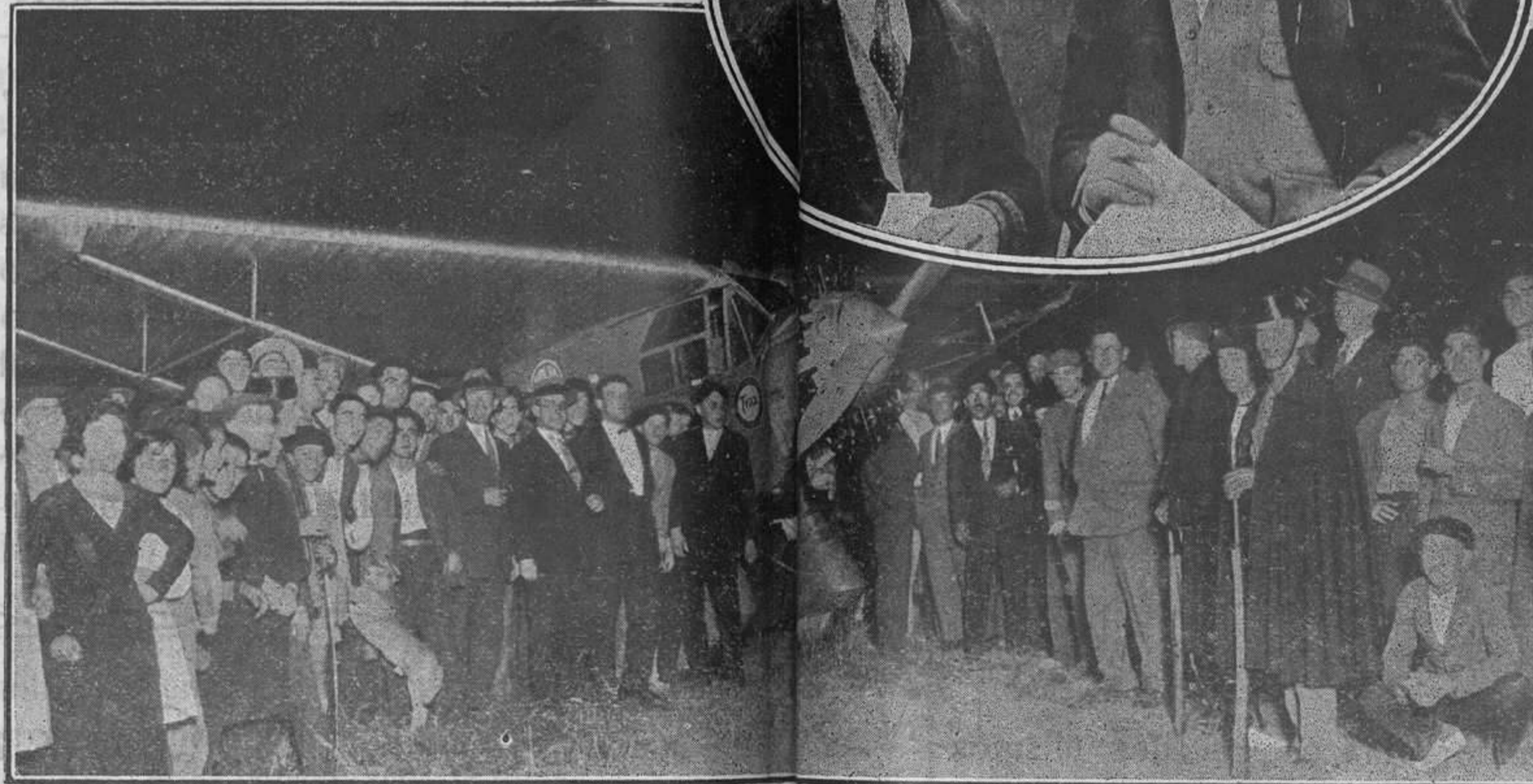
El «Path Finder», momentos después de aterrizar en la Albericia (Santander)