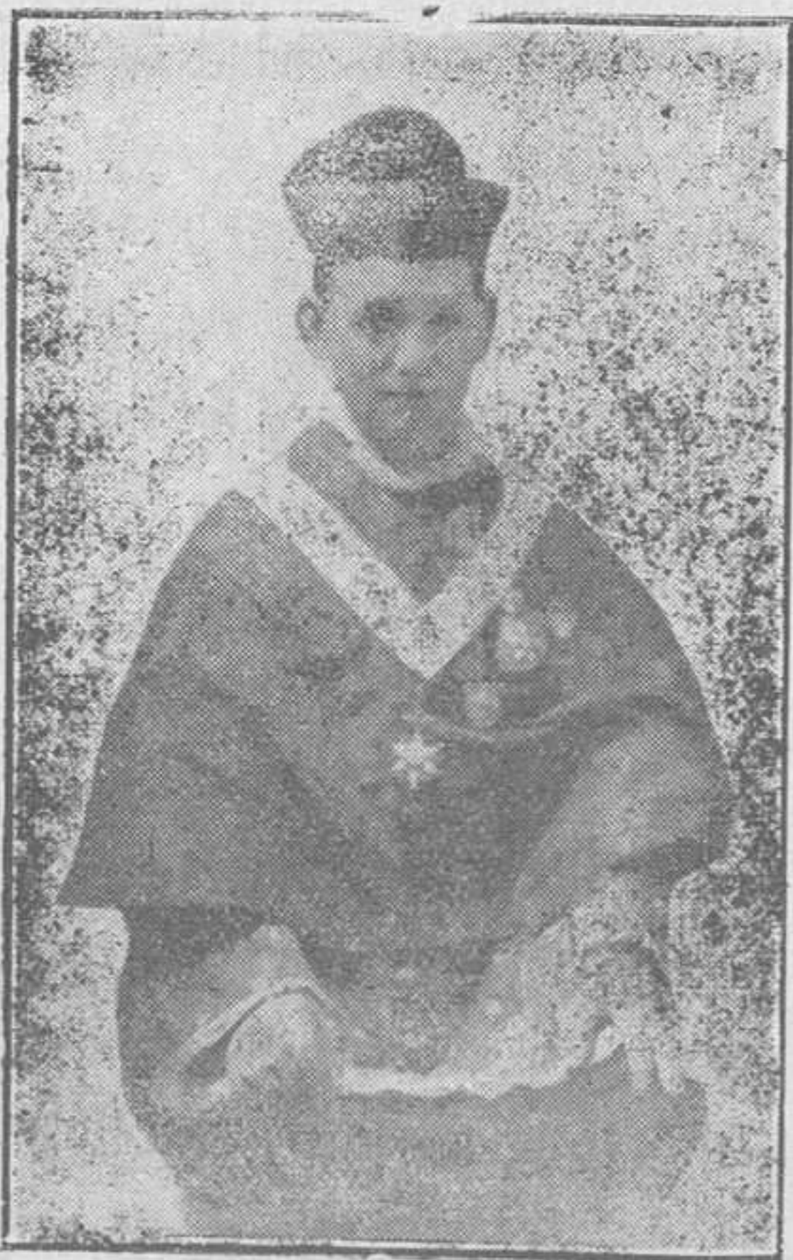
DEÁN DE LA CATEDRAL DE MENORCA

Tú también, de la palmera, que se yergue pura al Cielo, fuiste un símbolo perenne, sublimado en la oración; y en sus alas venturosas al alzar de este suelo, nos henchiste de dulzuras con tu tierna devoción.