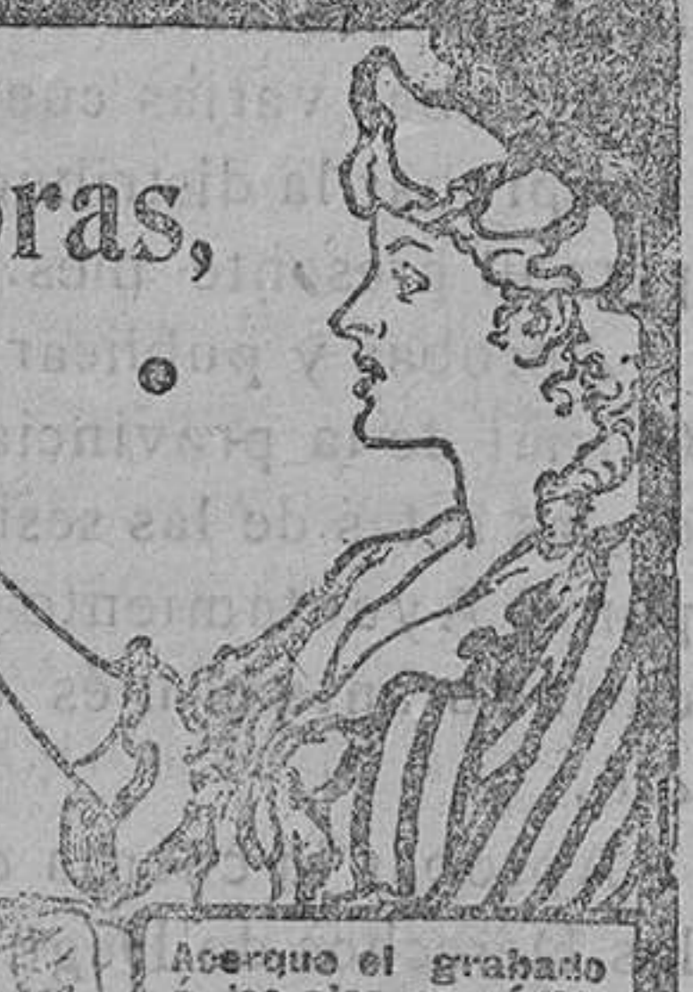
Acerque el grabado a los ojos y verá que la píldora entra en la boca.

DE VENTA EN LAS BOTICAS DEL MUNDO ENTERO. 40 Píldoras en Caja.