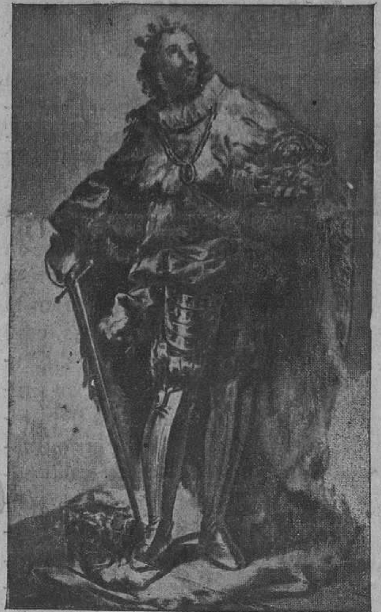
SAN FERNANDO Rey de España (Cuadro de Vicente Lopez)

iglesia del monasterio cisterciense de Las Huelgas; Doña Berenguela impúsole el cingulo militar, y el mismo Rey tomó del altar el pesado mandoble y se lo ciñó. Aquel día fué célebre en la Historia de España; sin duda hubo fiesta también en el cielo. El Arzobispo de Toledo Don Rodrigo Ximénez de Rada obtuvo Bula de Cruzada del Pontífice Honorio III, y por largos lustros el pendón morado de Castilla ondeó triunfante sobre el firmamento radiante de la Bética. Baeza, Ubeda, Córdoba, Murcia, Jaén, con centenares de villas y castillos cayeron sucesivamente ante aquella espada que guiaba la mano del Excelso. Hasta que en la mañana del 22 de diciembre de 1248 pudo coronar Fernando con la Cruz salvadora los airosos mi-