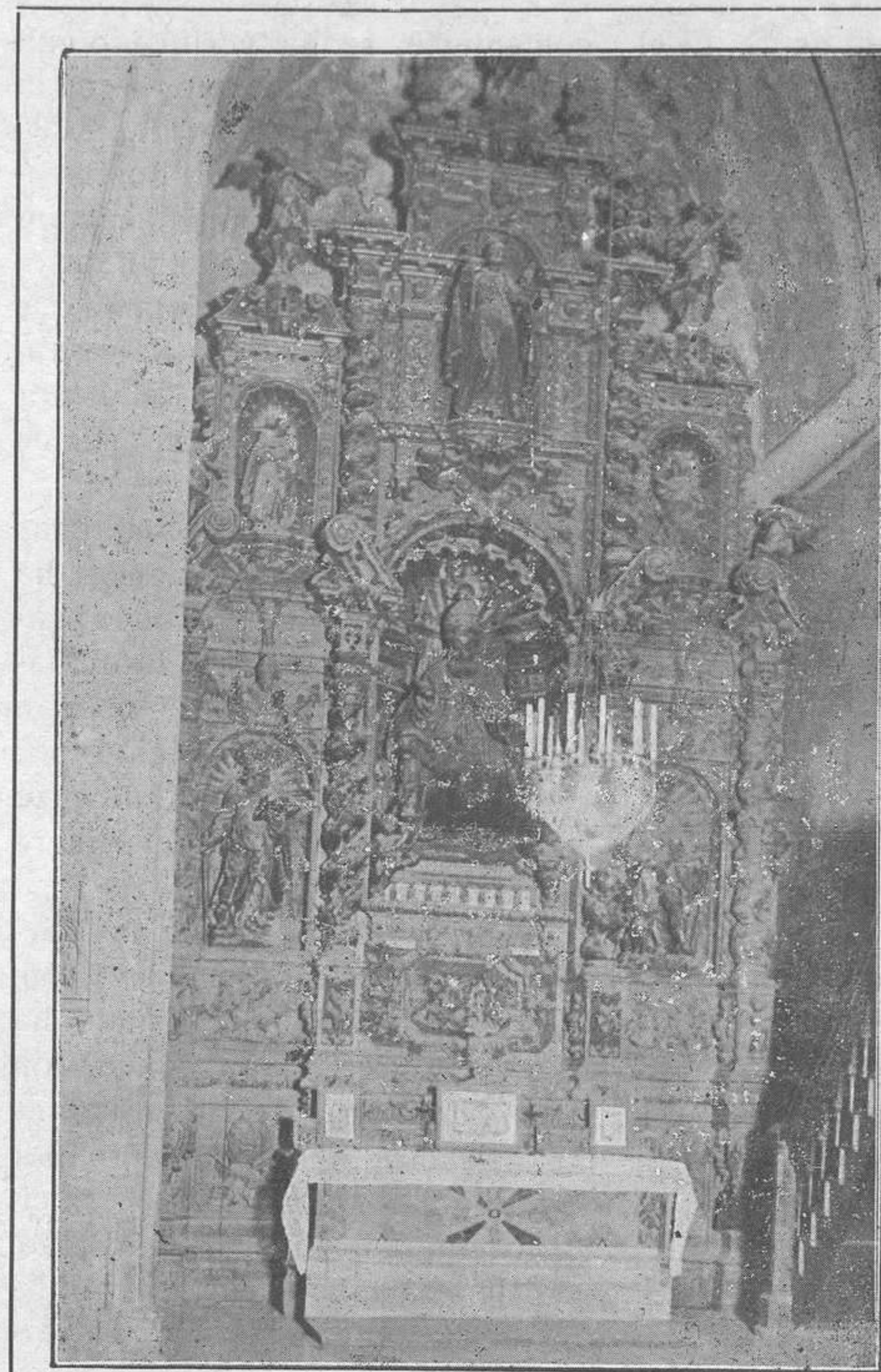
MAGNIFICO RETABLO DE S. PEDRO QUE EXISTIA EN NUESTRA S. I. CATEDRAL.

8.º CAPILLA DE SAN PEDRO. Magnífico retablo barroco del siglo XVII, de verdadero mérito artístico. En la hornacina central aparecía la imagen de San Pedro, sentado en su trono, revesti-